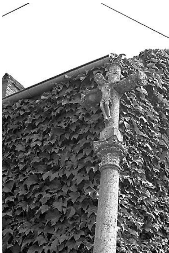
Vue des parties supérieures.