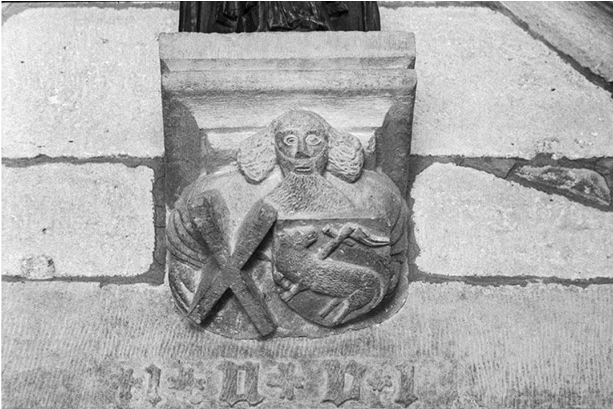
Intérieur : culot.