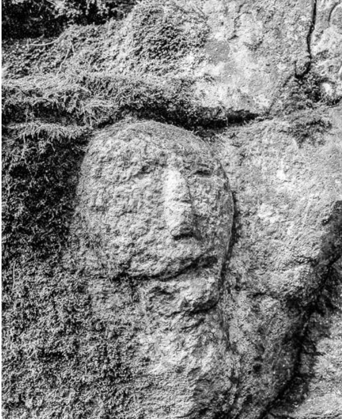
Tête sculptée dans le mur.