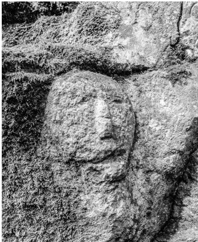
Tête sculptée dans le mur.