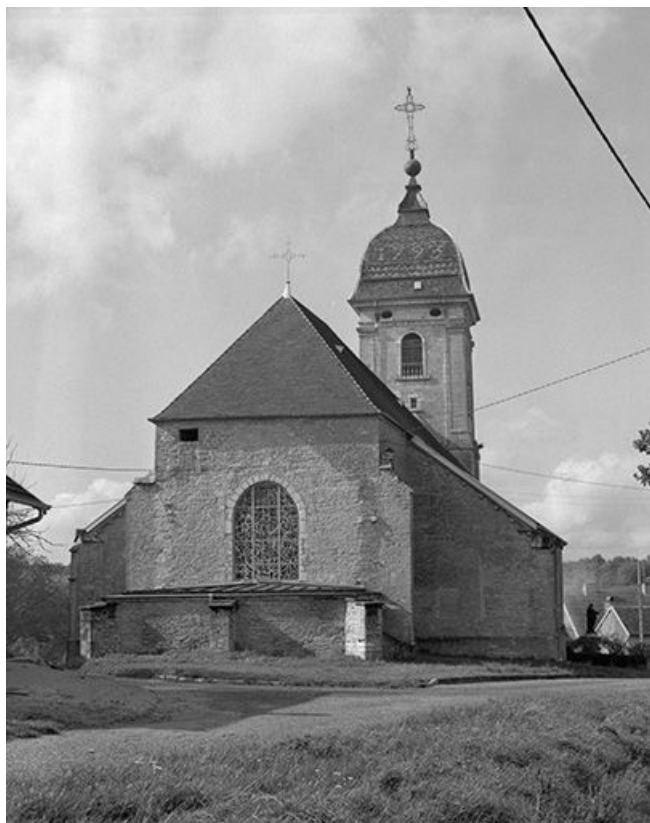
Face postérieure et clocher.