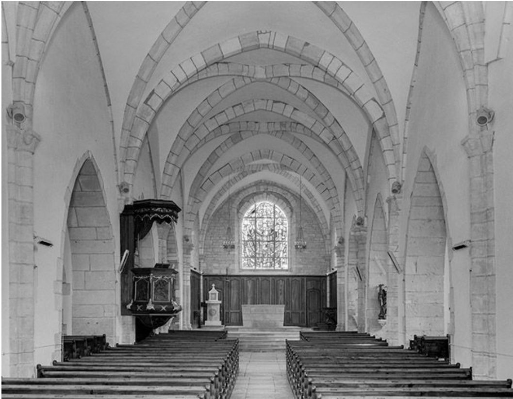
La nef et le chœur.