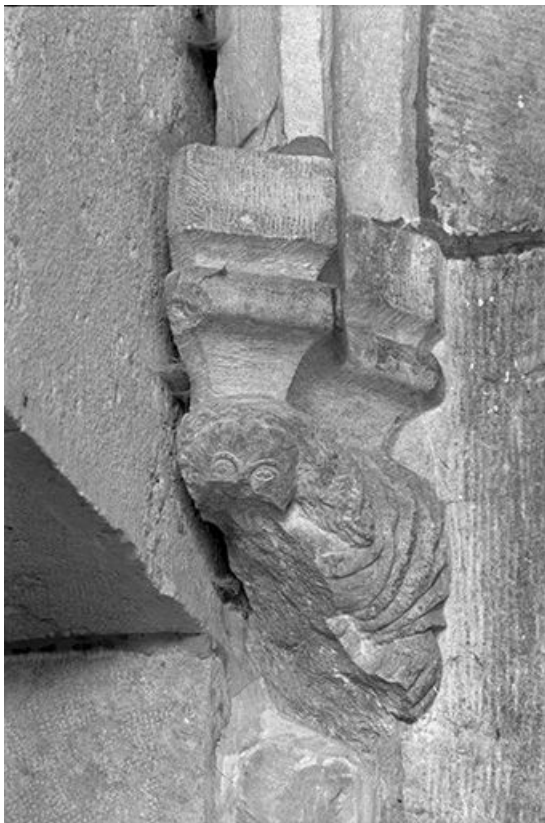
Intérieur : culot.