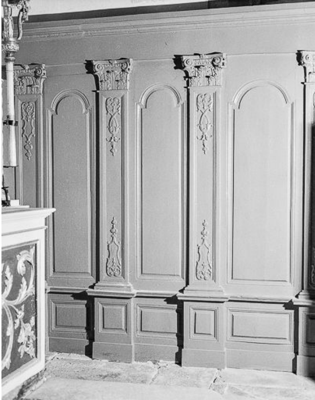
Détail : lambris.