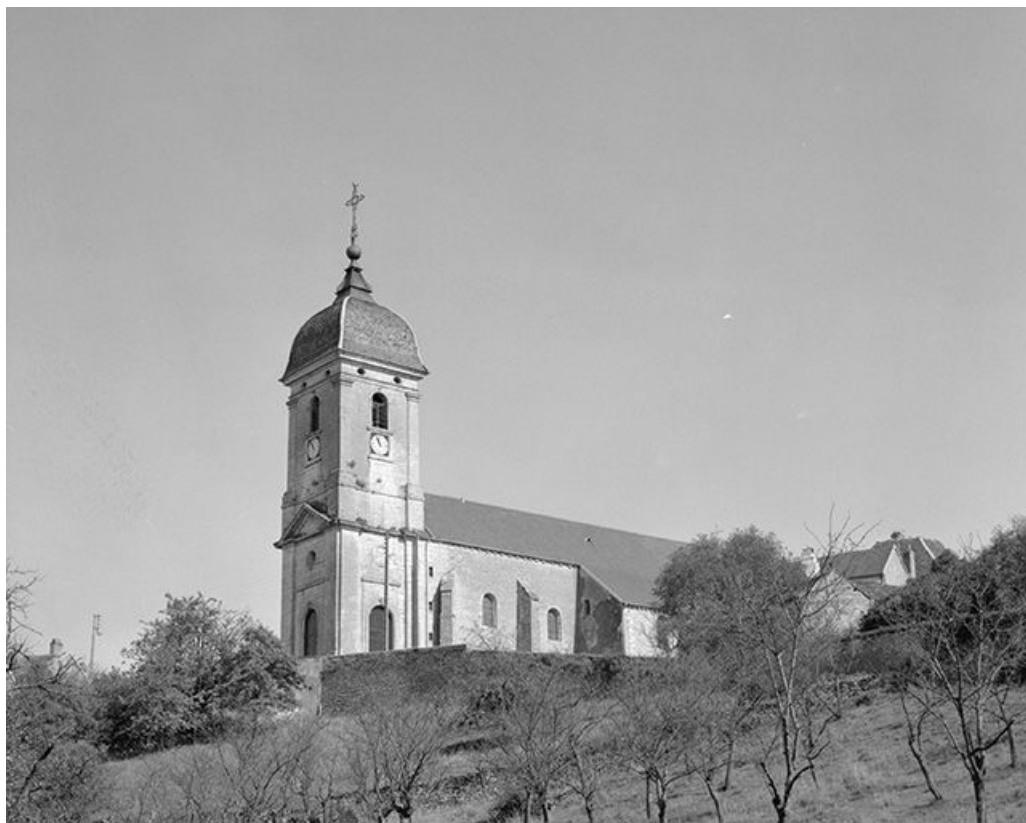
Façade latérale droite et clocher.