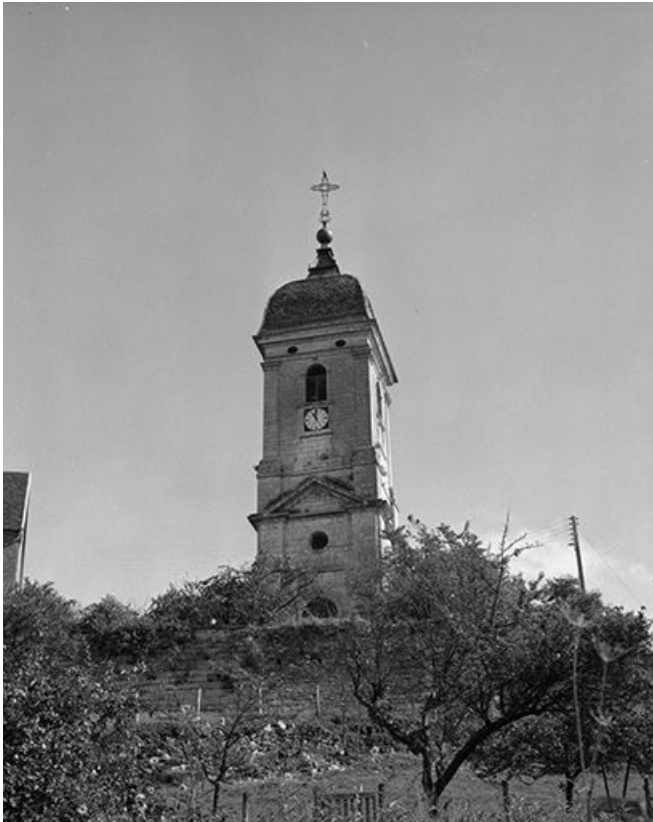
Vue du clocher.