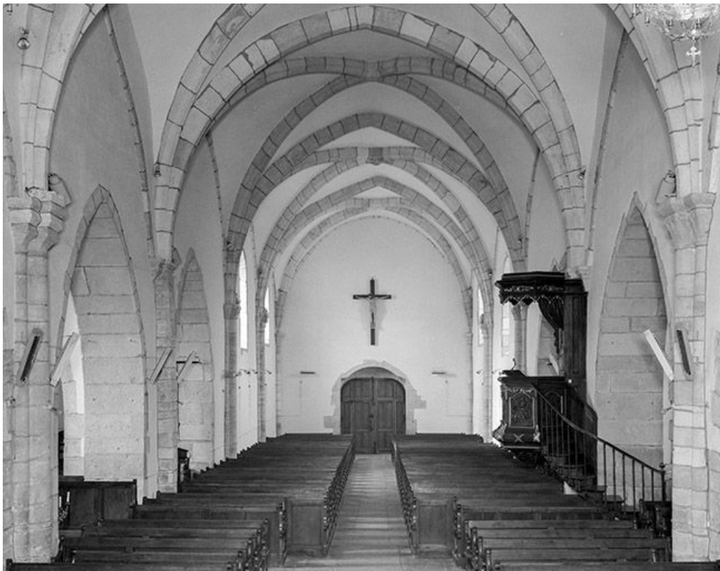
La nef vue depuis le chœur.