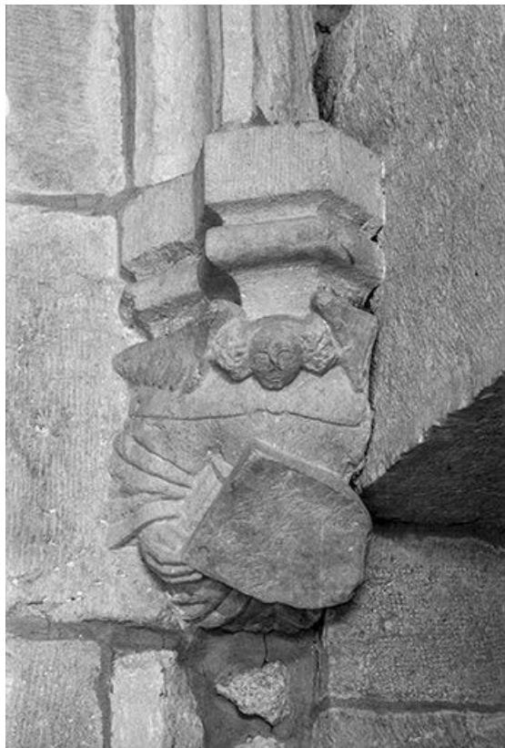
Intérieur : culot.