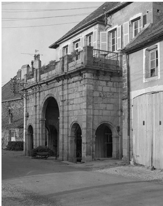
Façade antérieure vue de trois quarts droit.