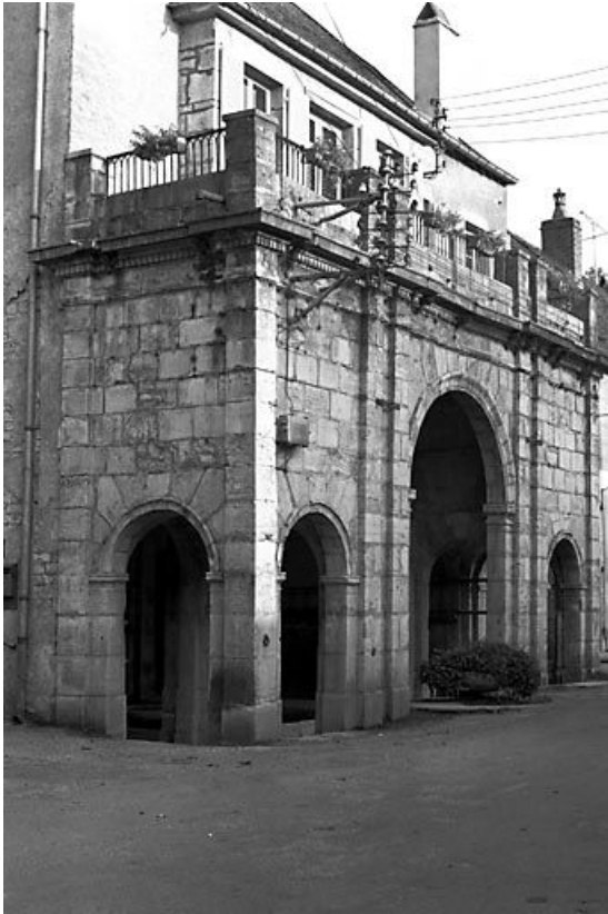
Façade antérieure de trois quarts gauche.