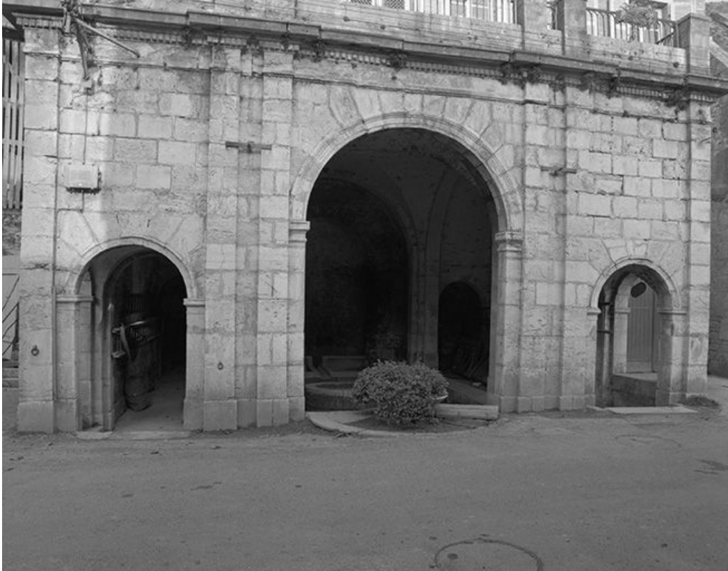
Façade antérieure : détail du rez-de-chaussée.