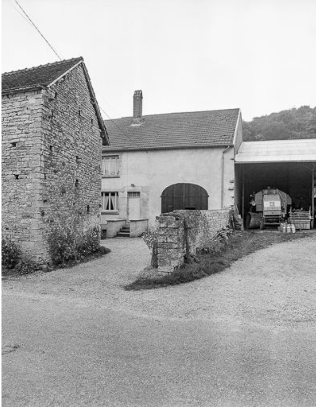
Façade sur cour.