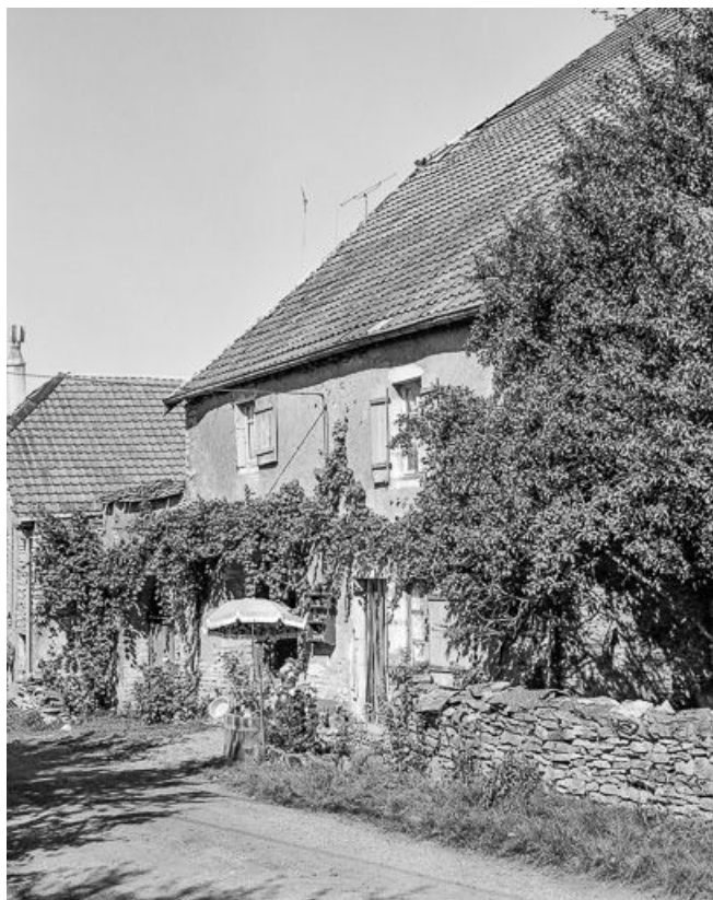
Vue d'ensemble de trois quarts droit.