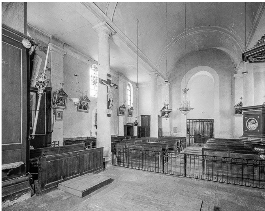
Intérieur : nef et bas-côté gauche vers le chœur.