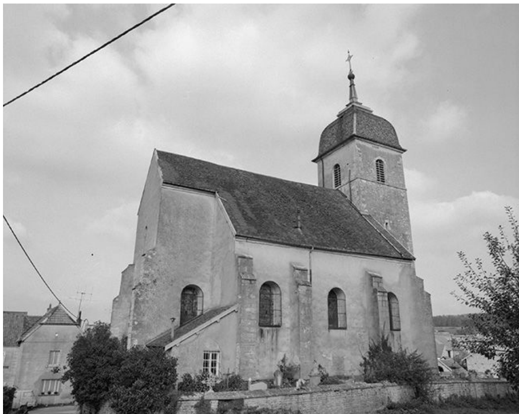
Face latérale gauche.