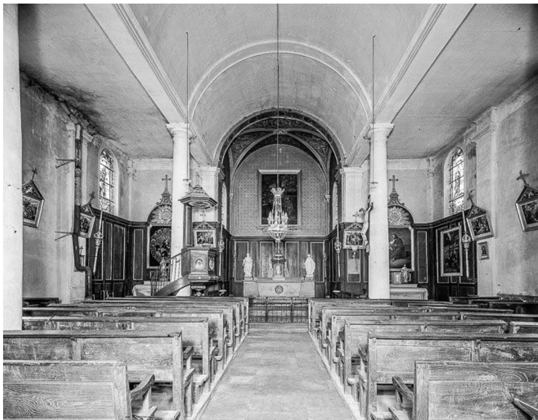
Intérieur : nef et choeur vus depuis le fond de l'église.