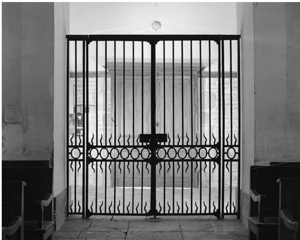
Clôture de chapelle : vue d'ensemble.