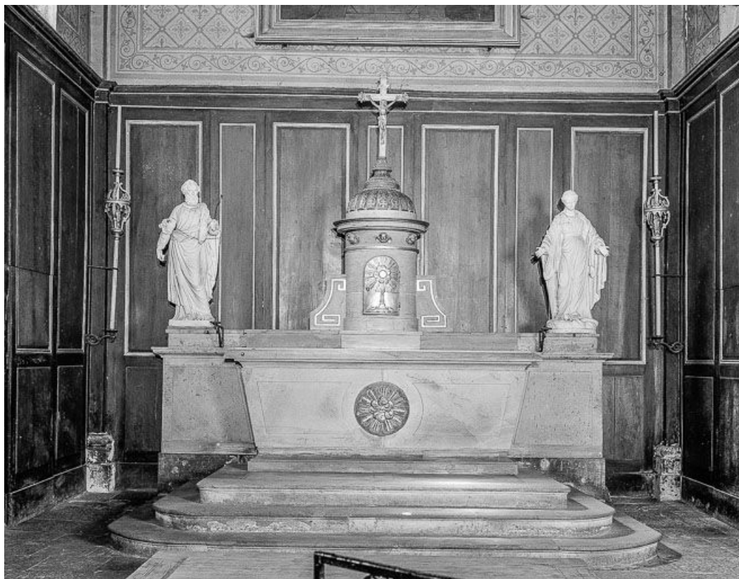
Intérieur : maître-autel et tabernacle. 70, Autoreille Grande Rue