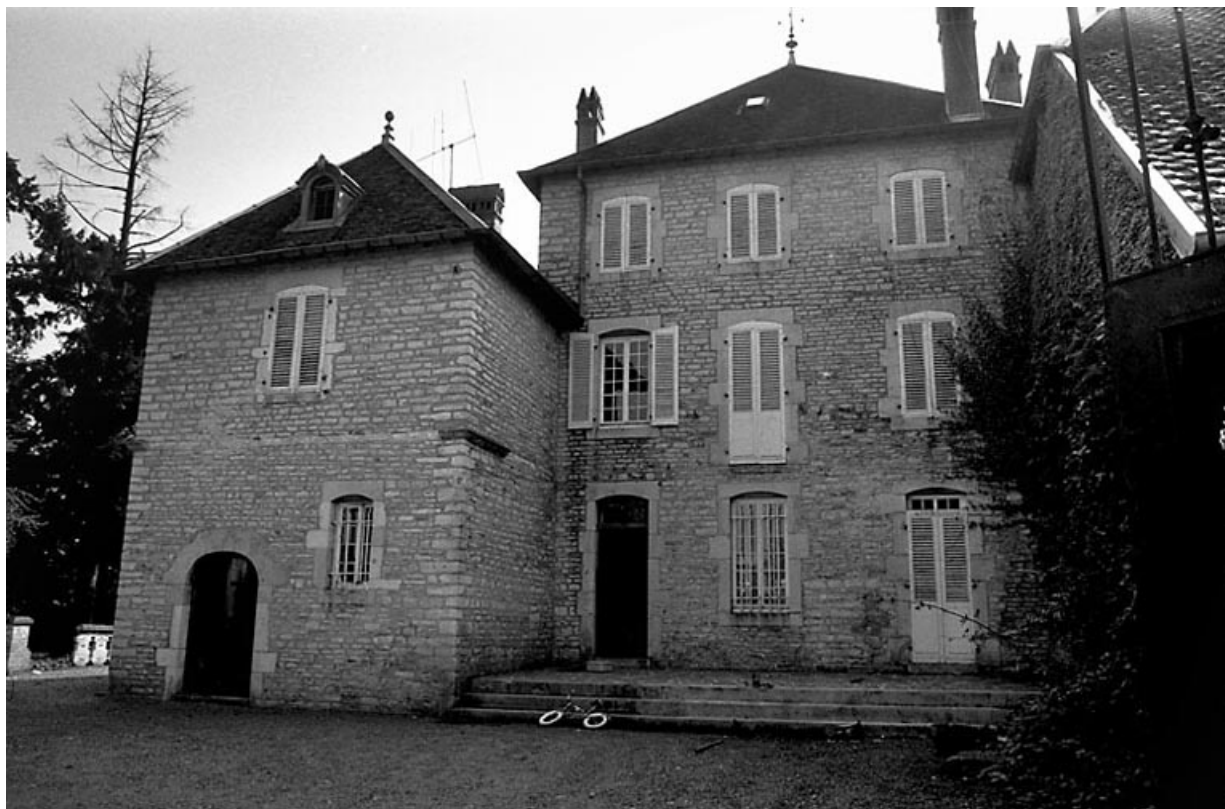
Façade antérieure sur cour de la maison de maître.