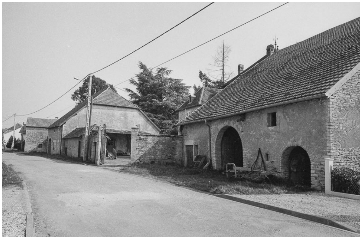
Vue d'ensemble de trois quarts droit. 70, Vregille chemin rural du Pré Simon