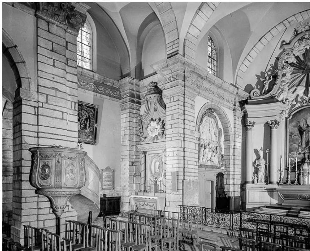
Bras du transept gauche et chœur.