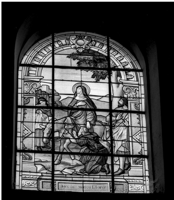
Baie n° 108 : sainte Thérèse ou sainte Françoise romaine.