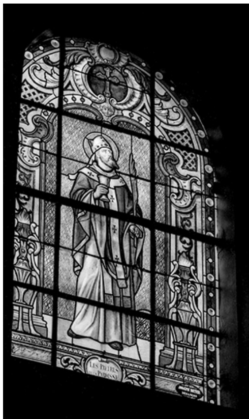
Baie n° 101 : saint Ferréol.