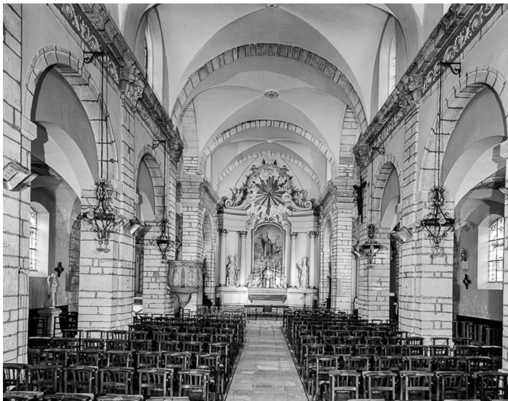
Nef et chœur vus depuis l'entrée.