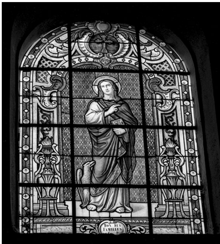
Baie n° 109 : saint Jean Evangéliste.