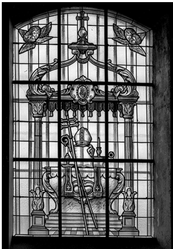
Baie n° 6 : insignes de l'évêché.