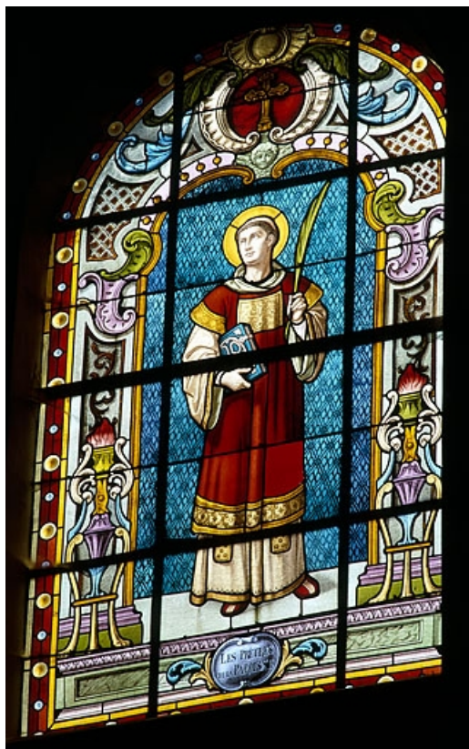
Baie 102 : saint Ferjeux.