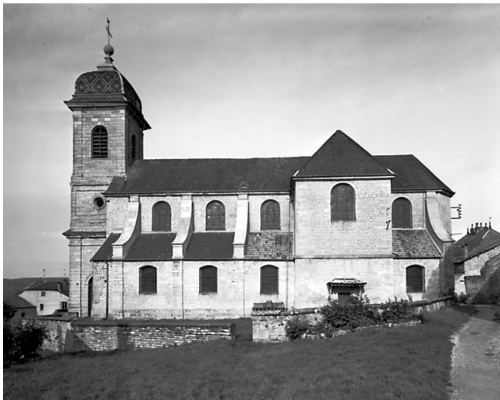
Façade latérale droite. 70, Pin place de l' Eglise