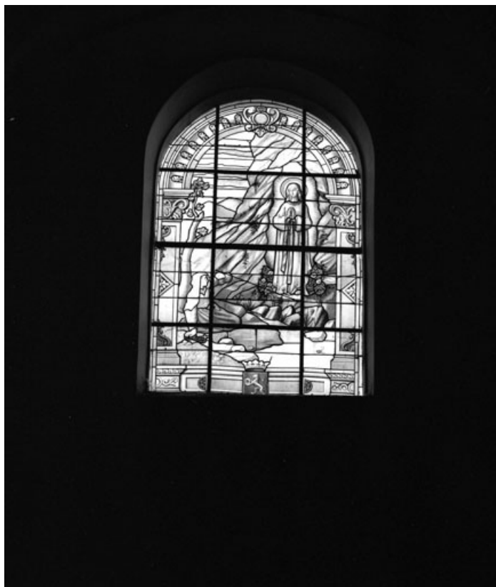
Baie n° 104 : Apparition de la Vierge à Lourdes.