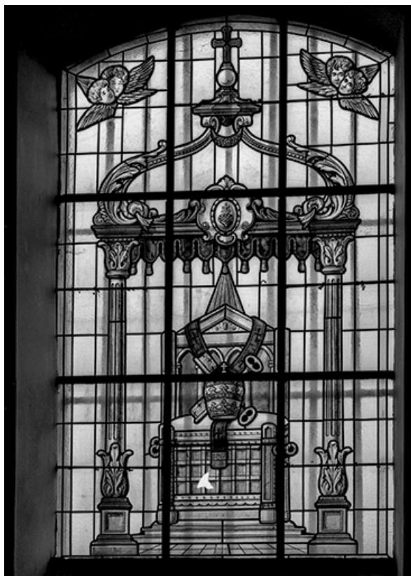
Baie n° 5 insignes de la papauté.