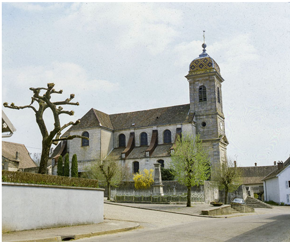
Vue d'ensemble de trois quarts gauche.