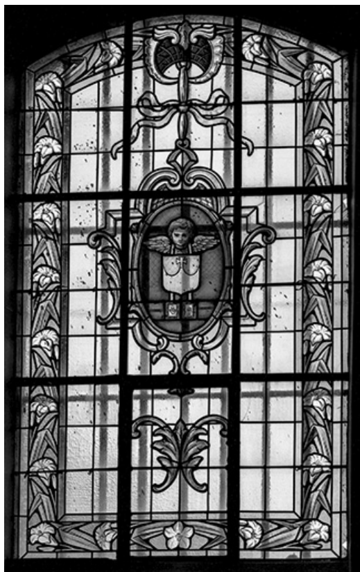
Baie n° 4 : emblèmes ou insignes de dévotion catholique.