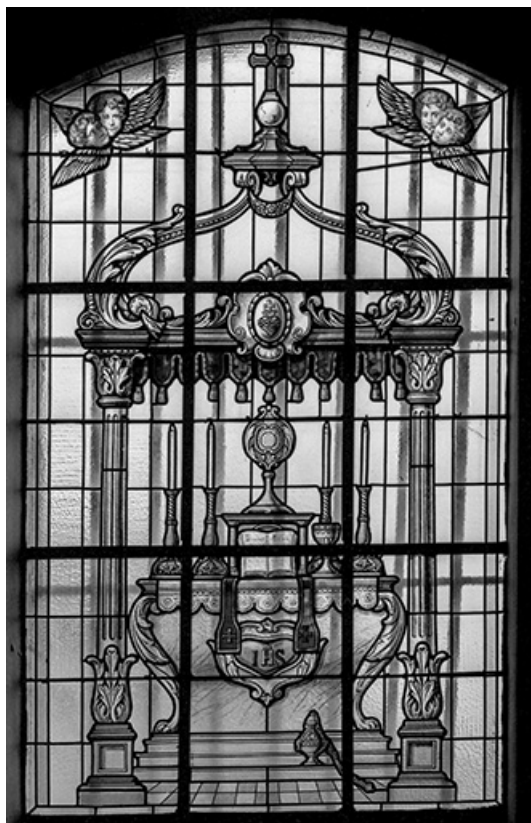
Baie n° 2 : insigne du sacerdoce.