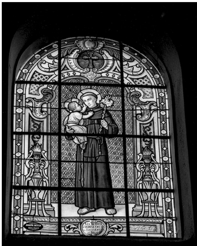
Baie n° 110 : saint Antoine de Padoue.