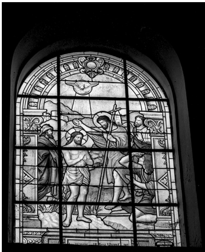
Baie n° 107 : Baptême du Christ.