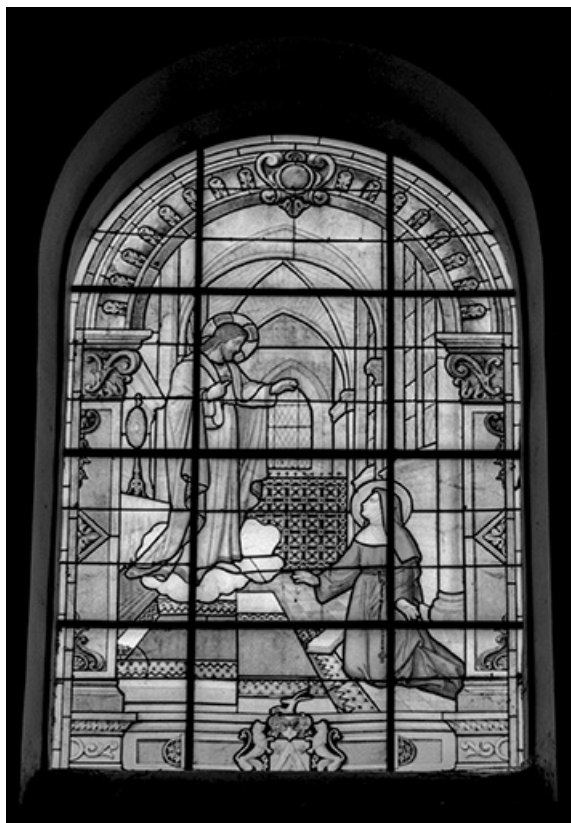
Baie n° 103 : Apparition du Sacré Coeur à Marguerite Marie.