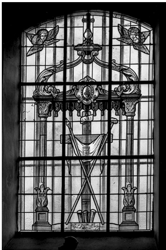
Baie n° 1 : instruments de la Passion.