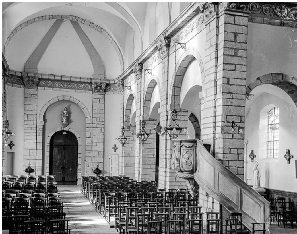
Vue de la nef.