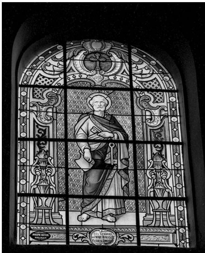
Baie n° 106 : saint Pierre.