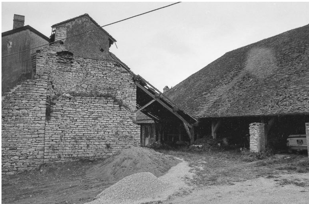
Façade latérale gauche du four.