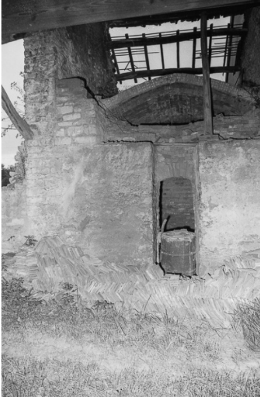
Façade antérieure du four.