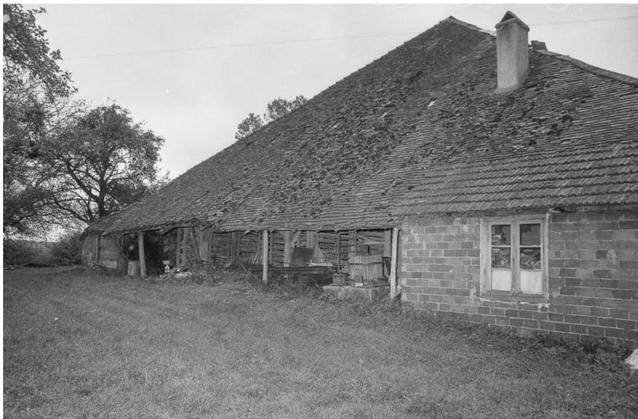
Séchoir : façade antérieure.