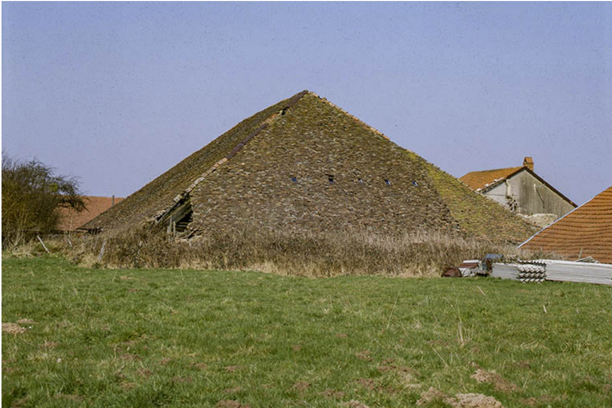
Détail : le toit du séchoir.