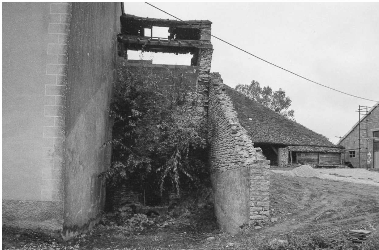
Le four, façade postérieure.