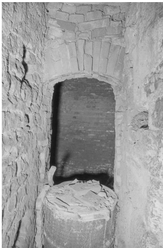
Détail de la façade antérieure du four.