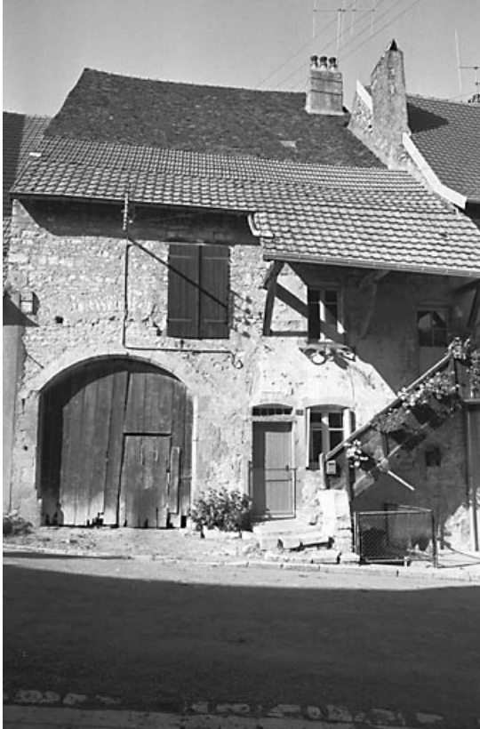
Façade sur rue. 70, Marnay