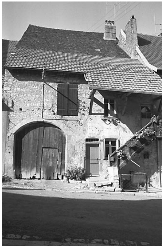
Façade sur rue.