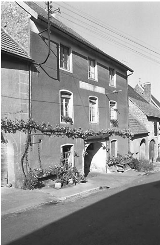
Vue d'ensemble de trois quarts gauche. 70, Marnay