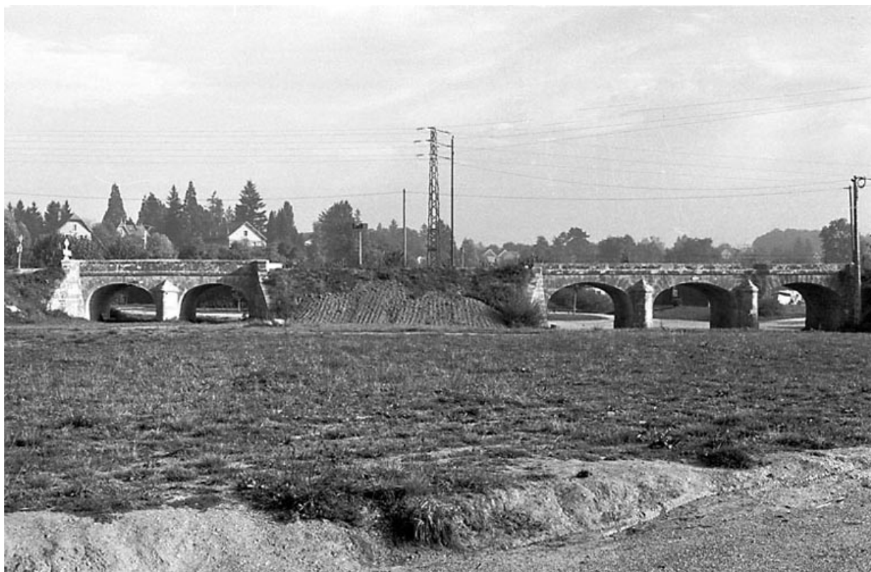
Vue d'ensemble. 70, Marnay R.N. 67