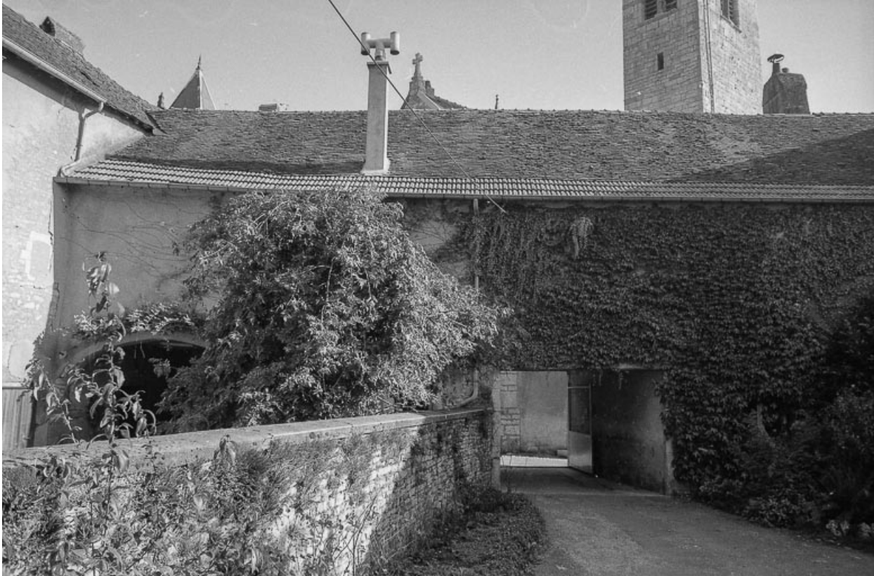
Bâtiment d'entrée : façade sur cour. 70, Marnay rue de l' Eglise