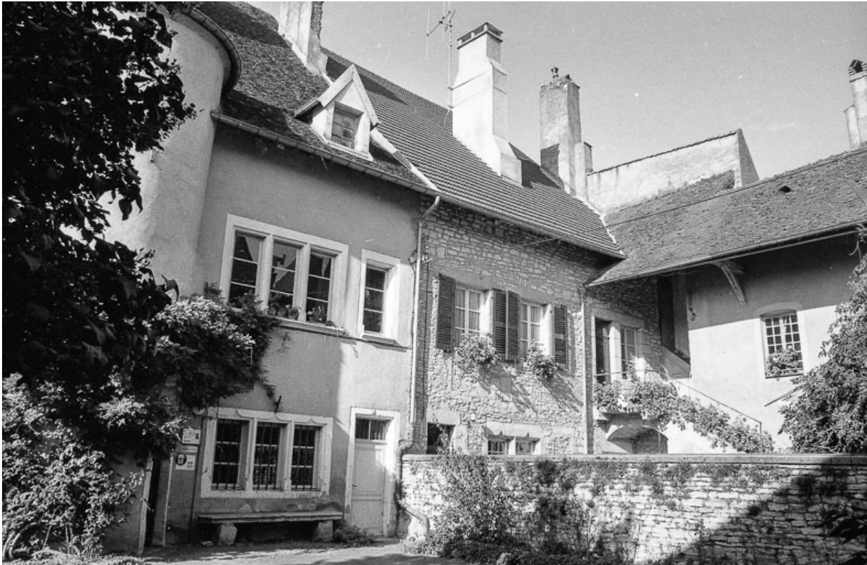
Façade antérieure sur cour.