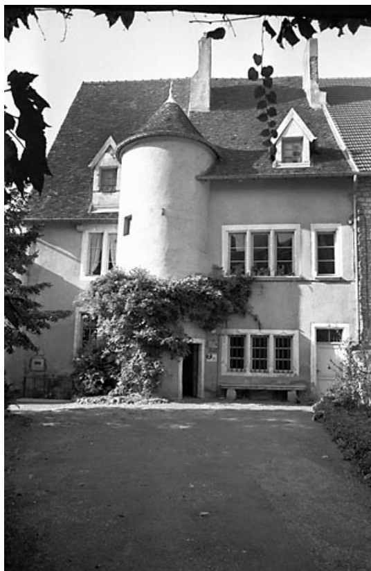
Façade antérieure sur cour : partie gauche. 70, Marnay rue de l' Eglise