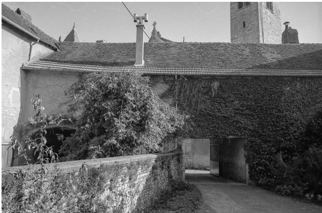
Bâtiment d'entrée : façade sur cour. 70, Marnay rue de l' Eglise