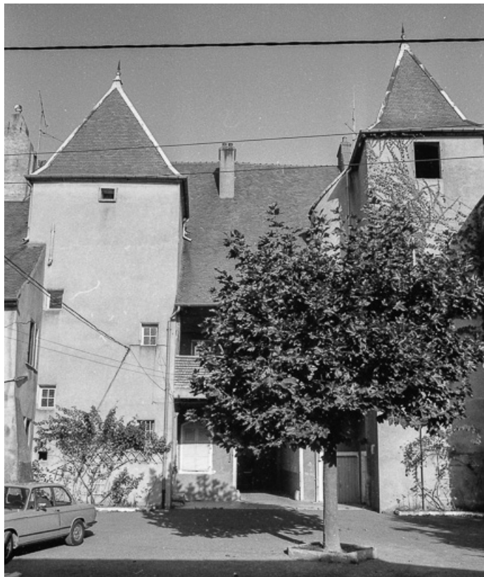
Façade sur cour.