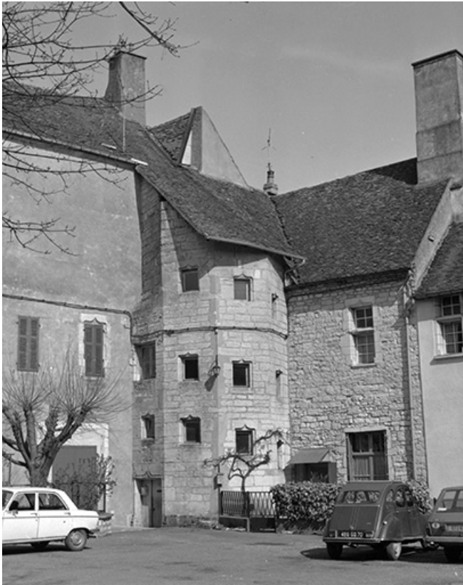
Détail : tour d'escalier.