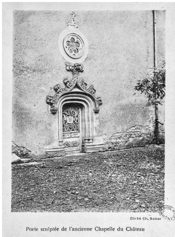
Porte extérieure de l'ancienne chapelle du château. 70, Marnay place Jean de Joinville