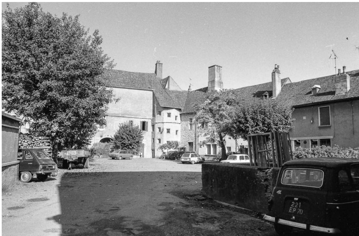
Vue d'ensemble de la cour.