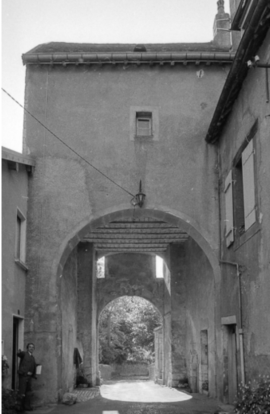
Ouvrage d'entrée : façade sur cour. 70, Marnay place Jean de Joinville