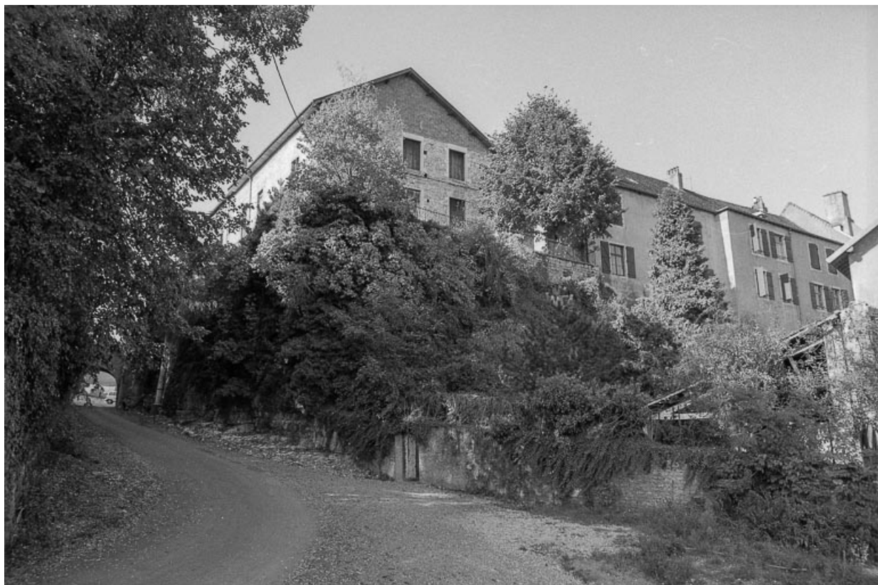
Façade est, partie gauche : vue depuis le chemin vicinal n°2 dit "des Grands Prés". 70, Marnay place Jean de Joinville