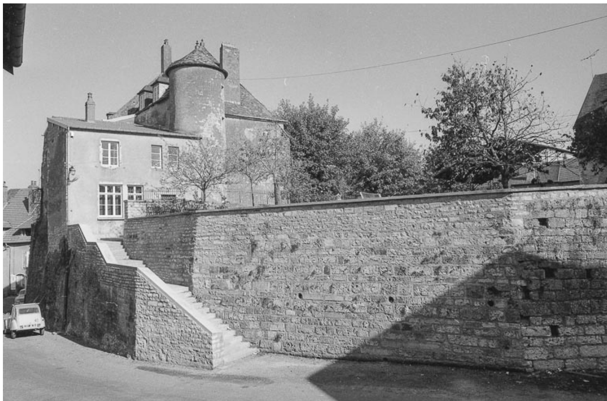
Enceinte, place de l'Eglise.