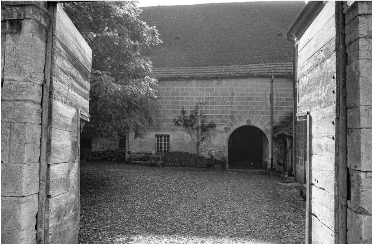
Vue sur la cour depuis le porche d'entrée.