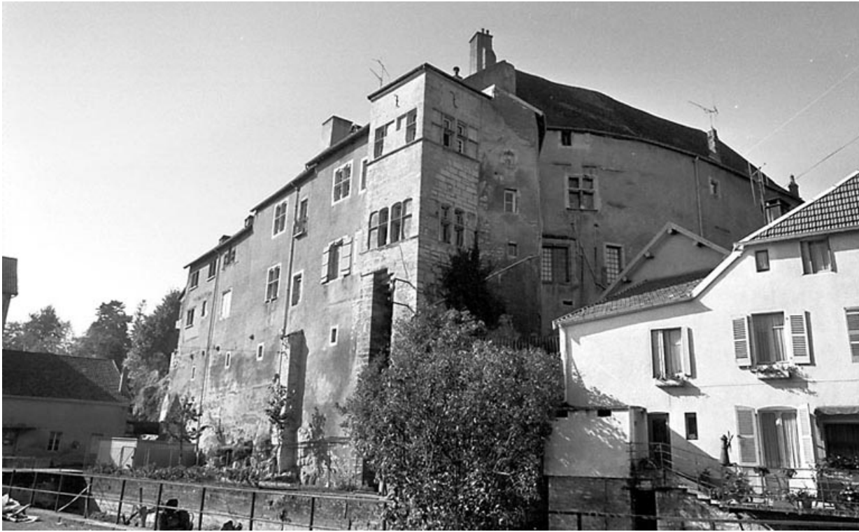
Façade est, partie droite.