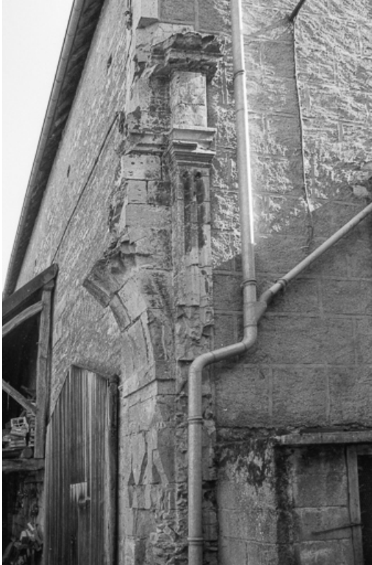
Cour : restes d'arcature.