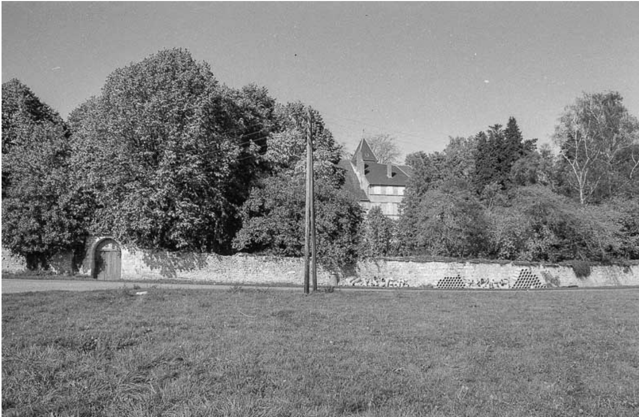
Vue depuis les rives de l'Ognon.