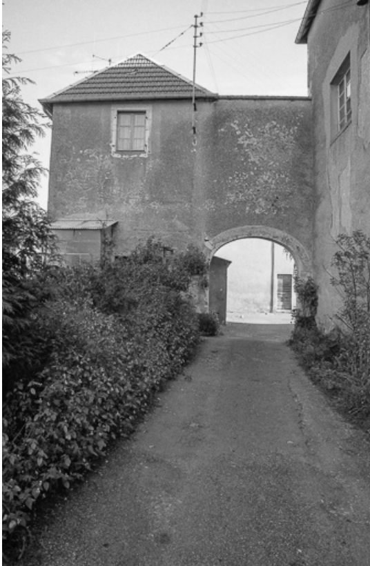
Portail d'entrée de la grande cour.