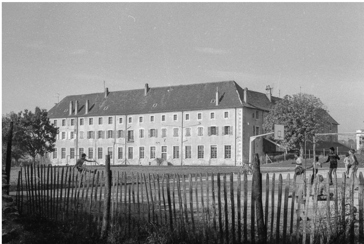
Vue depuis l'avenue de la Gare.