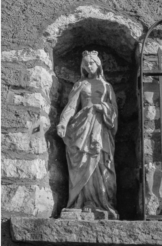
Vue de la statue de la Vierge dans le mur d'enceinte du couvent. 70, Marnay rue du Collège