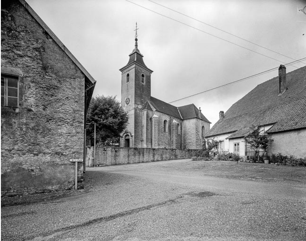
Faces postérieure et latérale droite.