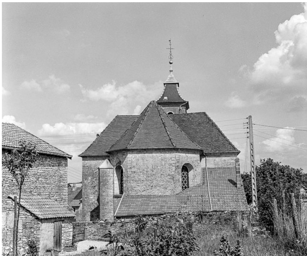
Choeur et toit de la sacristie.