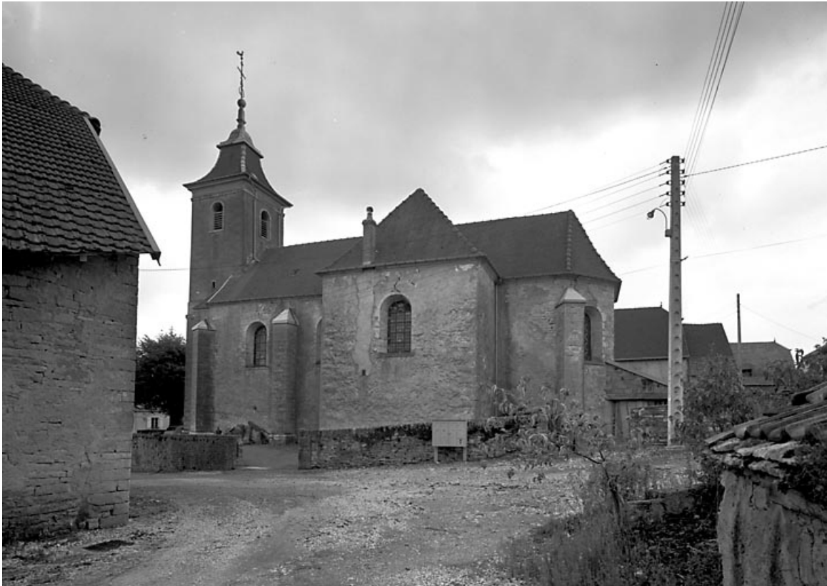
Façade latérale droite.