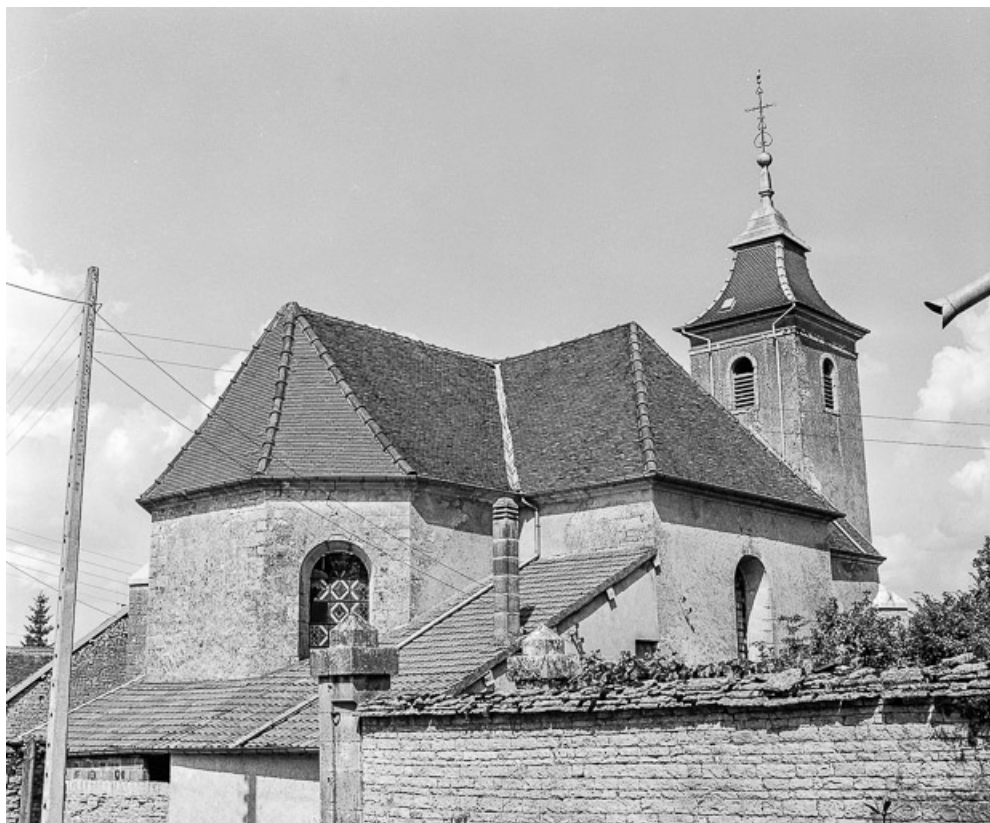
Choeur, bras du transept gauche et toit de la sacristie. 70, Hugier