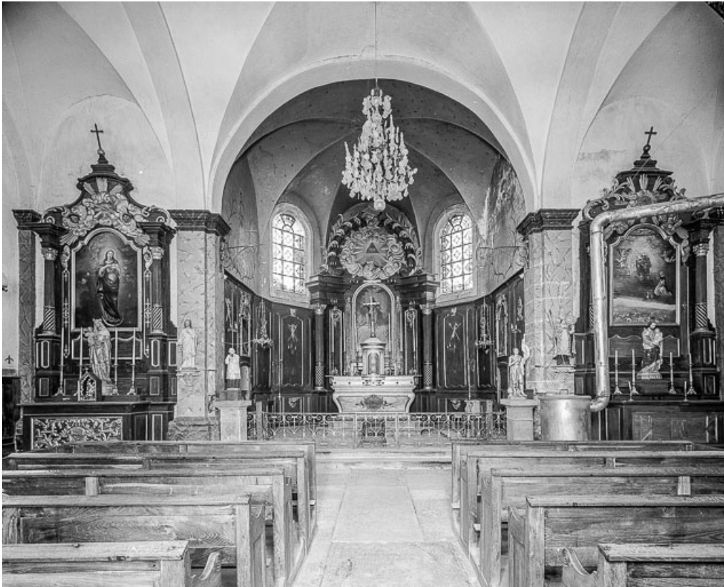
Choeur et transept.