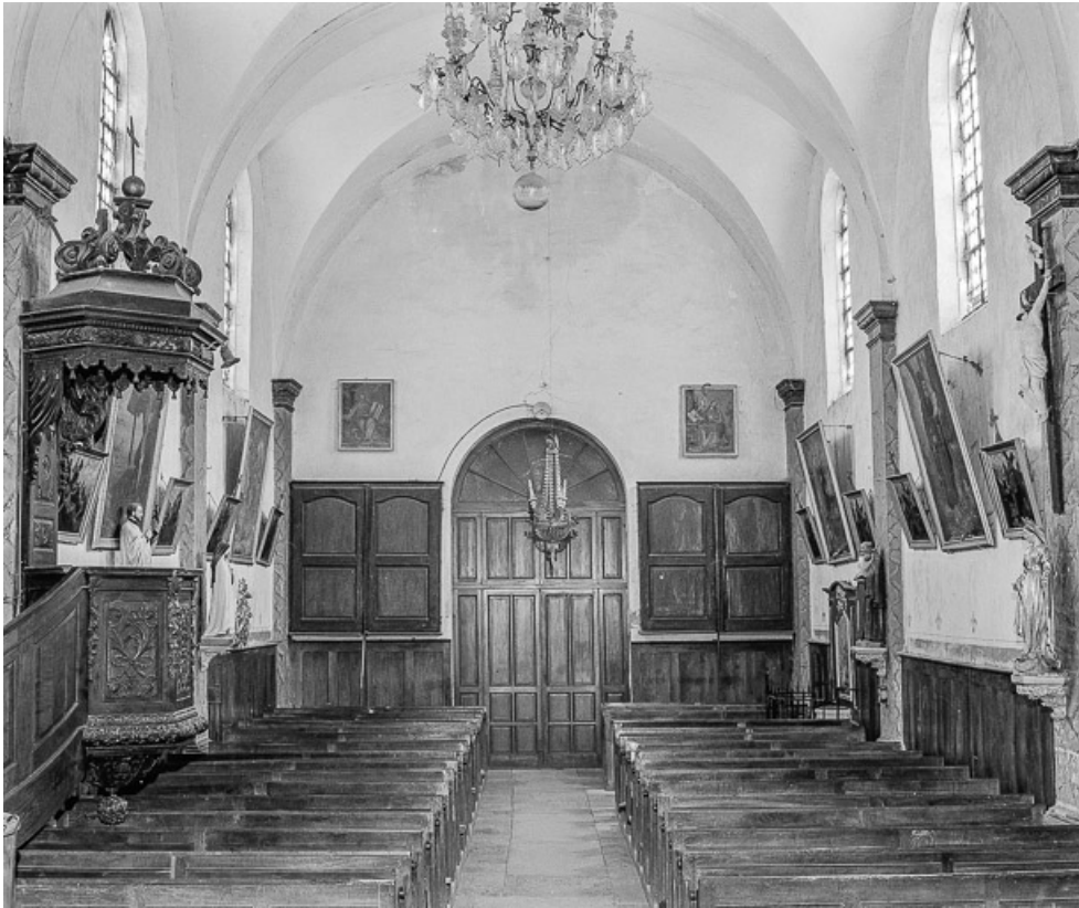
Vue de la nef.