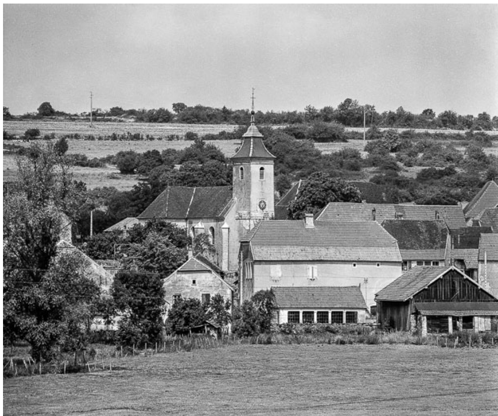
Faces postérieure et latérale gauche.