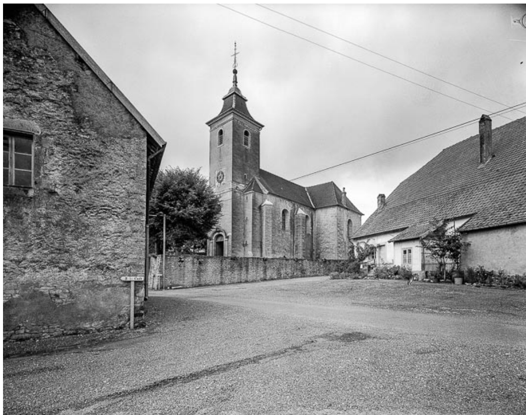
Faces postérieure et latérale droite.