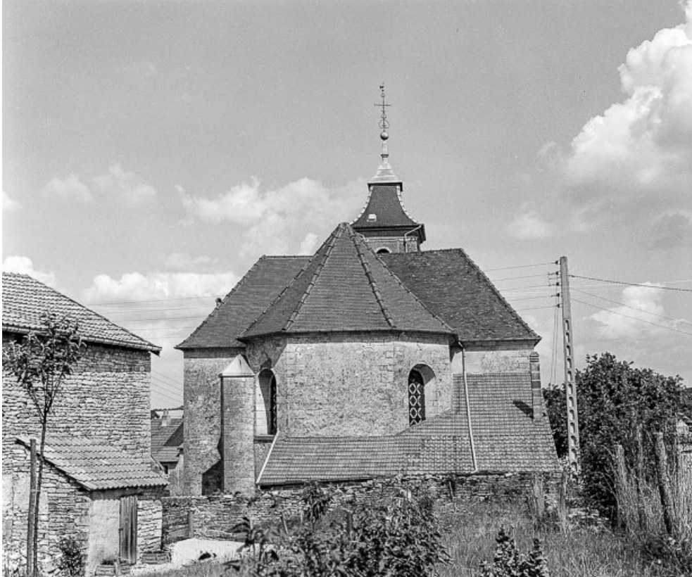
Choeur et toit de la sacristie.