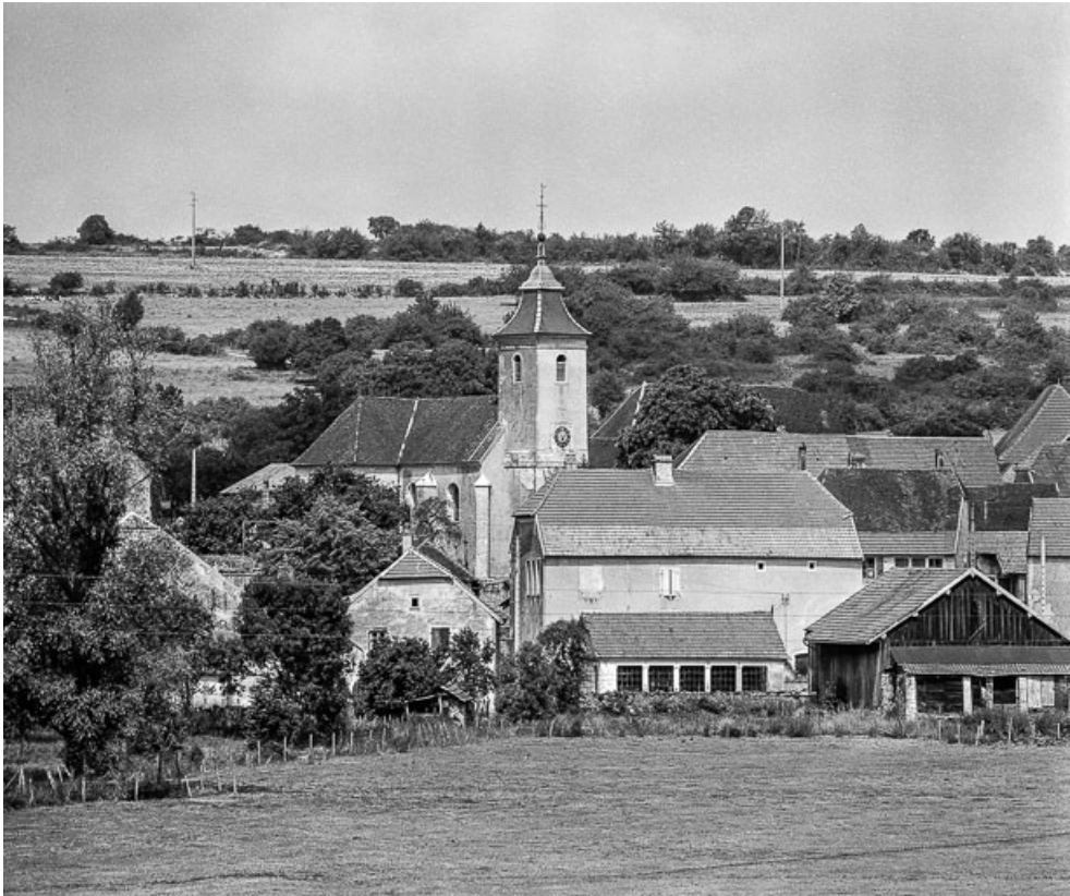
Faces postérieure et latérale gauche.