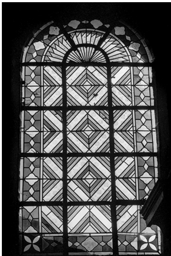
Baie 1. 70, Hugier