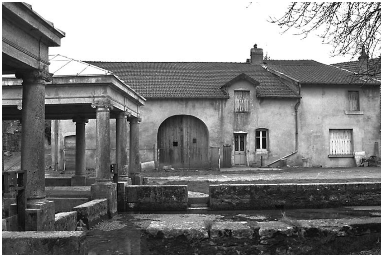
Vue d'ensemble. 70, Étuz