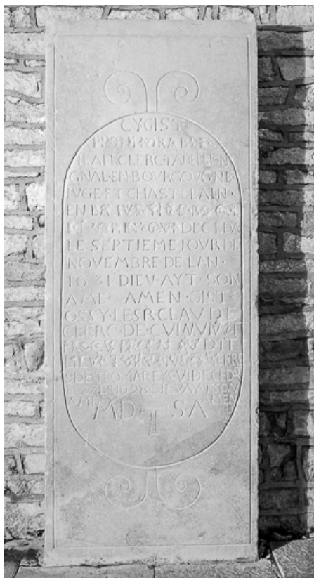
Intérieur : pierre tombale sous le porche. 70, Cult route de Besançon