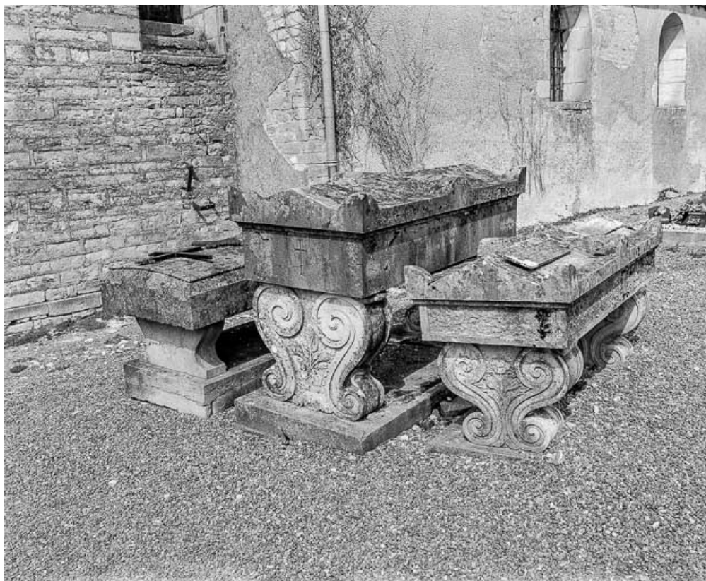
3 monuments funéraires (19e siècle) du cimetière autour de l'église.