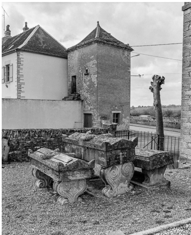
3 monuments funéraires (19e siècle) du cimetière autour de l'église. 70, Cult route de Besançon