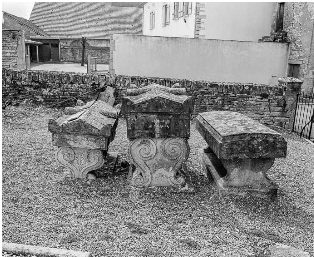
3 monuments funéraires (19e siècle) du cimetière autour de l'église. 70, Cult route de Besançon