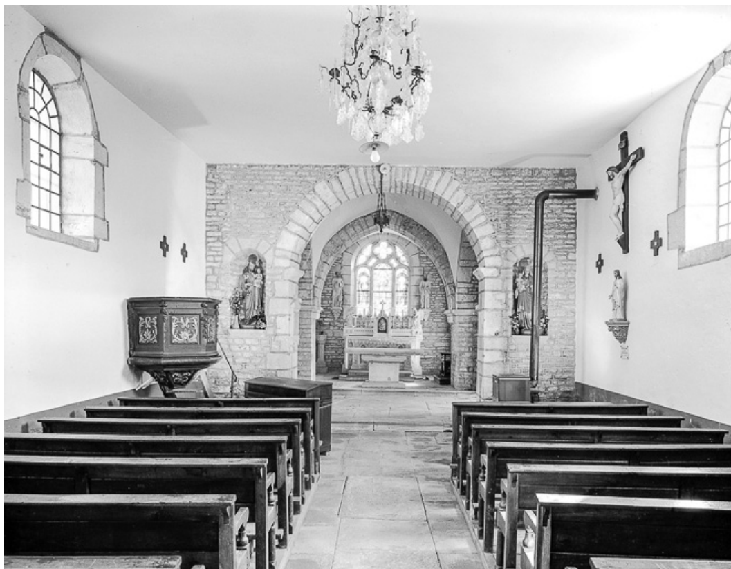
Intérieur : nef et choeur.