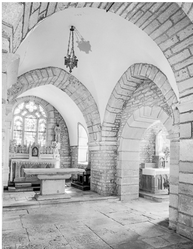
Intérieur : chœur, croisée du transept, bras du transept droit. 70, Cult route de Besançon