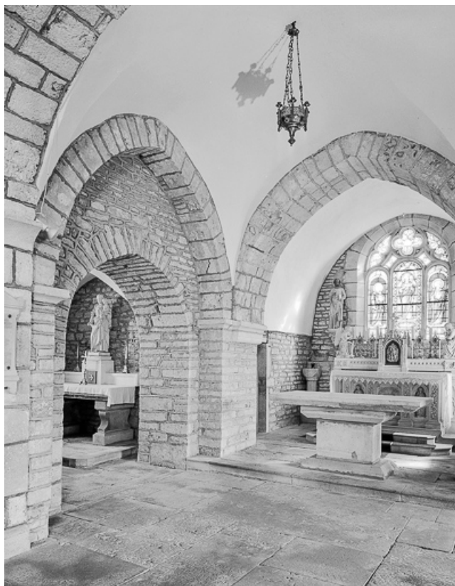
Intérieur : chœur, croisée du transept et bras du transept gauche. 70, Cult route de Besançon