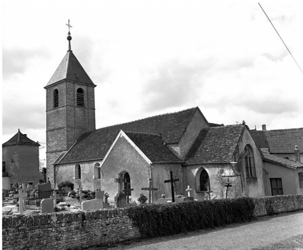
Façade latérale sud.