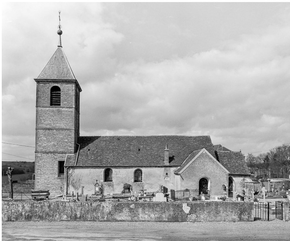
Extérieur : façade latérale droite.