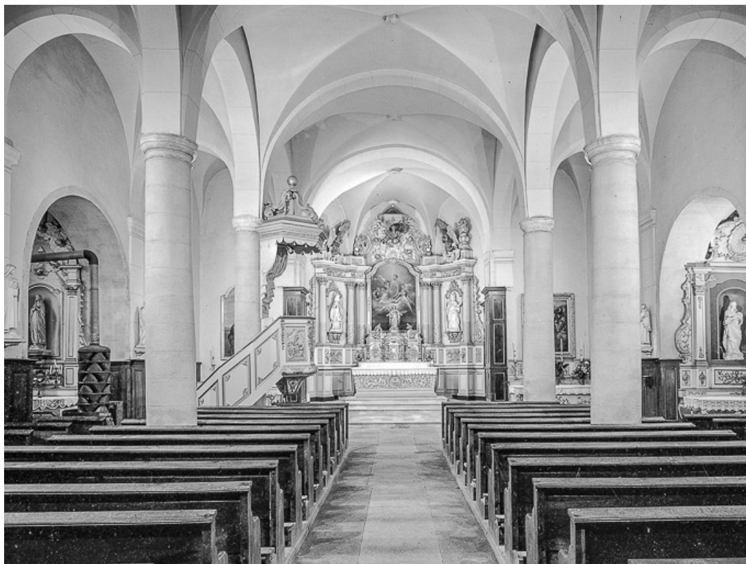
Vue de la nef et du chœur.