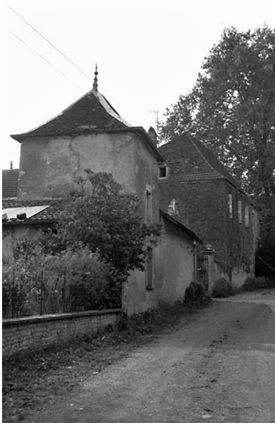
Façades sur rue.