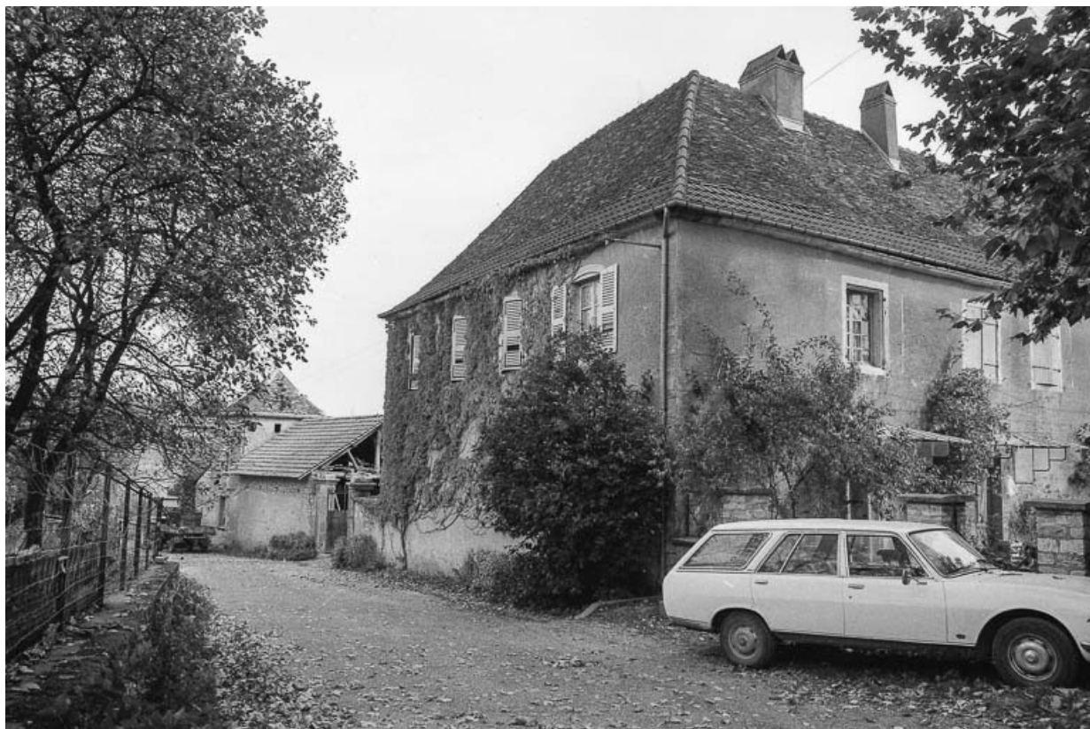
Façades latérale droite et postérieure.