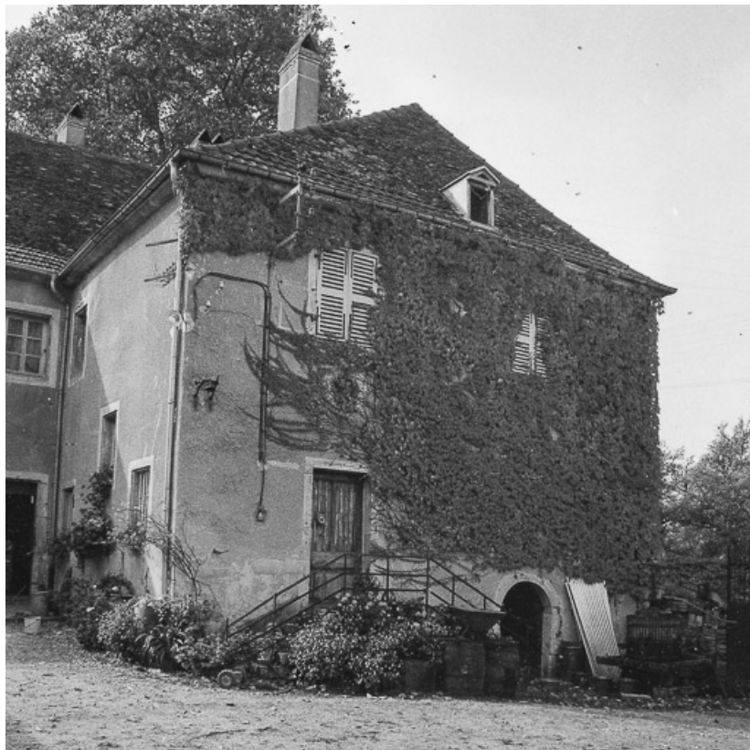
Habitation vue depuis la cour.