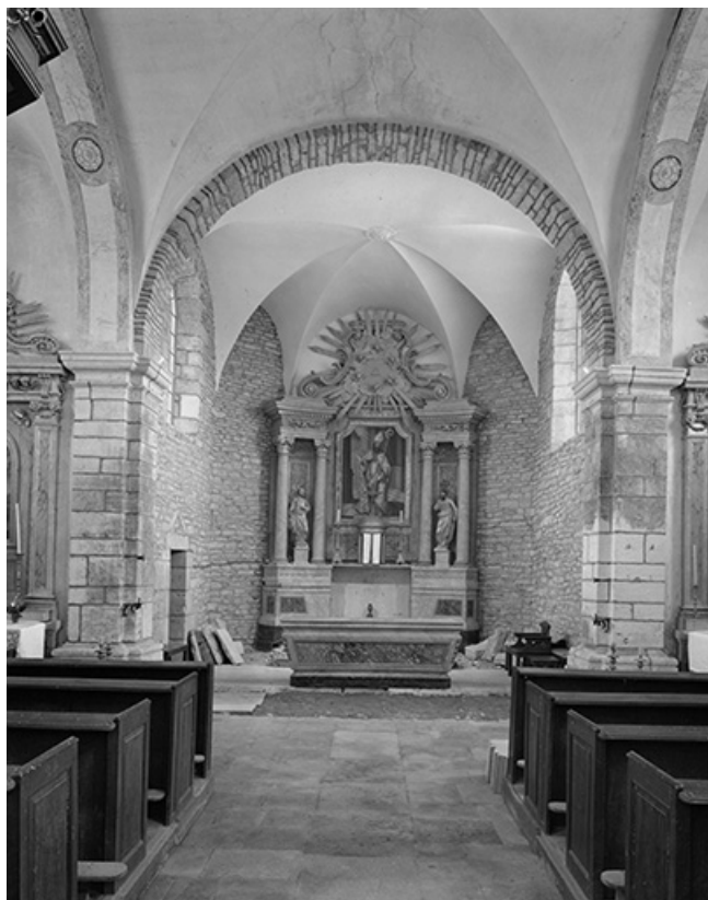
Vue du chœur.