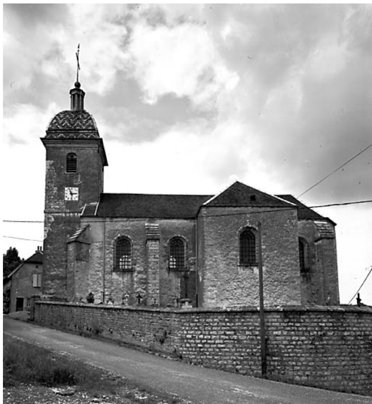
Façade latérale sud.