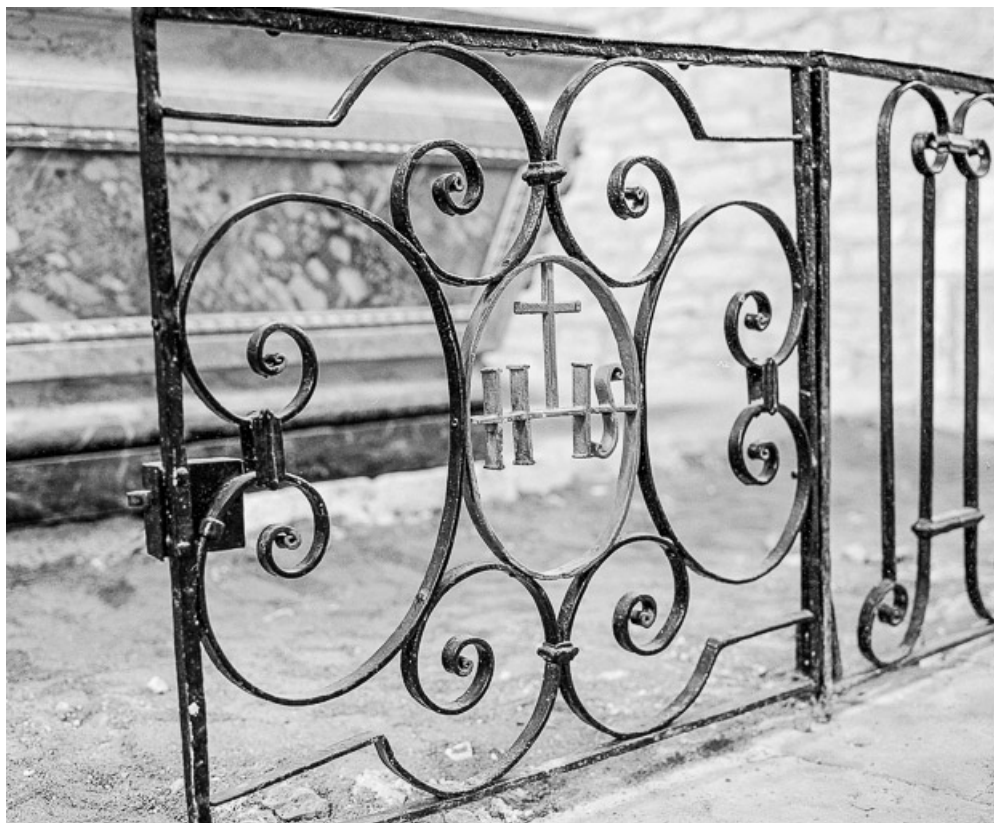
Détail : clôture du chœur. 70, Courcuire Grande Rue