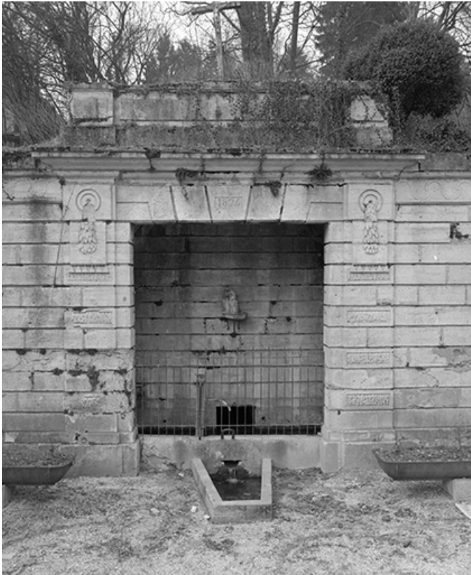
Vue de la partie centrale.