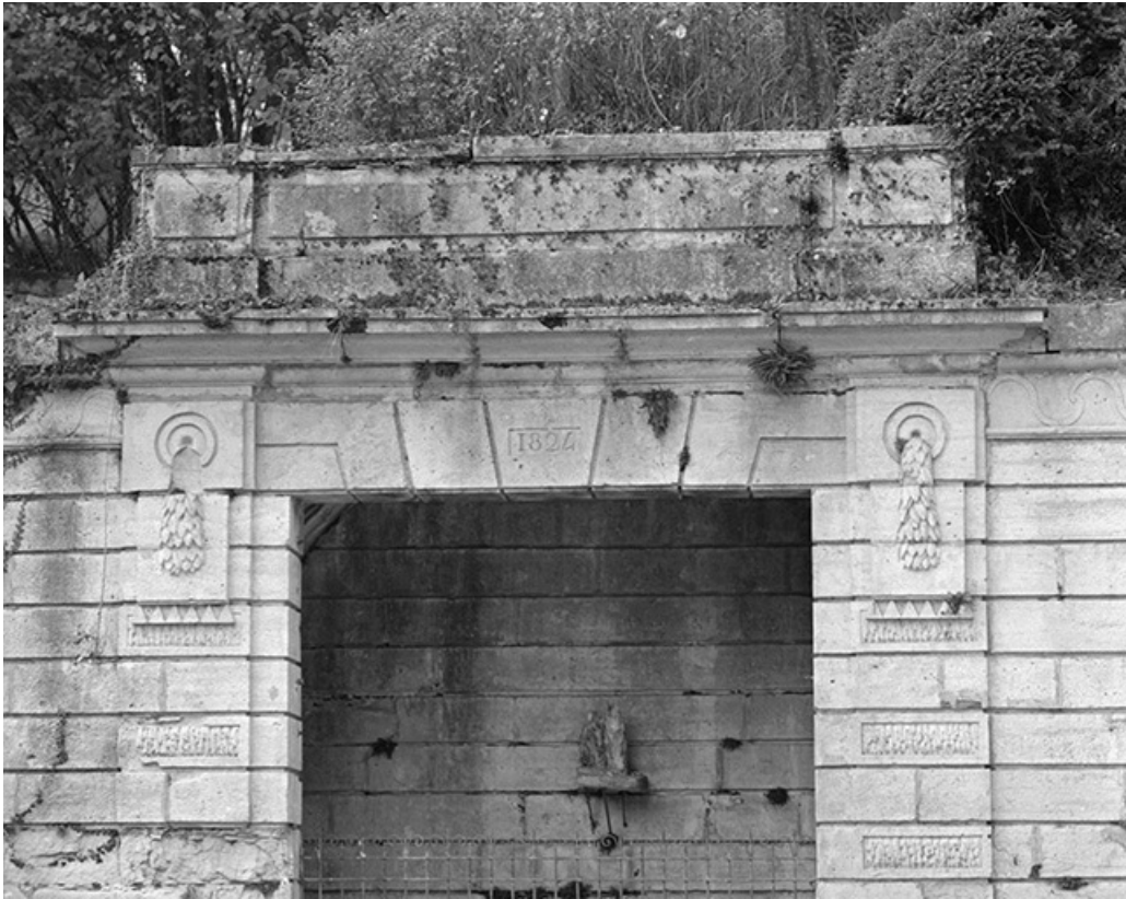
Partie supérieure du buffet d'eau.