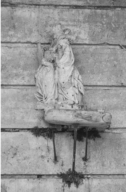
Groupe sculpté en bois : Education de la Vierge. 70, Courcuire Grande Rue