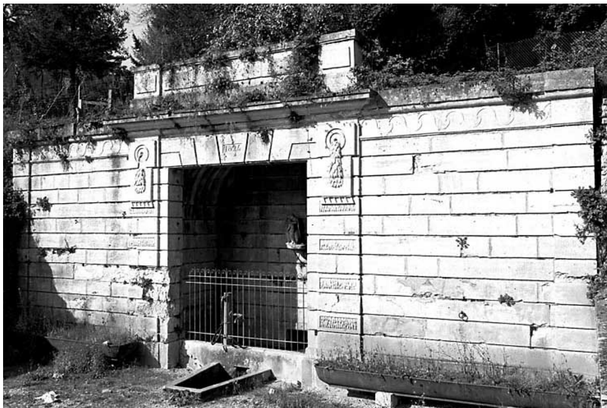
Vue de trois quarts droit. 70, Courcuire Grande Rue