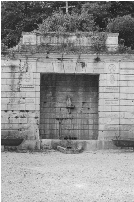
Vue de la partie centrale.