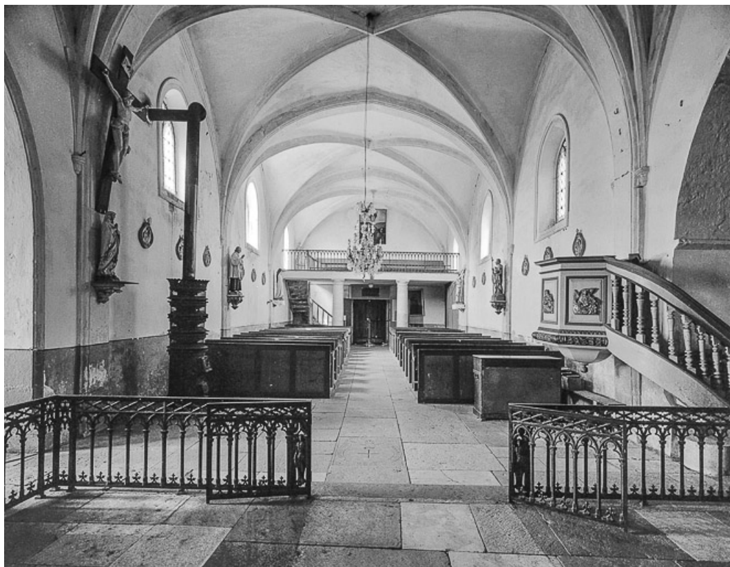
Vue de la nef depuis le chœur.

70, Chenevrey-et-Morogne route de Pesmes, lieudit : Chenevrey