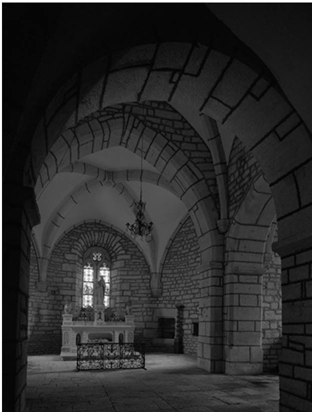
Intérieur : vue du choeur.