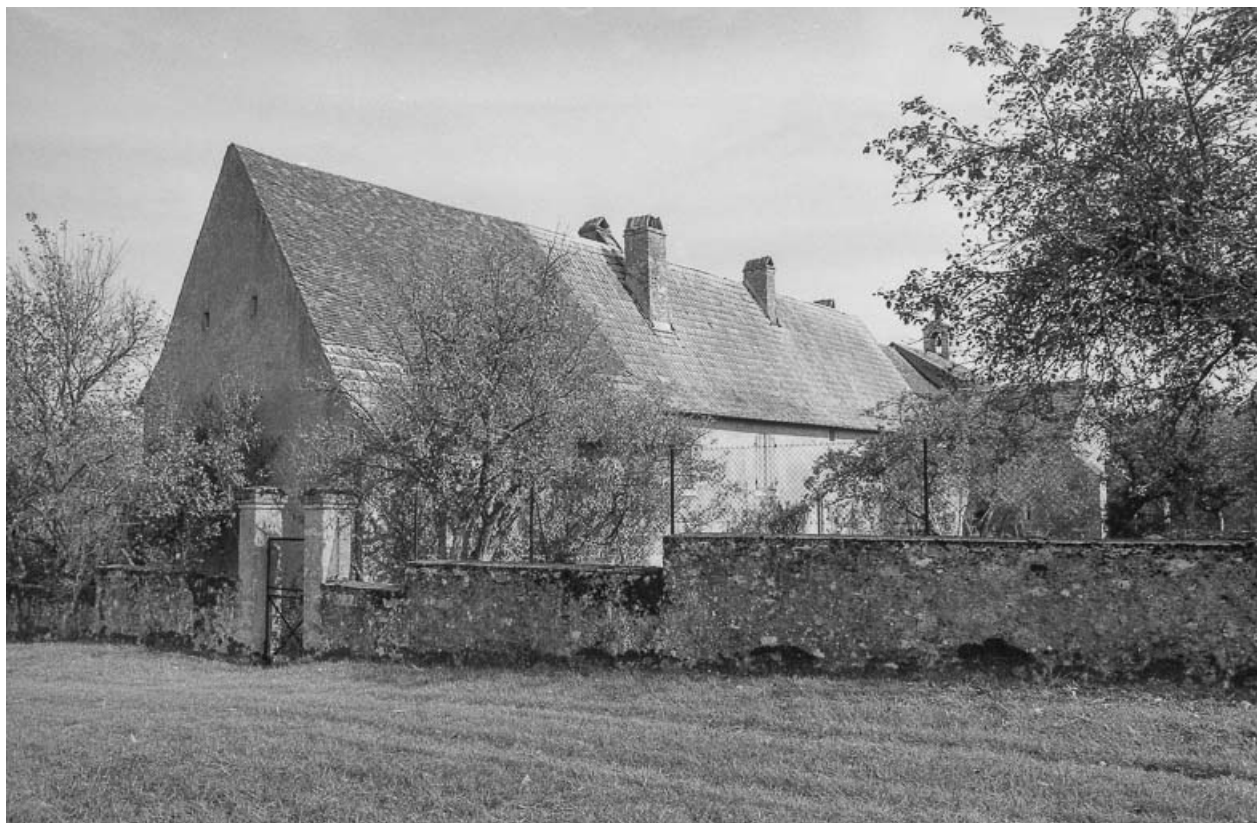
Bâtiment annexe, façade postérieure sur jardin.