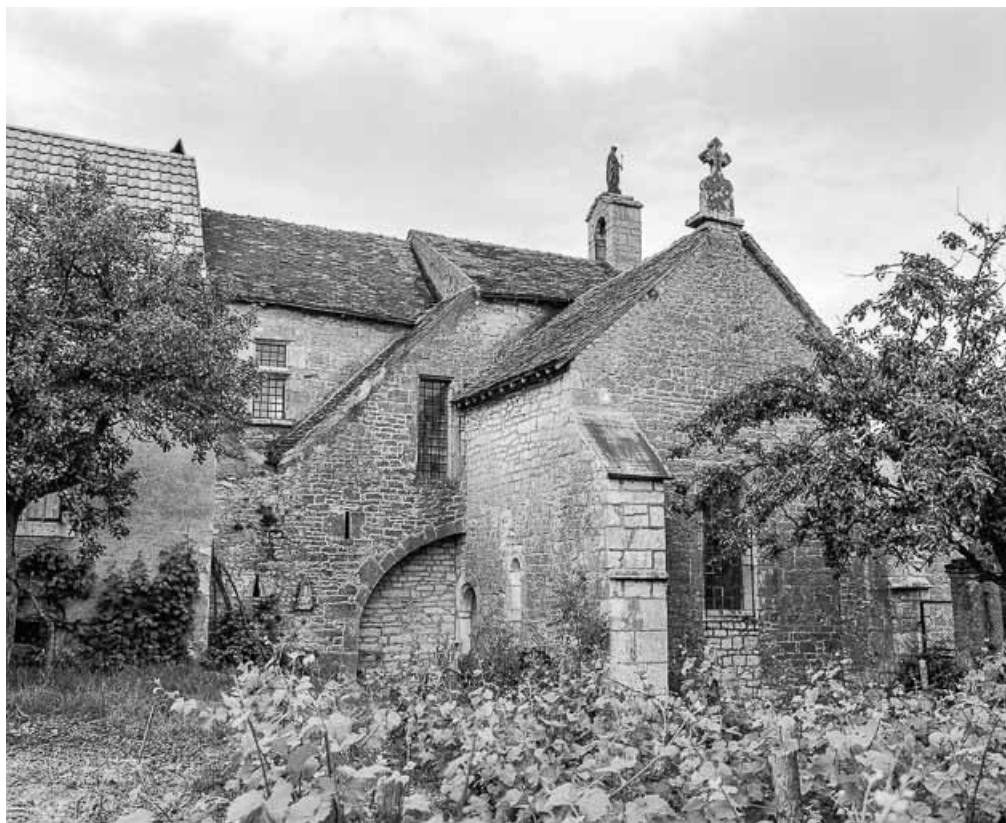
Extérieur : façade latérale droite.