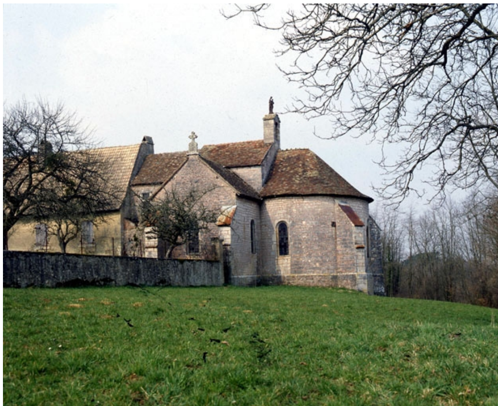
Façade latérale gauche et abside.