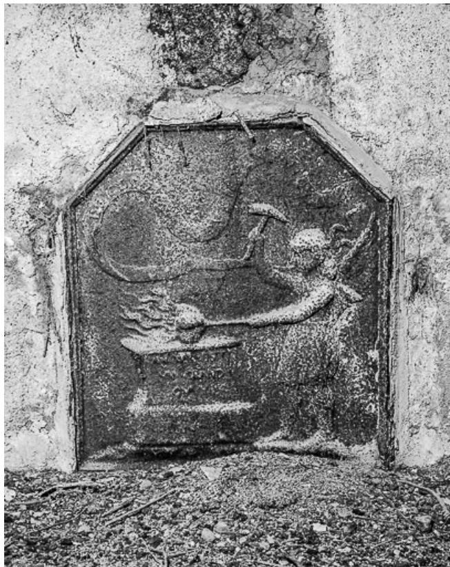
Bâtiment annexe : plaque de cheminée représentant un forgeron.