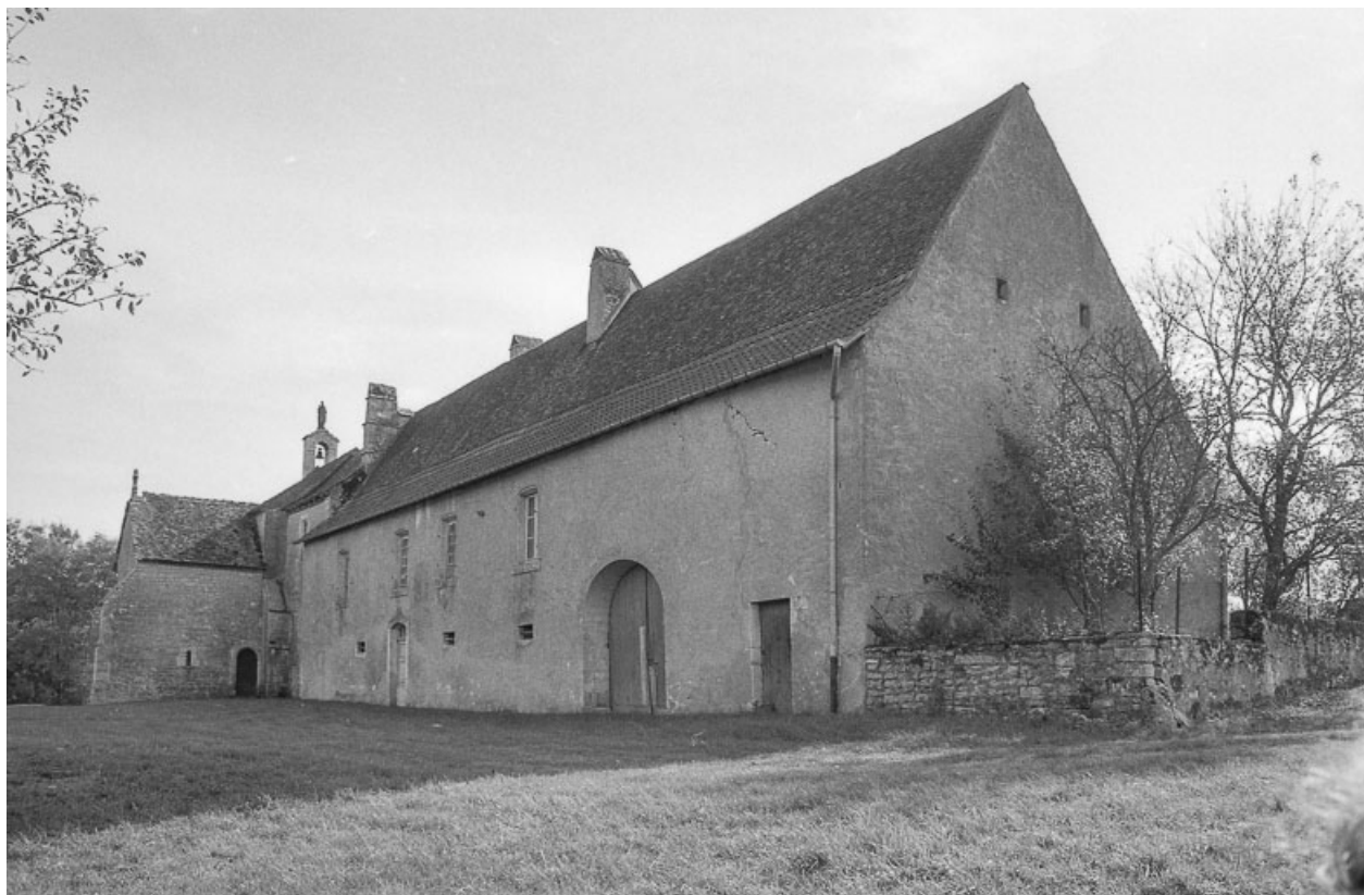
Bâtiment annexe, façade antérieure.