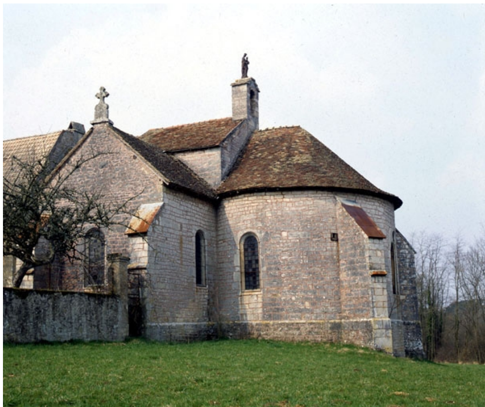
Façade latérale gauche et abside.