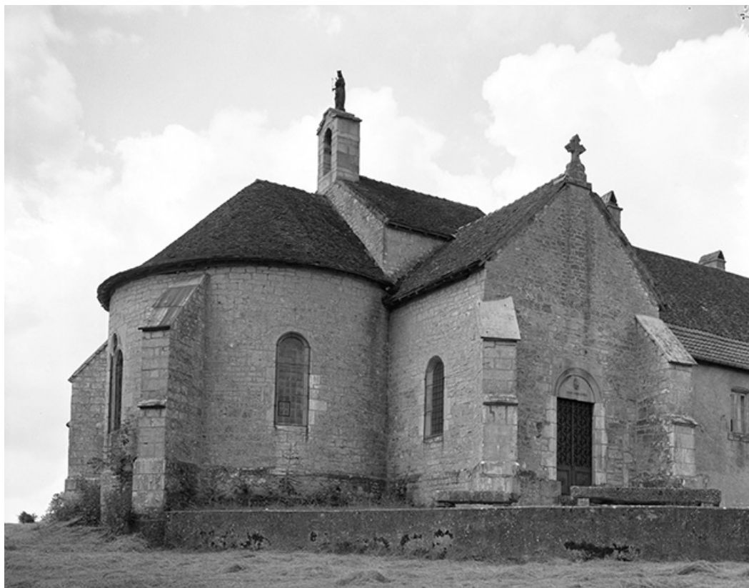
Extérieur : chœur et façade latérale gauche.