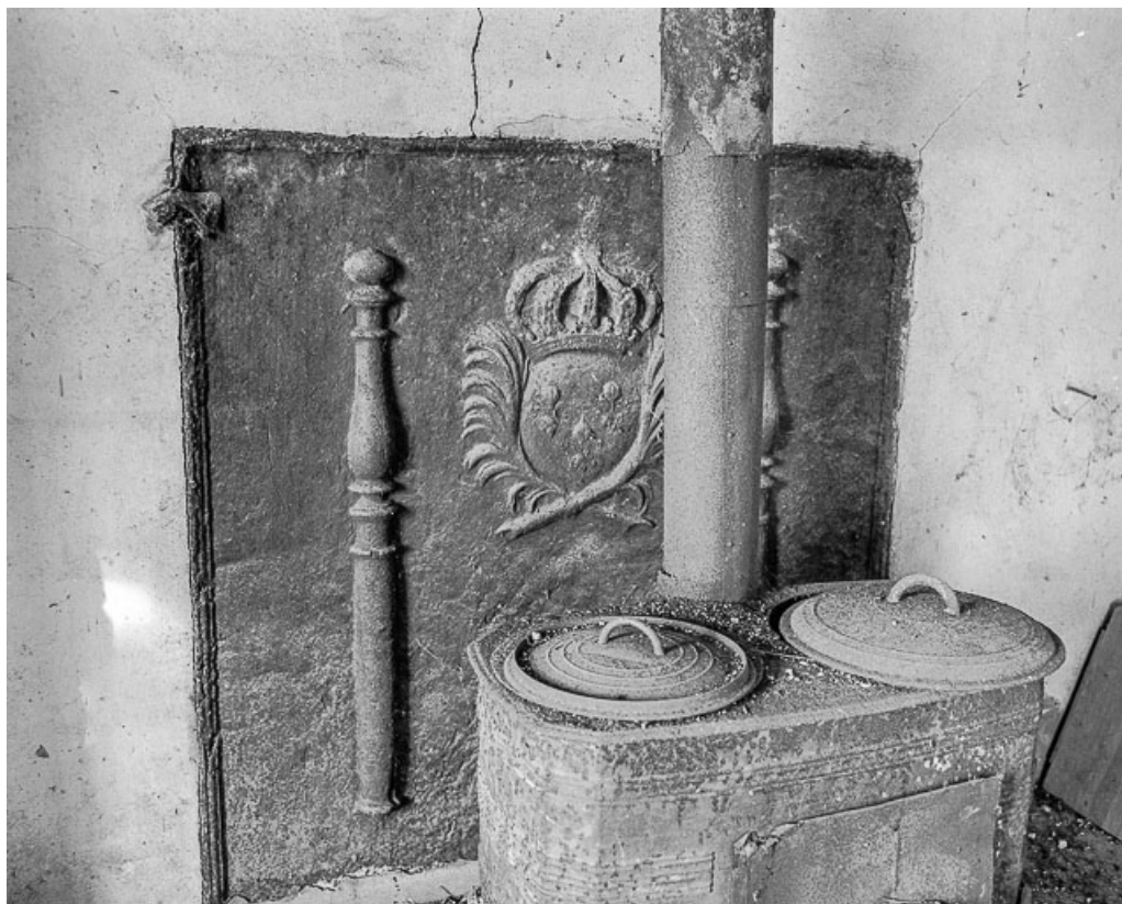
Bâtiment annexe : plaque de cheminée (écu encadré de deux palmes surmonté d'une couronne). 70, Charcenne, lieudit : Leffond