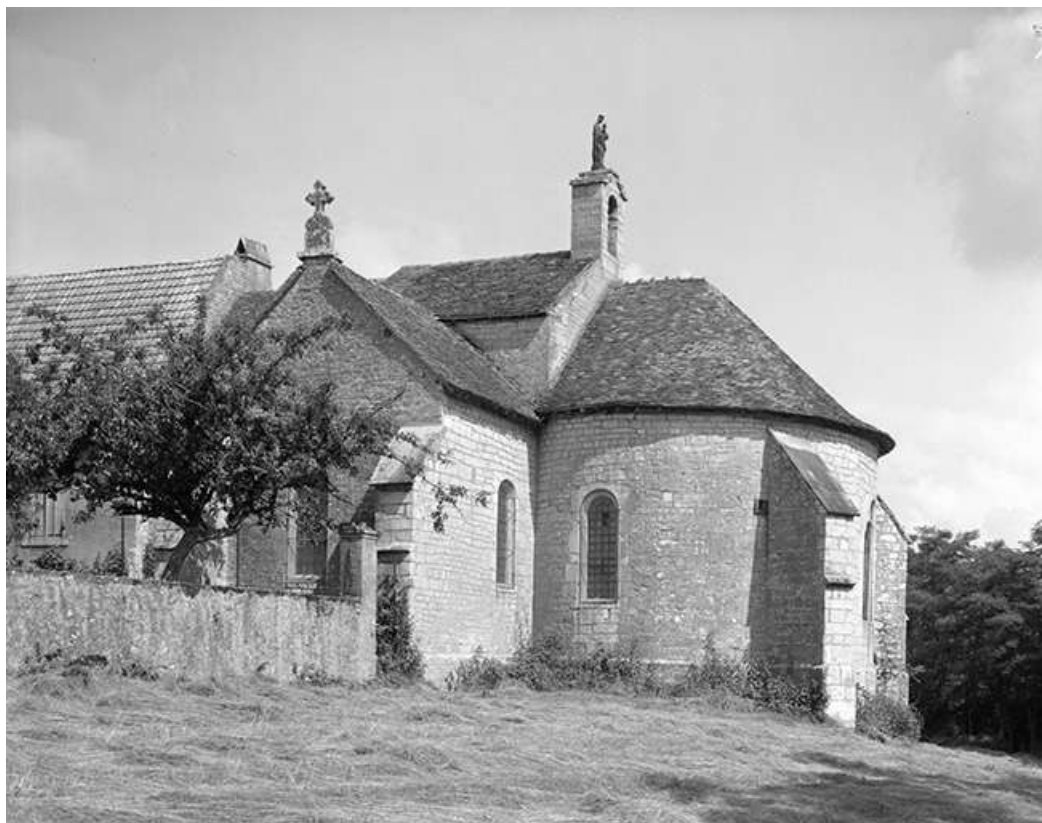
Extérieur : chœur et façade latérale droite.