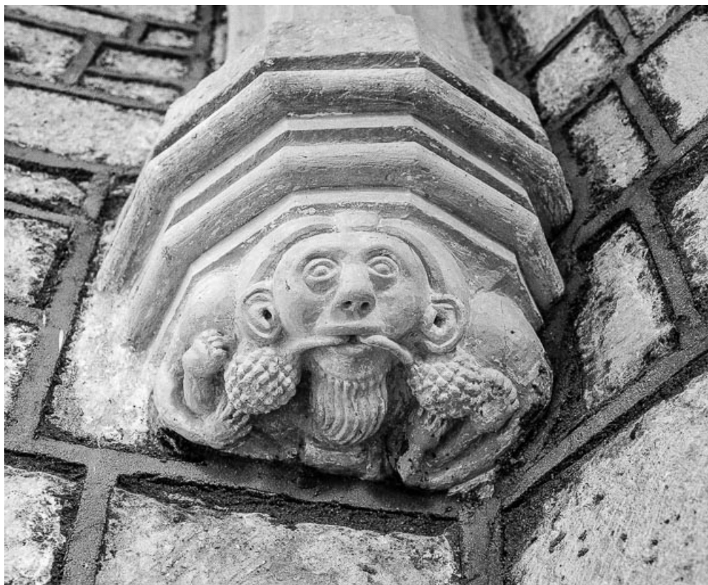
Intérieur : détail culot, mur ouest du choeur, à gauche.