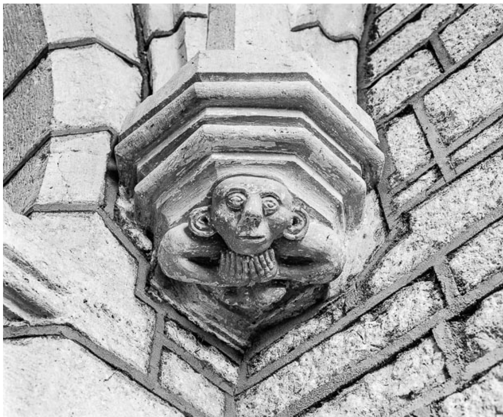
Intérieur : détail culot, mur ouest du choeur, à droite.