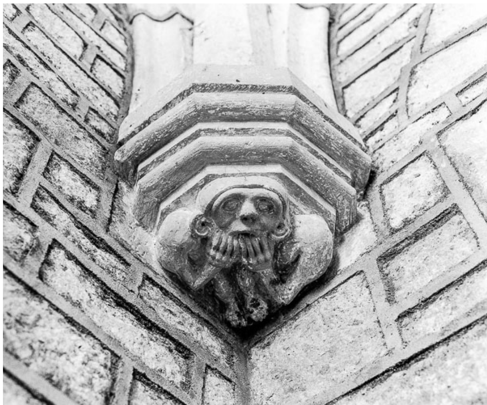
Intérieur : détail culot.