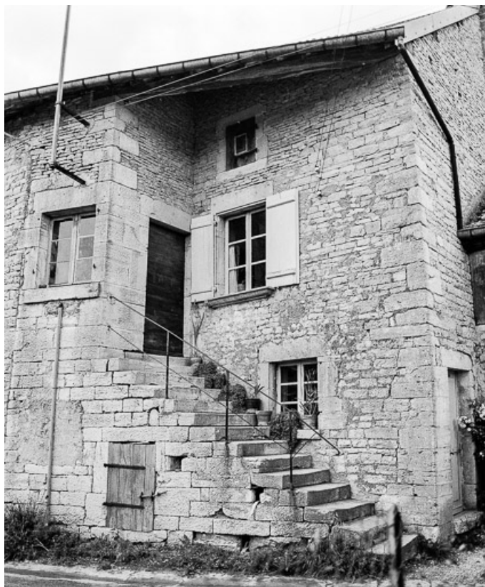
Escalier sur la façade antérieure vu de face.