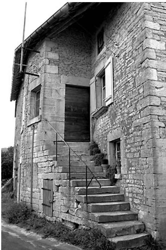
Escalier sur la façade antérieure vu de trois quarts droit.