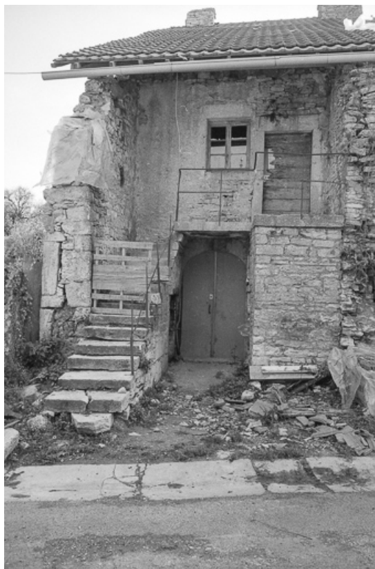
Façade antérieure, partie gauche.