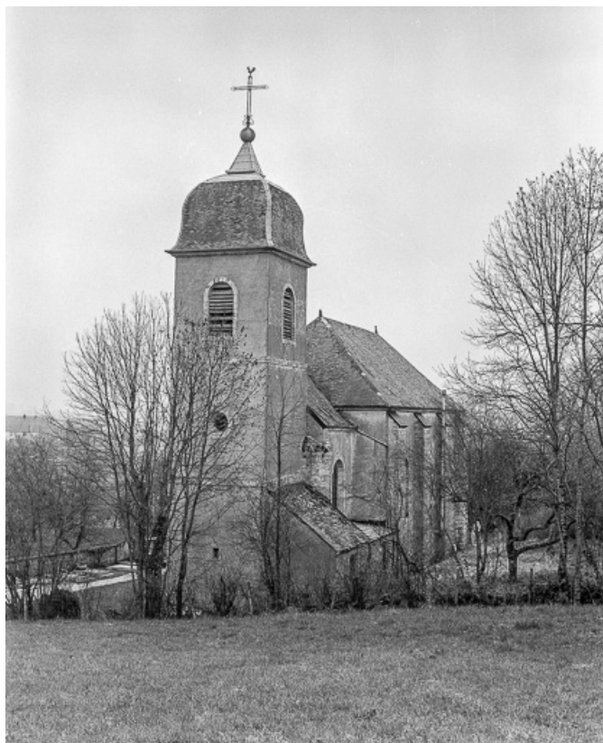
Extérieur : façades postérieure et latérale gauche.