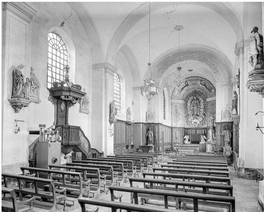
Intérieur : nef et choeur.