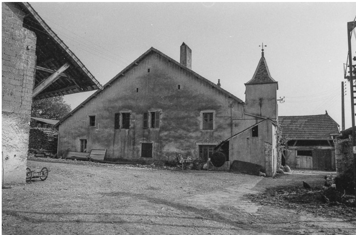
Habitation : façade latérale gauche.