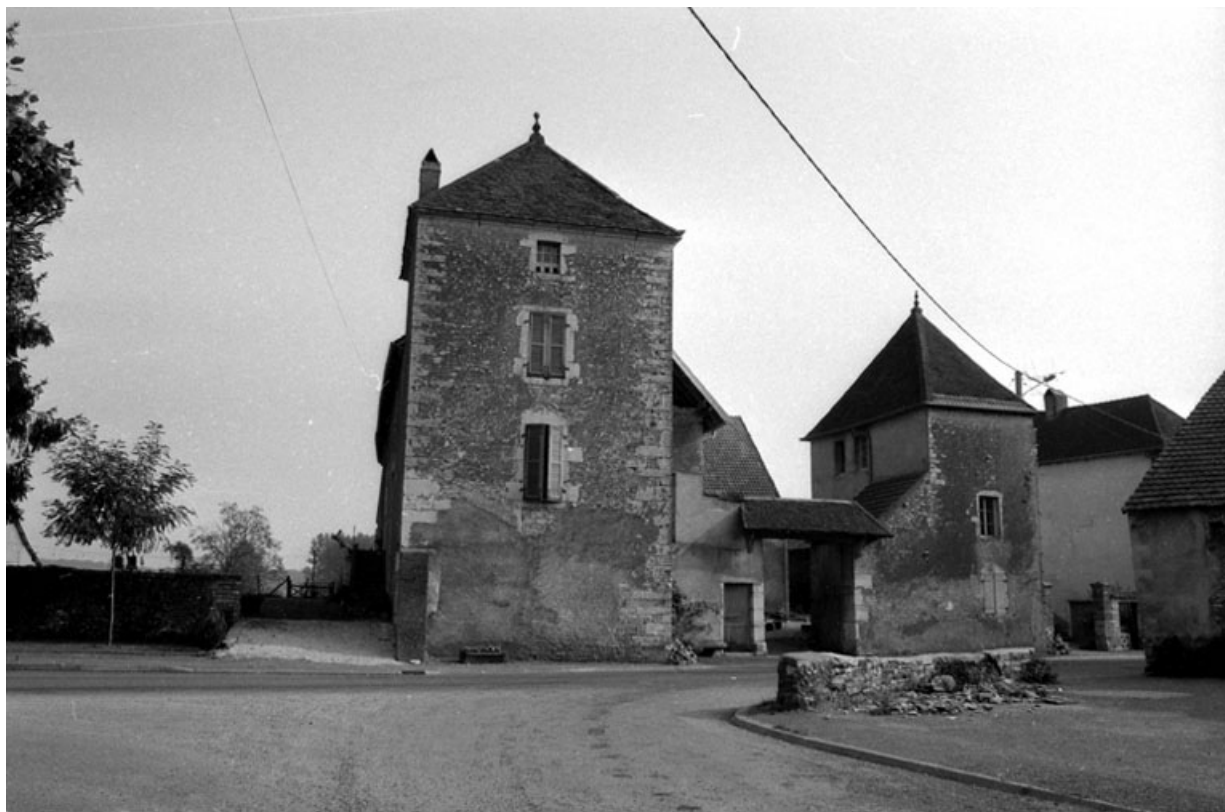
Vue d'ensemble depuis la rue d'Avrigney.