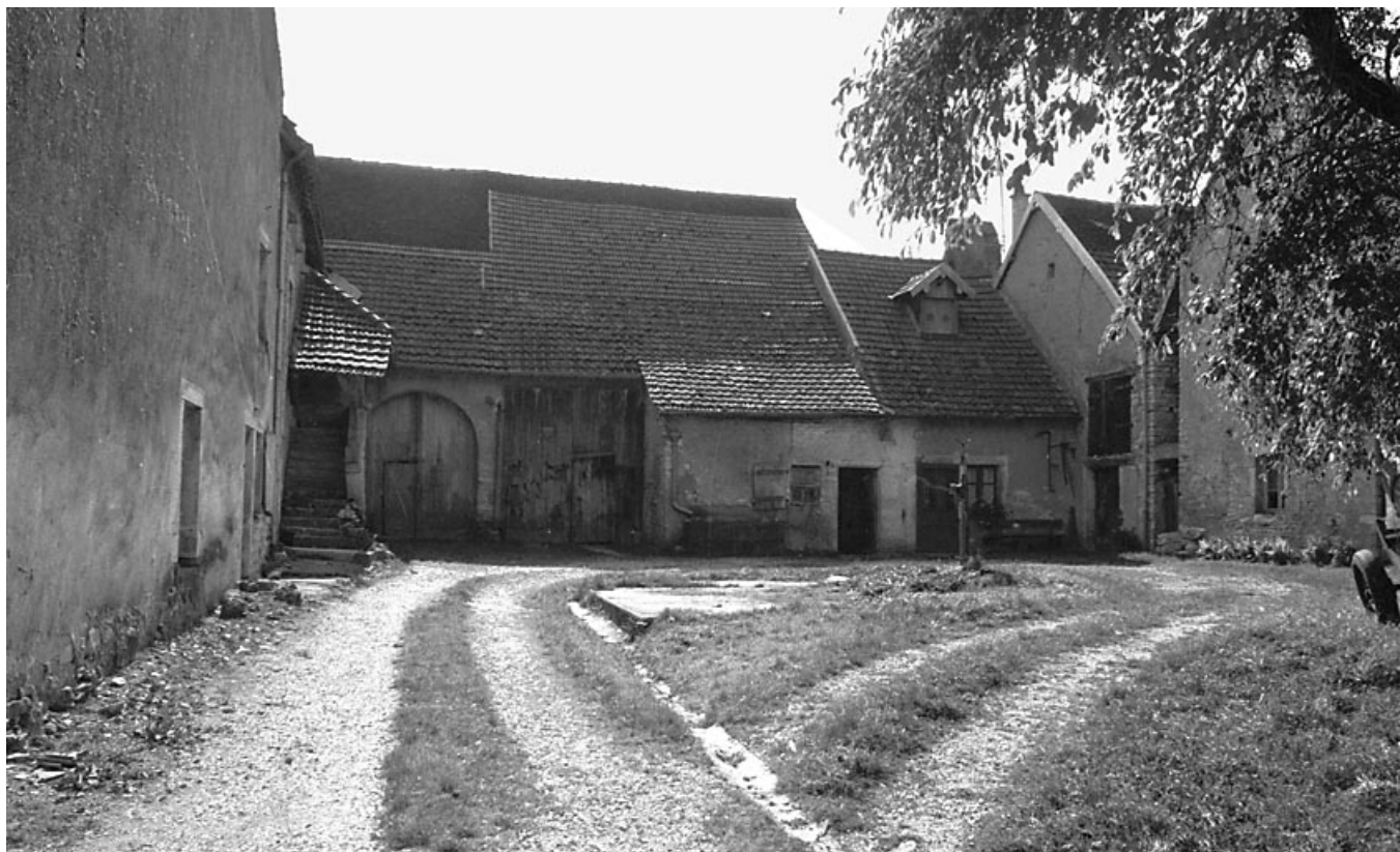
Vue d'ensemble de la partie gauche.