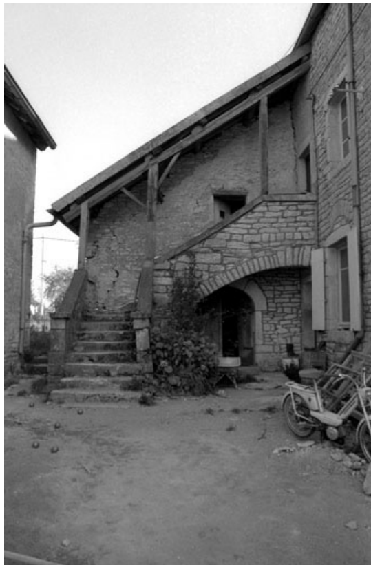
Maison cadastrée 1976 A4 366, située impasse du Clos : détail de l'escalier extérieur. 70, Brussey