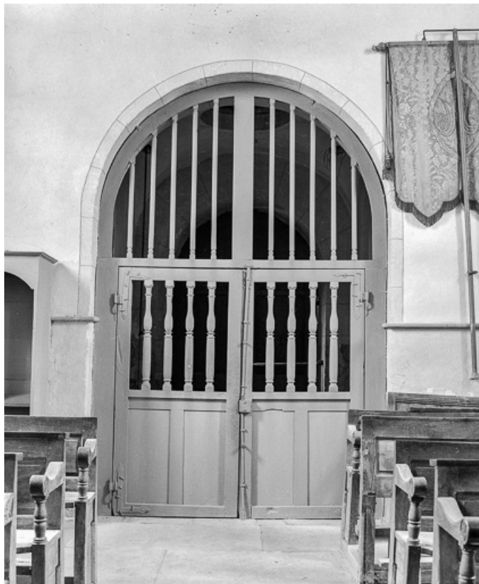
Intérieur : détail, porte d'entrée de la nef. 70, Bonboillon rue de l' Eglise