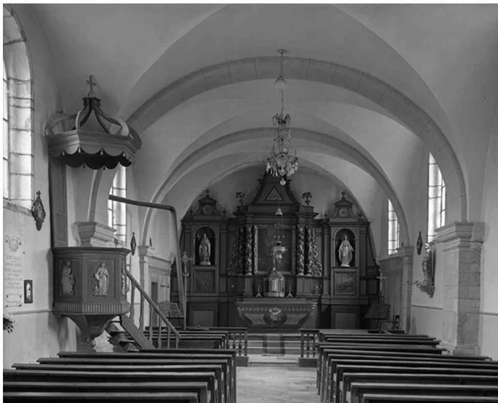
Intérieur : nef et chœur.