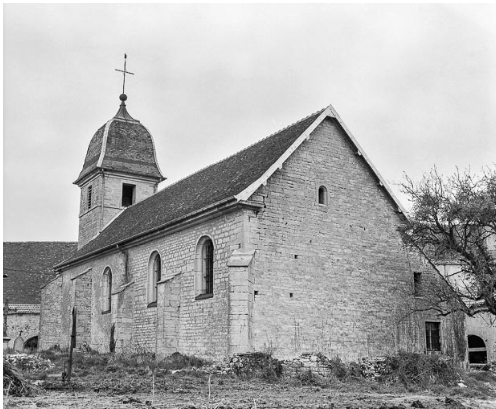
Façades postérieure et latérale droite.