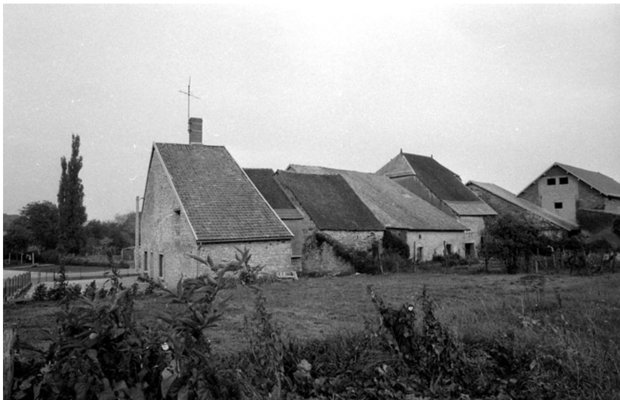
Façades postérieures de fermes depuis l'impasse des Champs du Four. 70, Bonboillon