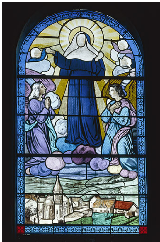
Baie 10 : sainte Thérèse de Lisieux.