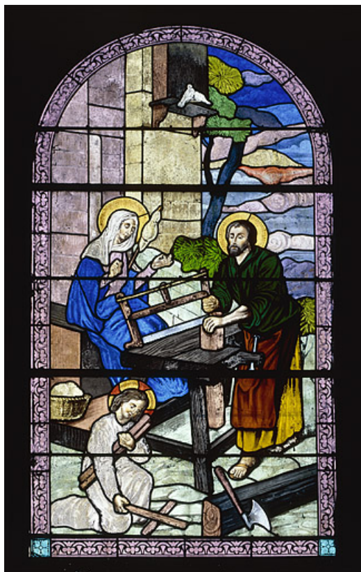
Baie 5 : Sainte Famille.