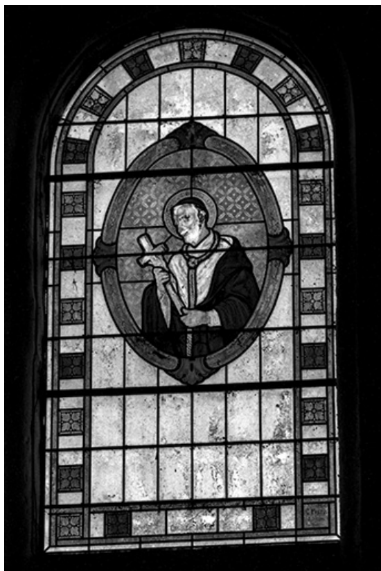
Baie 3 : saint Charles Borromée.