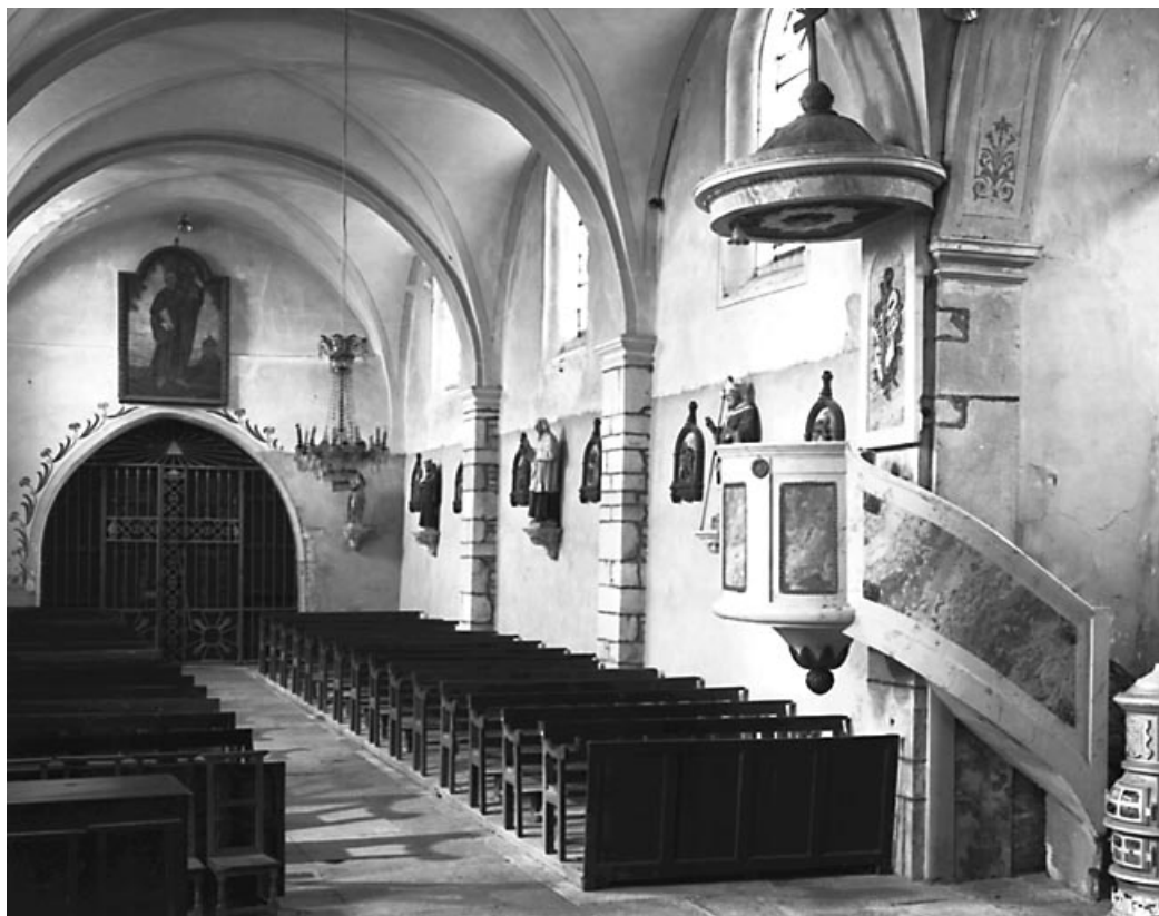
Intérieur : nef vue du chœur.