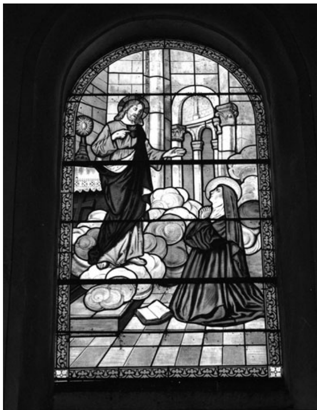
Baie 7 : apparition du Sacré-Coeur à Marguerite Marie. 70, Beaumotte-lès-Pin