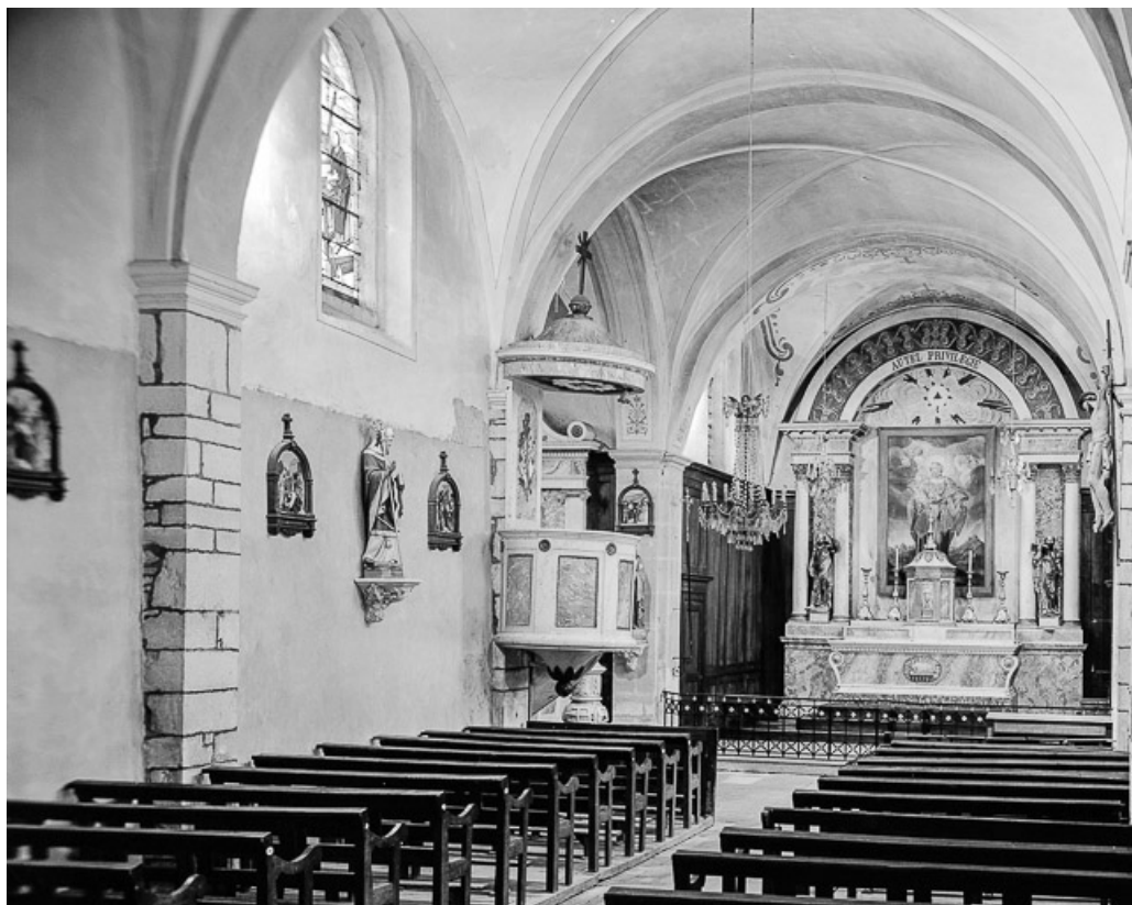
Intérieur : nef et chœur.