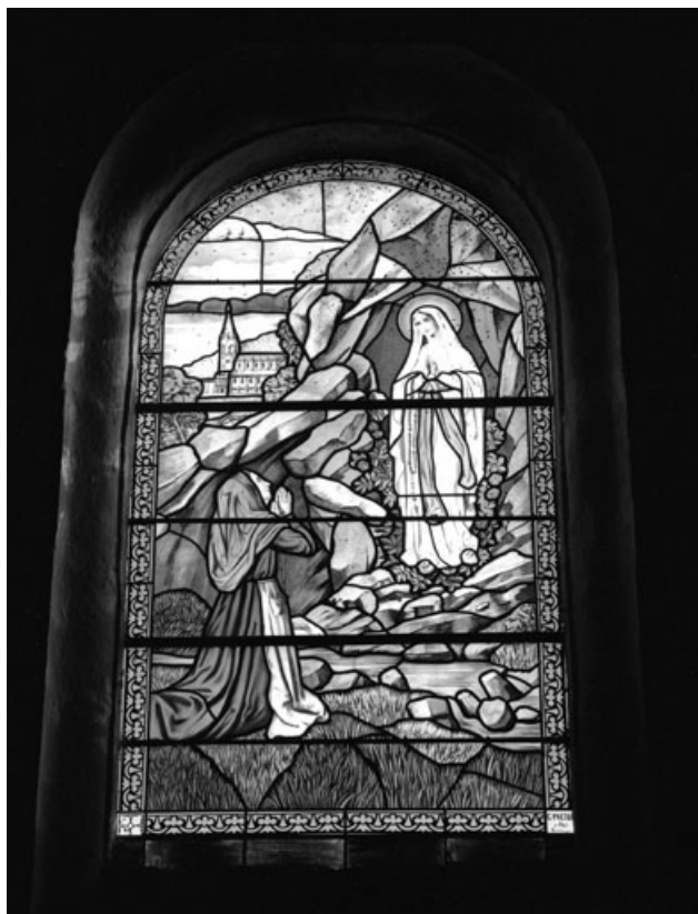
Baie 8 : apparition de la Vierge à sainte Bernadette à Lourdes.