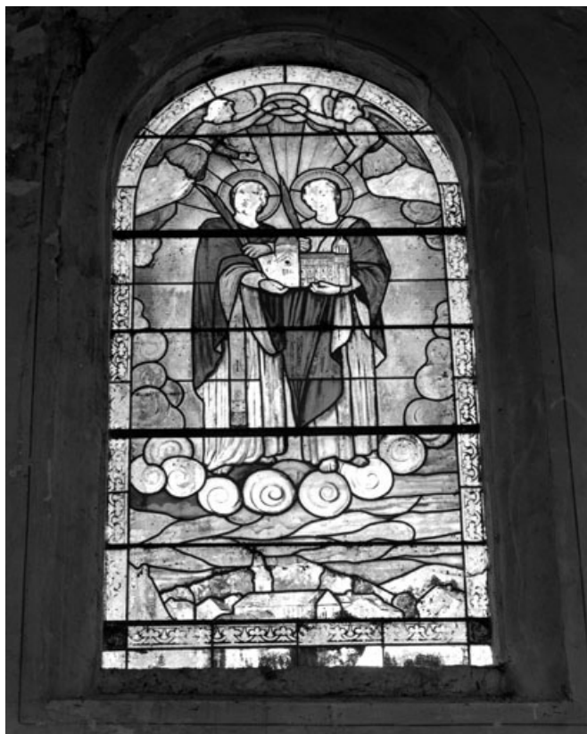
Baie 9 : saint Ferréol et saint Ferjeux.