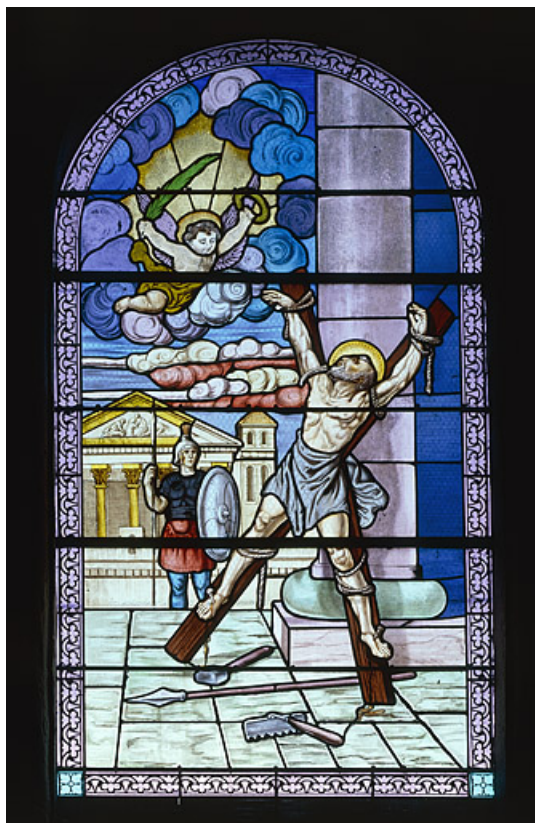
Baie 6 : martyr de saint André.