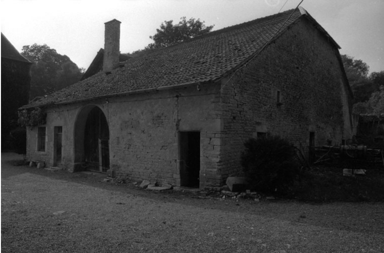
Partie agricole : vue d'ensemble.