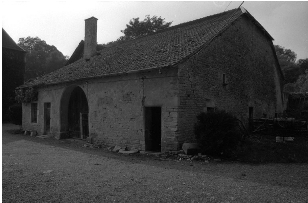
Partie agricole : vue d'ensemble.