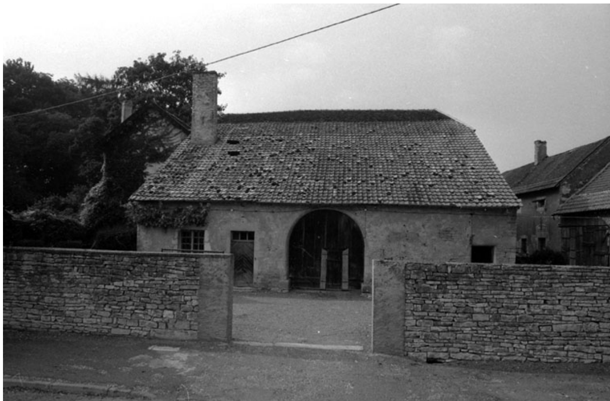
Partie agricole : façade antérieure.