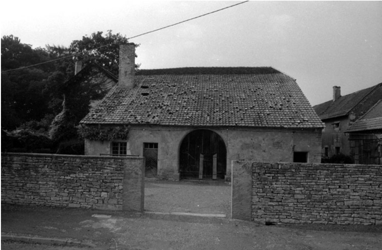
Partie agricole : façade antérieure.