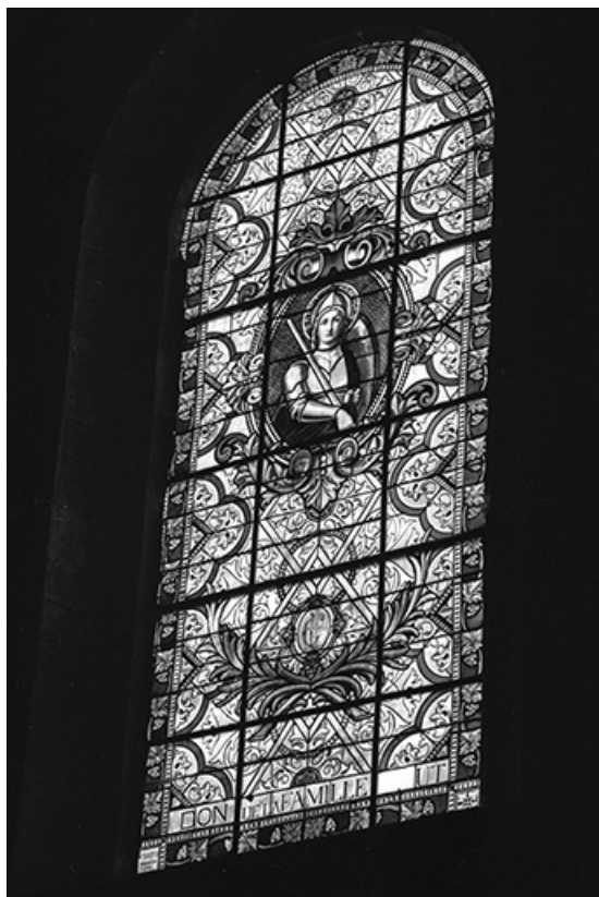
Baie 2 : saint Georges.