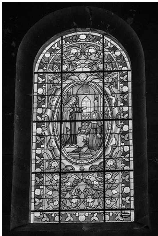
Baie 4 : apparition du Sacré-Coeur à Marguerite Marie.