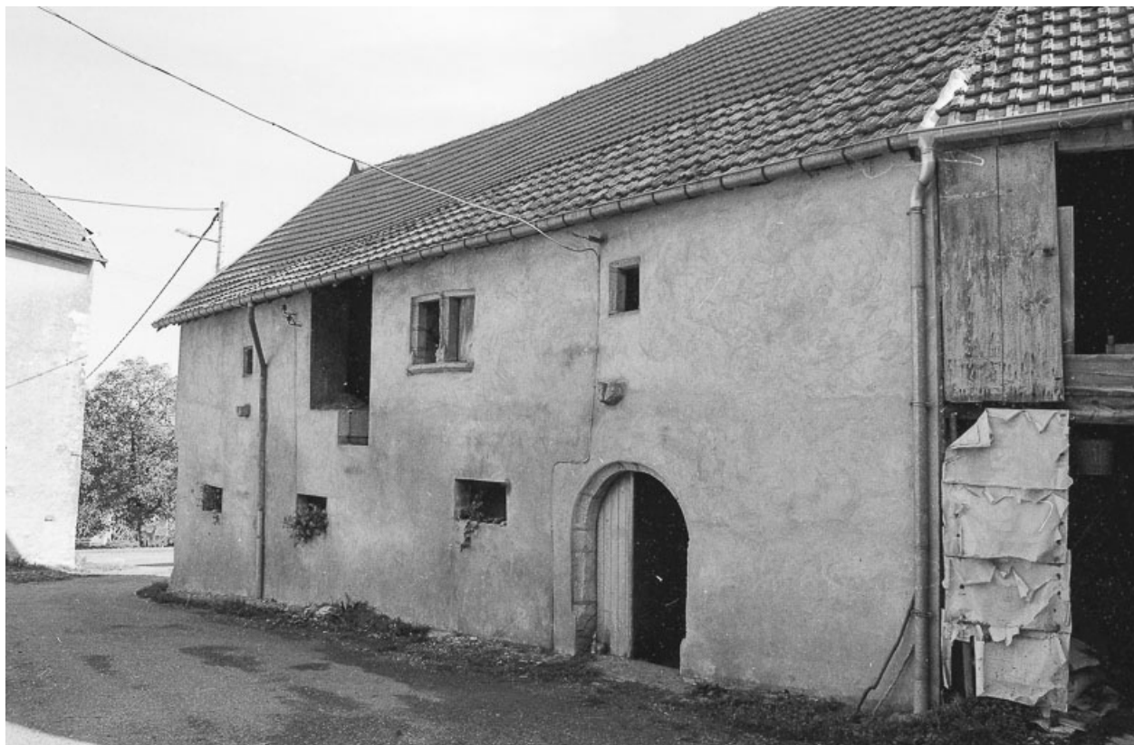
Ferme cadastrée 1960 A2 306, située rue de l'Impasse : façade antérieure. 70, Avrigney-Virey