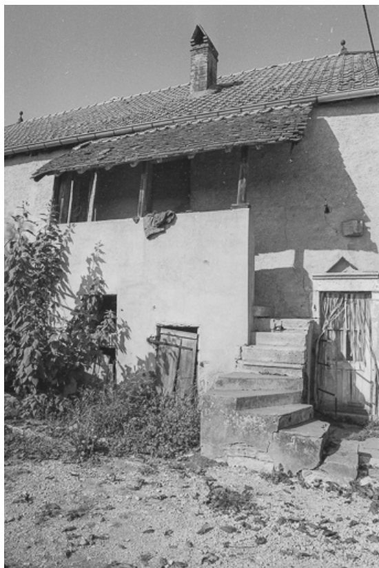
Ferme cadastrée 1960 A2 246, située rue de l'Eglise : escalier extérieur de la façade antérieure. 70, Avrigney-Virey