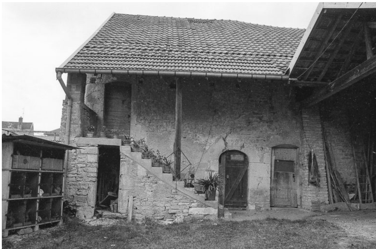
Ferme cadastrée B 1 211, située rue de la Planchotte : détail de l'escalier extérieur. 70, Avrigney-Virey