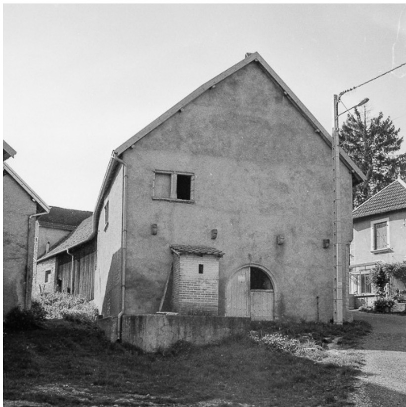
Ferme cadastrée 1960 A2 306, située rue de l'Impasse : façade latérale gauche. 70, Avrigney-Virey