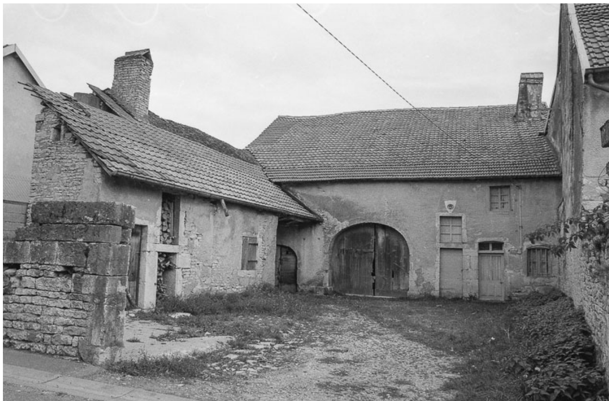
Ferme cadastrée 1977 B1 312, située rue de la Planchotte : vue d'ensemble. 70, Avrigney-Virey