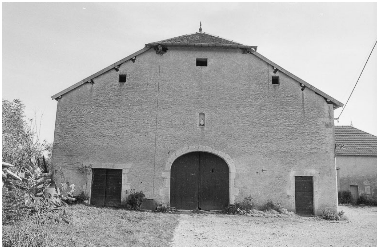
Ferme cadastrée 1960 A2 238, située rue des Prés : façade sur pignon de la partie agricole. 70, Avrigney-Virey