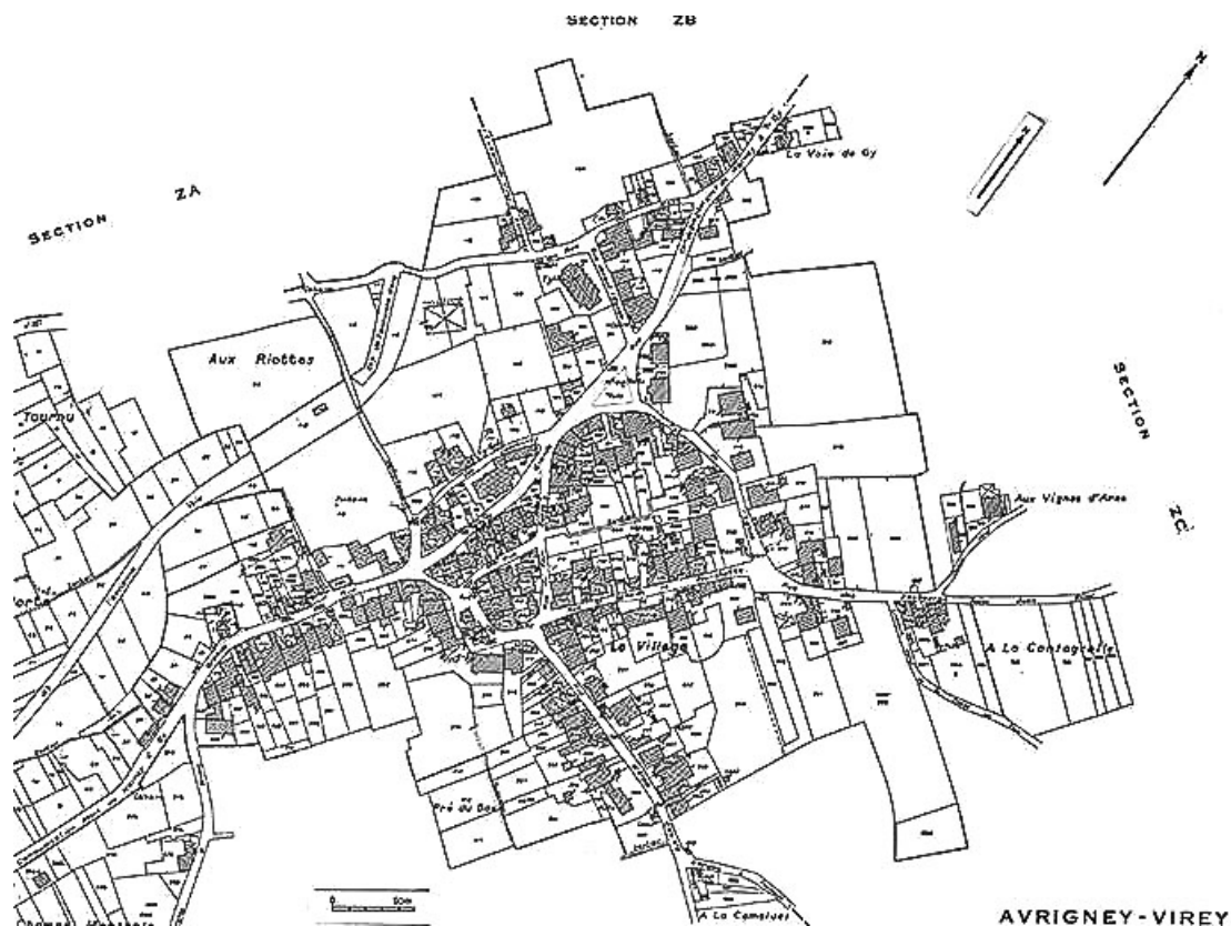
Plan portant le repérage. Extrait du cadastre de 1977, section B1. 70, Avrigney-Virey