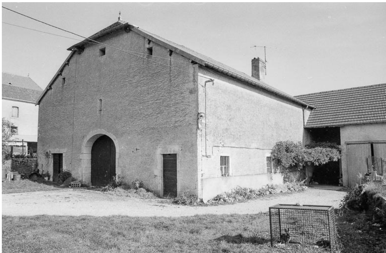
Ferme cadastrée 1960 A2 238, située rue des Prés : partie agricole. 70, Avrigney-Virey