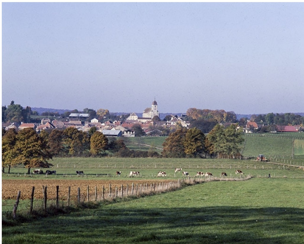
Vue d'ensemble. 70, Avrigney-Virey