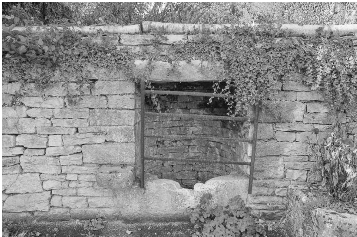
Vue du puits situé sur le chemin menant de Cult à Charcenne. 70, Avrigney-Virey