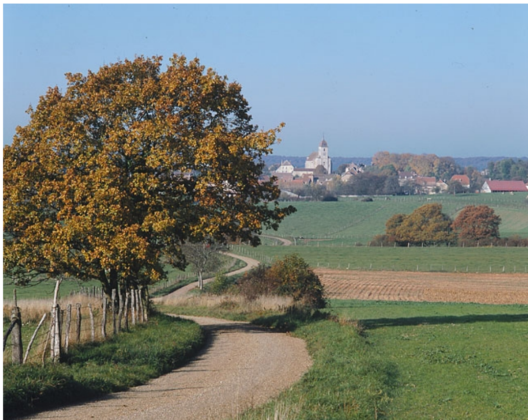
Vue d'ensemble. 70, Avrigney-Virey