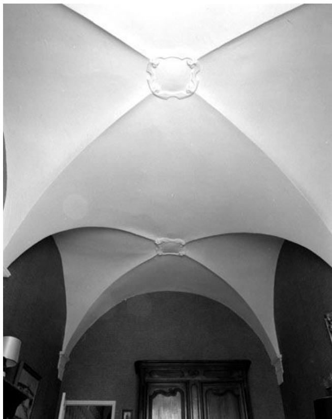
La voûte de la chapelle.