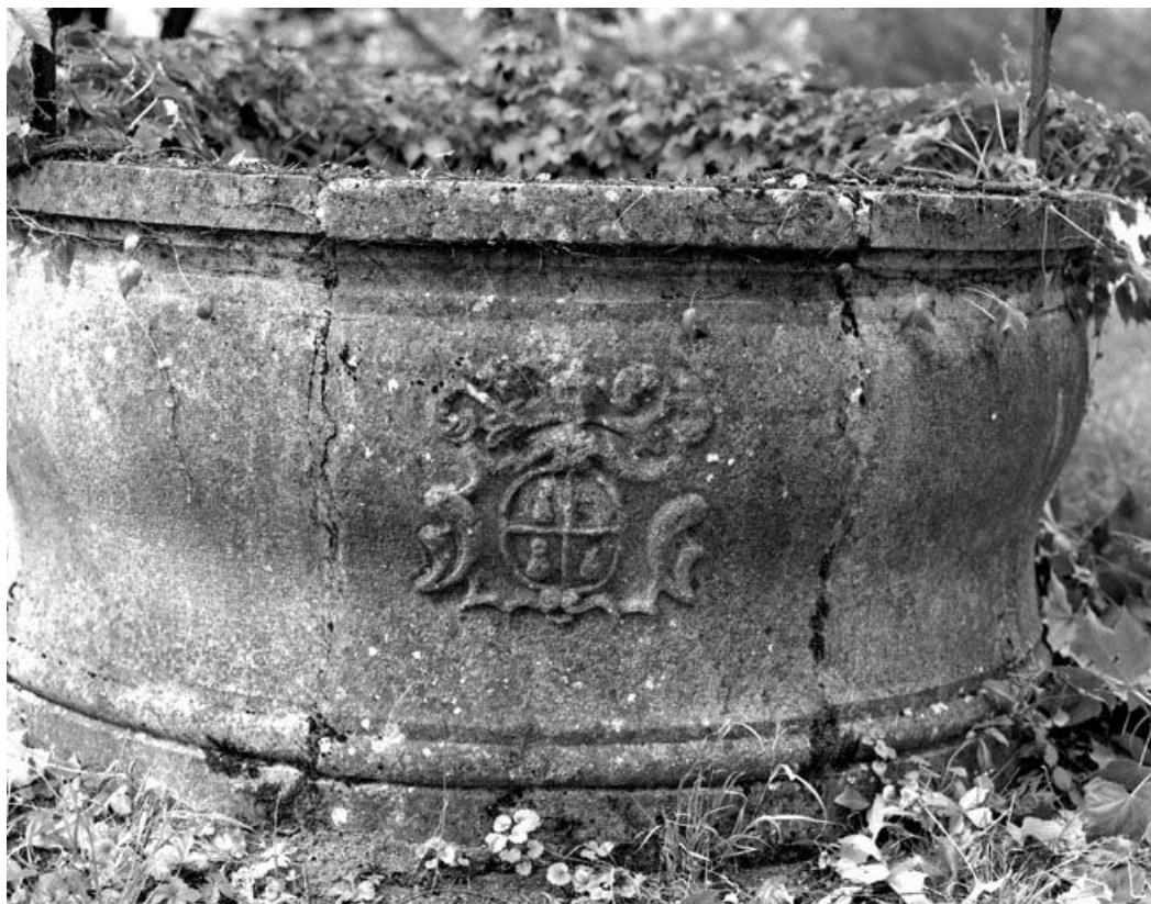
Blason sur la margelle du puits.