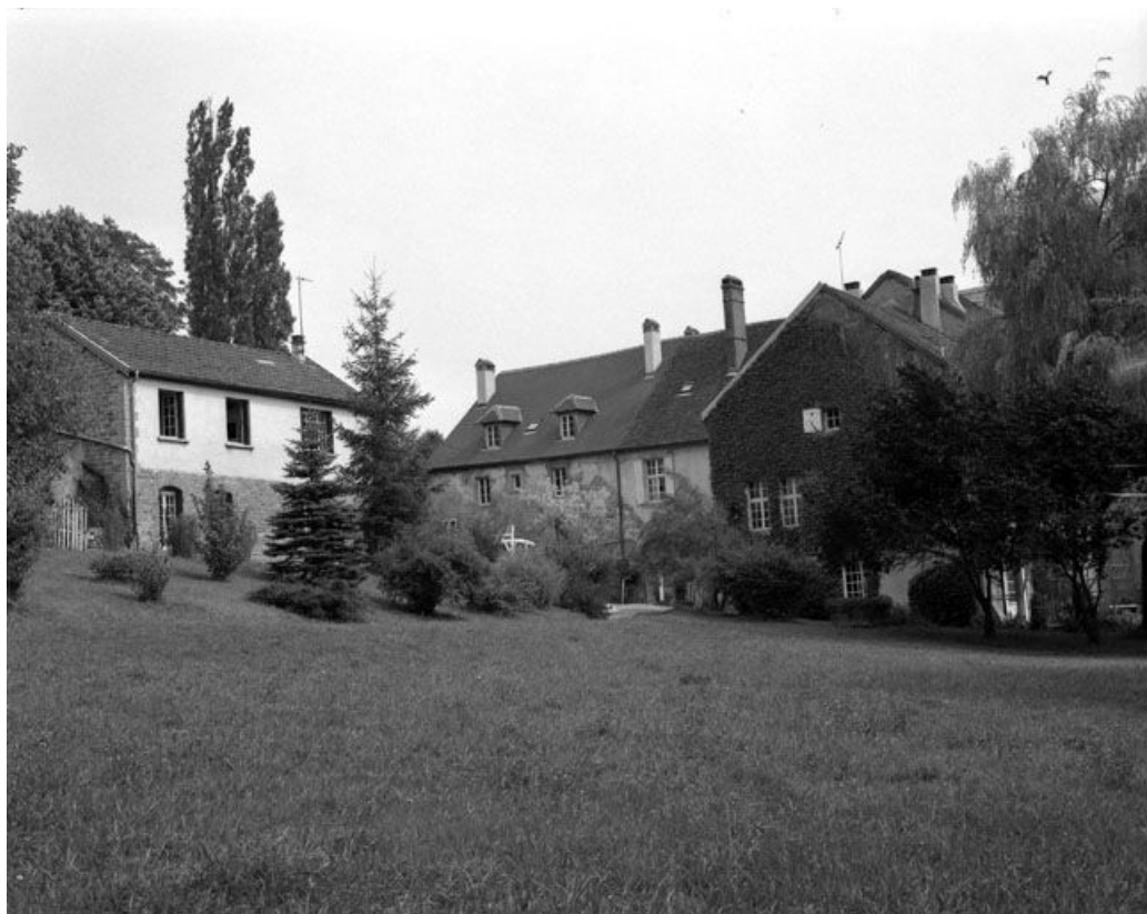
Façade postérieure : vue de trois quarts gauche.