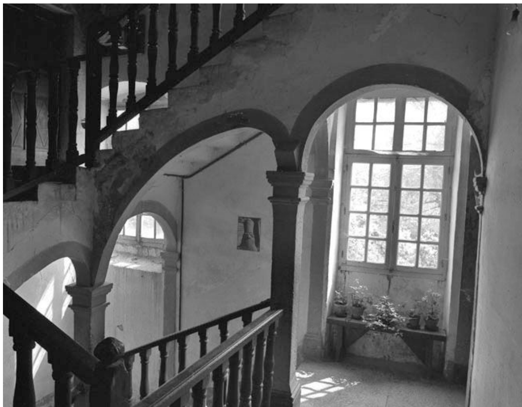
Escalier intérieur : premier étage.