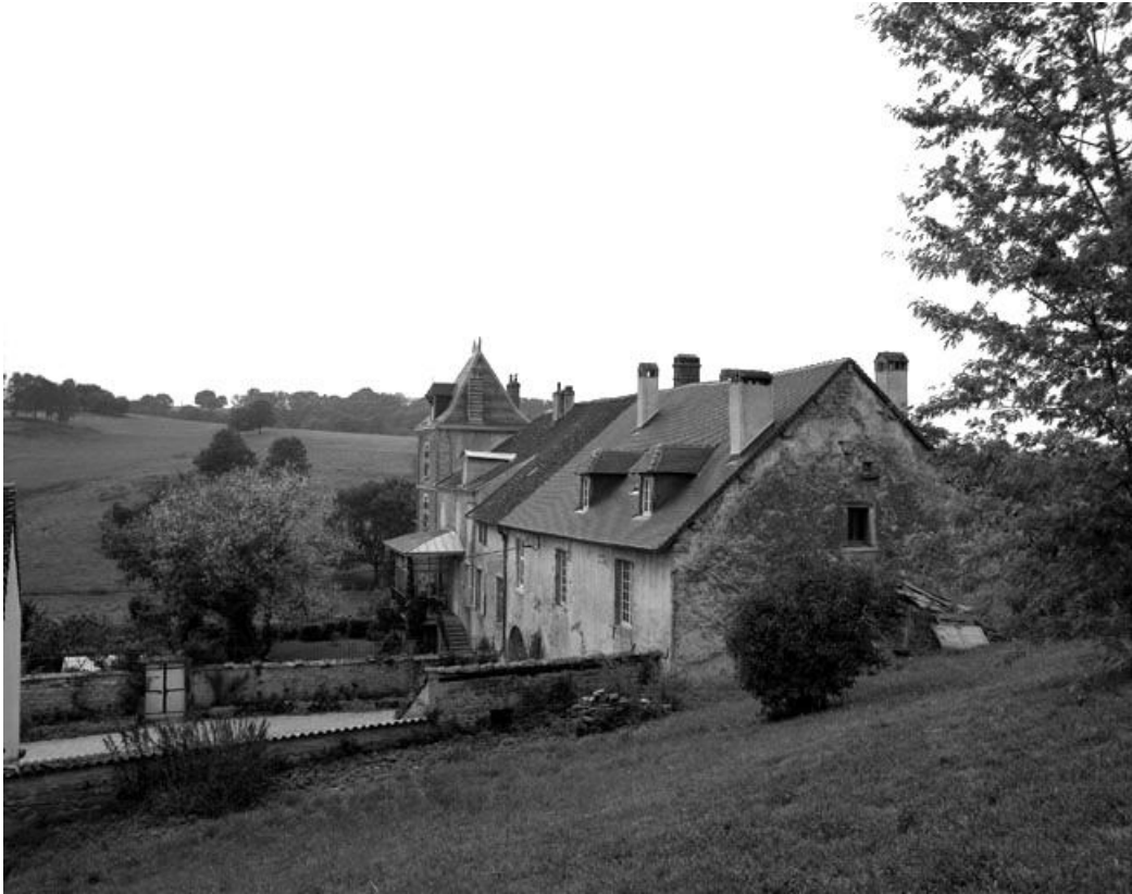
Vue générale depuis l'est.