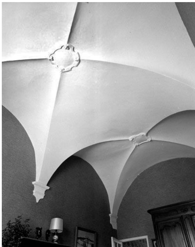
La voûte de la chapelle.