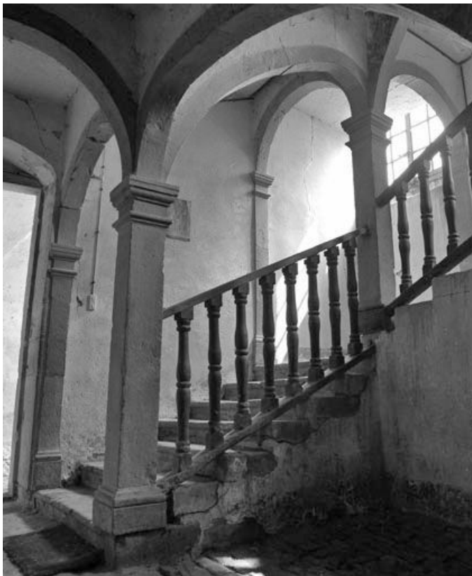
Escalier intérieur : première volée.