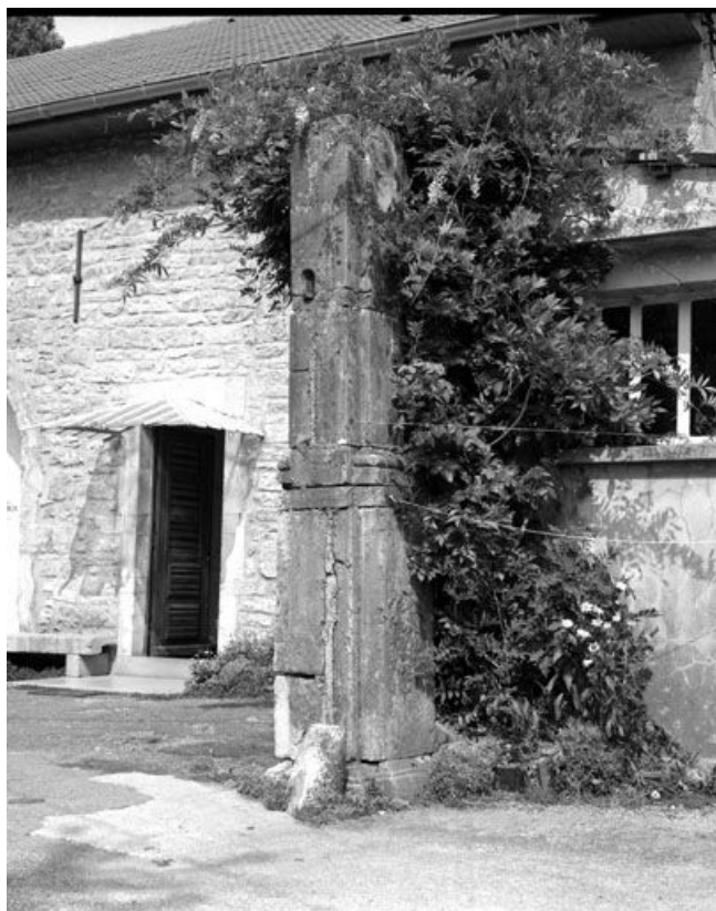
Pilier droit du portail d'entrée de la cour.