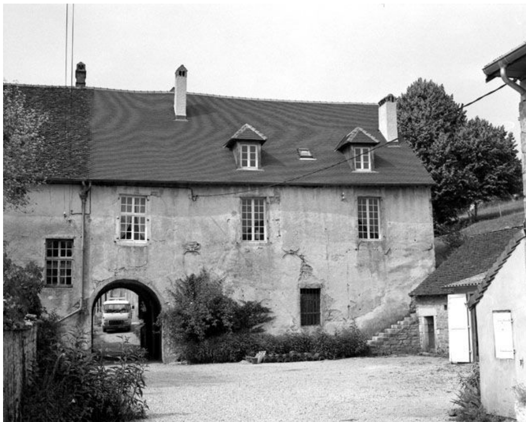
Façade antérieure : partie droite.