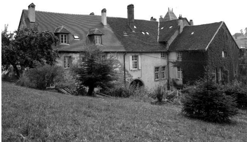
Façade postérieure : vue de trois quarts droit.