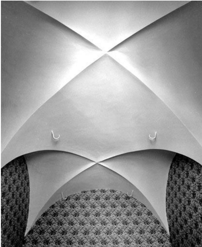
La voûte du poêle.