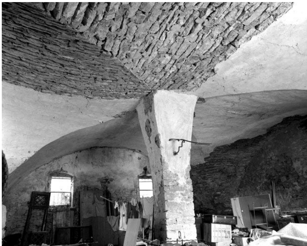
Pièce voûtée au rez-de-chaussée : la voûte.