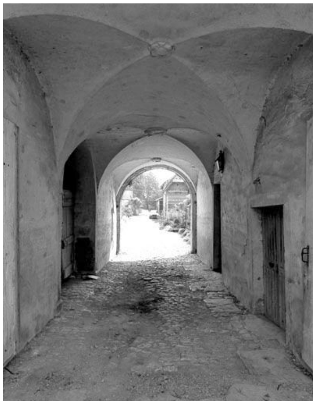
Le passage couvert.