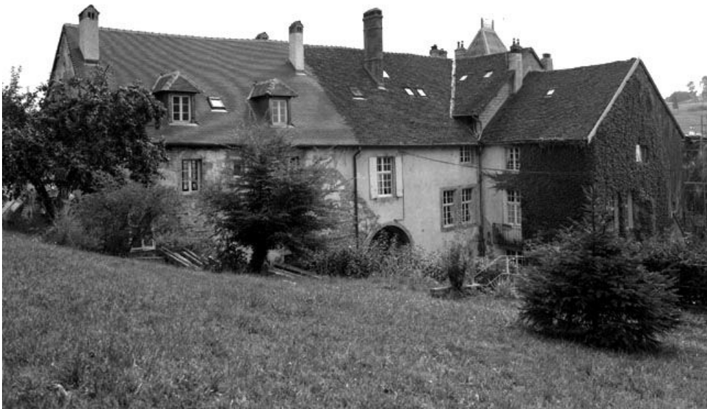
Façade postérieure : vue de trois quarts droit.