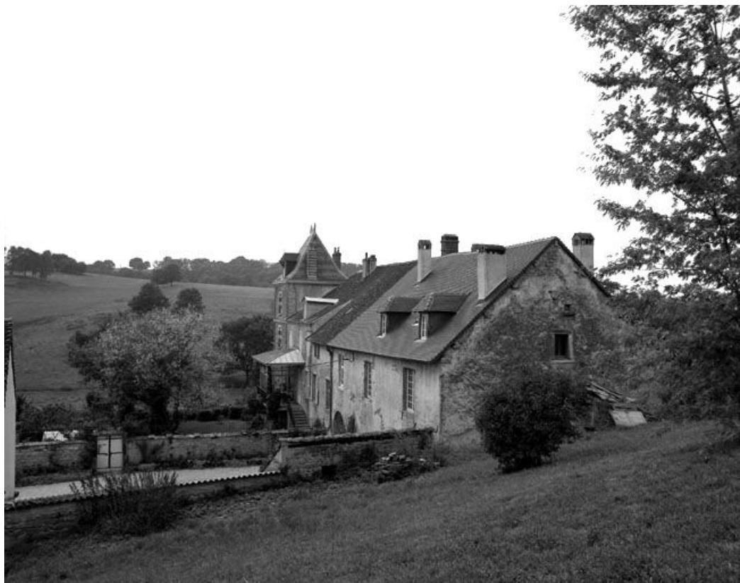
Vue générale depuis l'est.