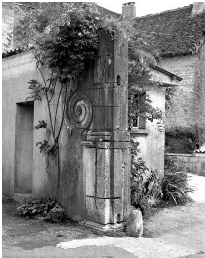
Pilier droit du portail d'entrée de la cour.