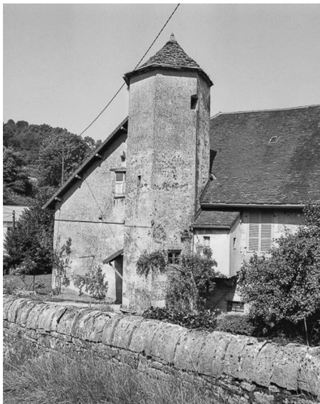
Vue du muret et de la tour.