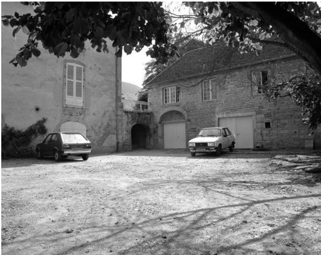
Bâtiment à droite de la cour : partie gauche.