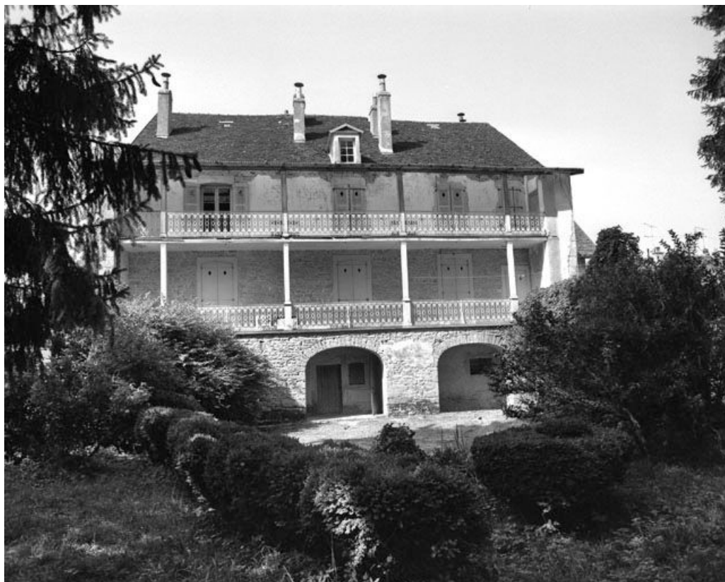
Façade postérieure vue de face.