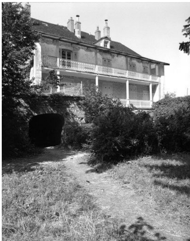
Façade postérieure vue de trois quarts.