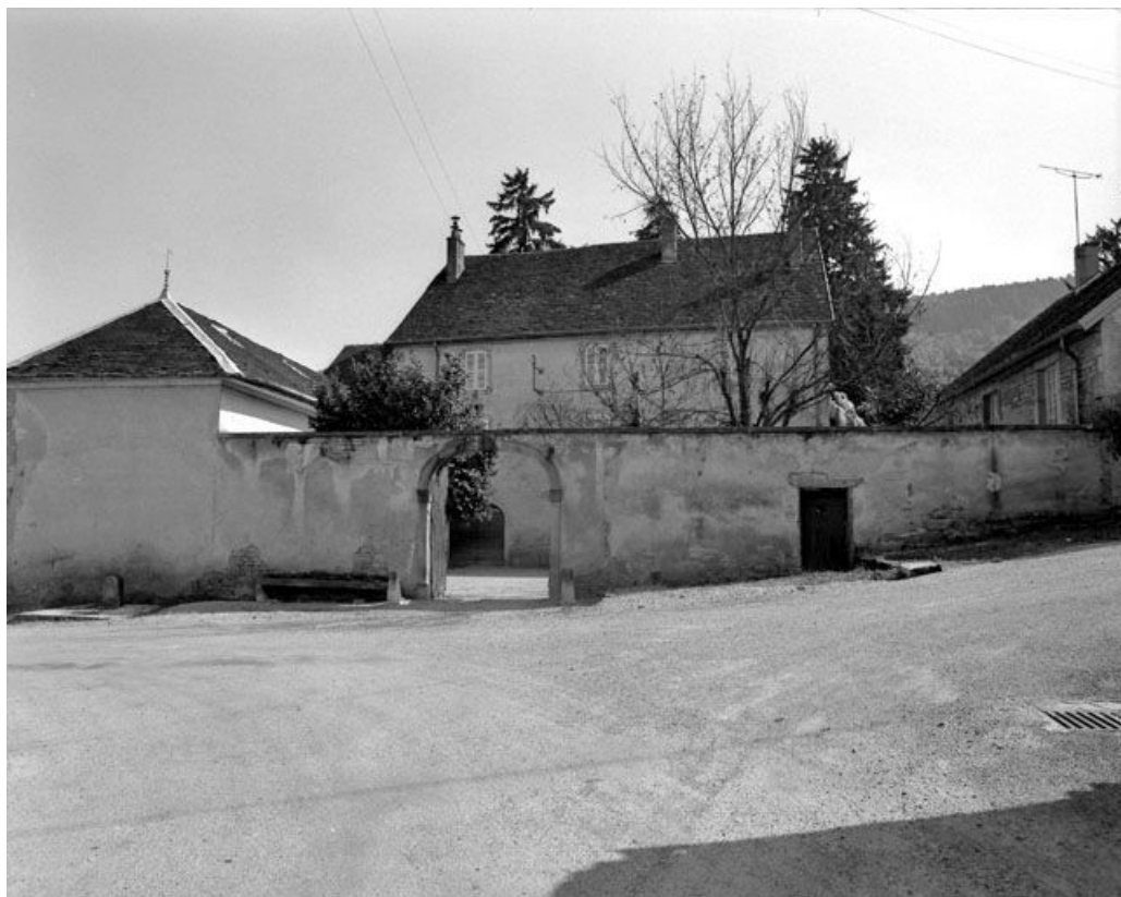
Vue générale depuis la rue.