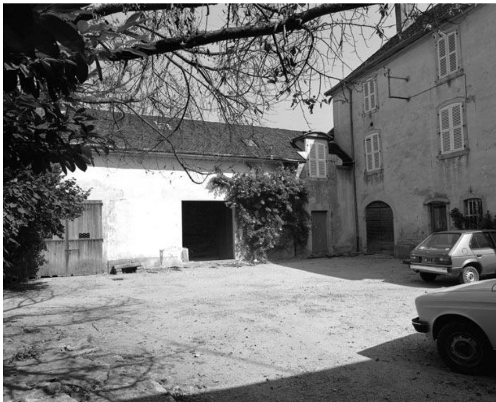
Bâtiment à gauche de la cour.