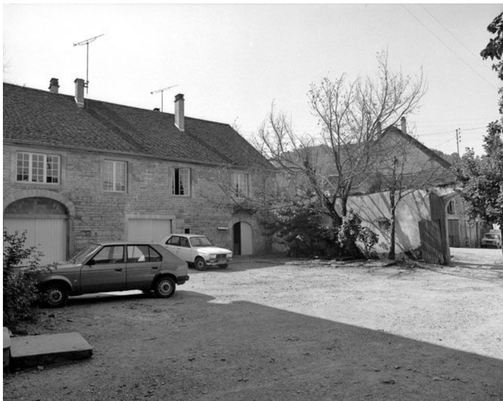
Bâtiment à droite de la cour : partie droite.