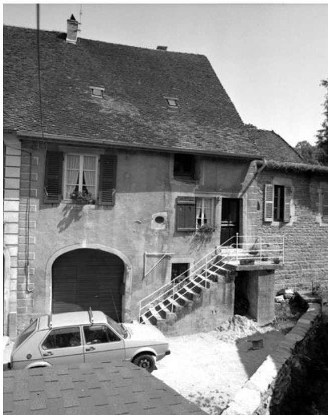
Façade antérieure vue de face.