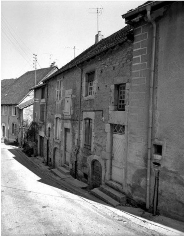
Façade antérieure vue de trois quarts droit.