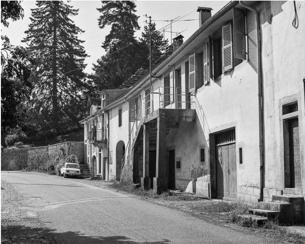
Façade antérieure vue de trois quarts droit.