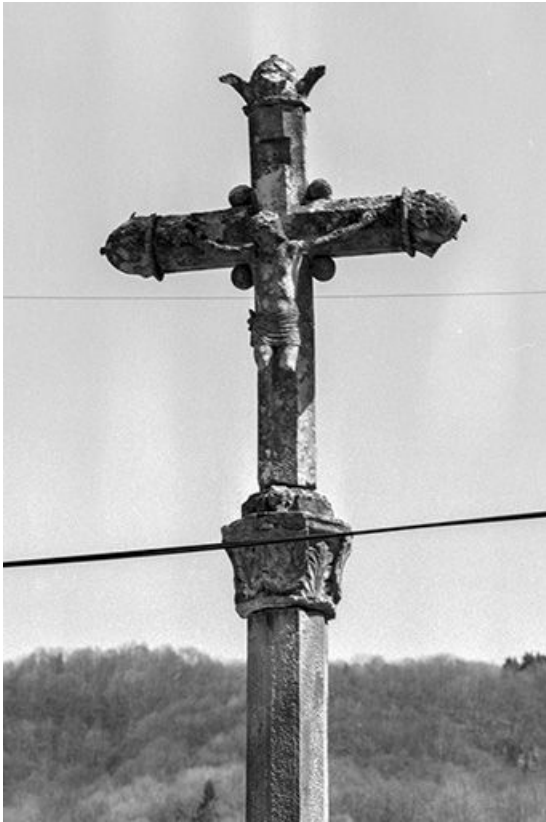
Partie supérieure, vue de face.