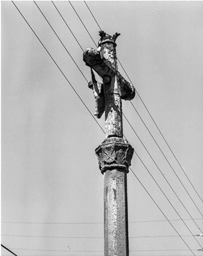
Partie supérieure vue de trois quarts arrière.