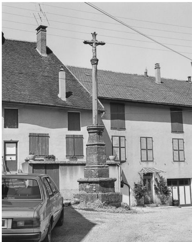
Vue du revers.