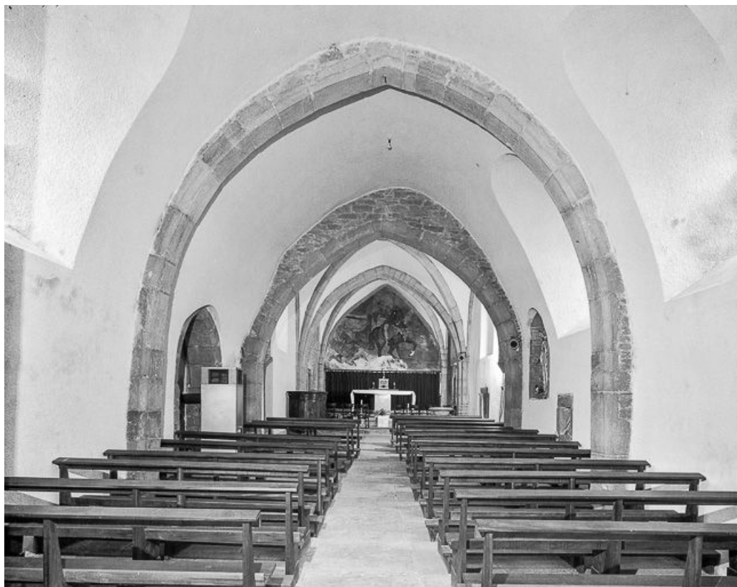
Intérieur : nef et chœur vus depuis l'entrée.