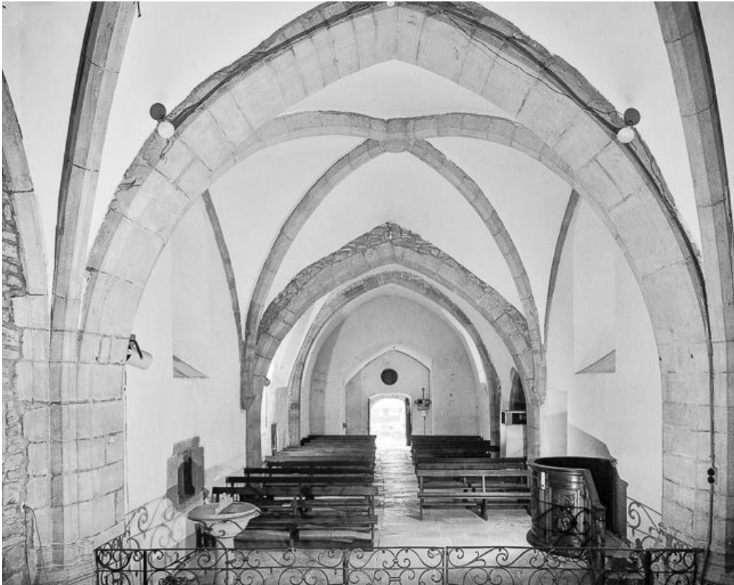
Intérieur : nef vue depuis le chœur.