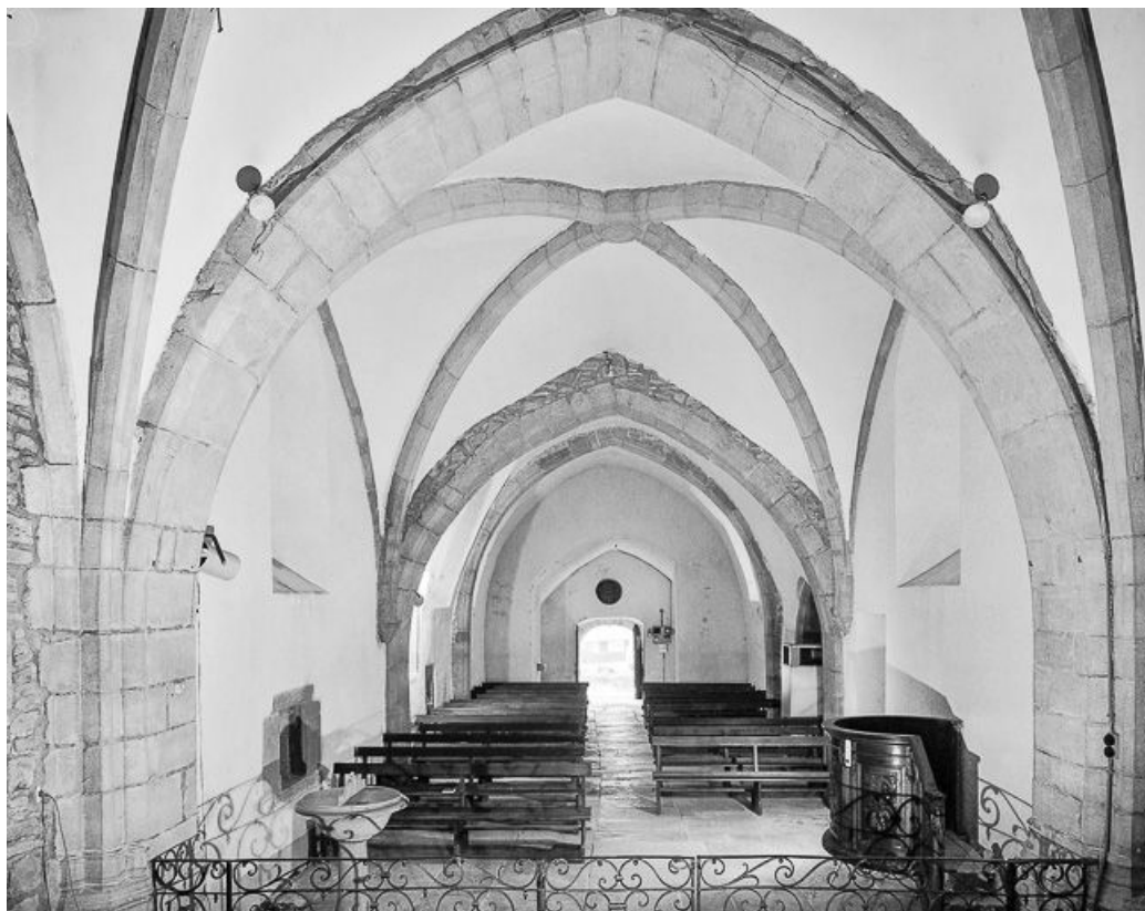
Intérieur : nef vue depuis le chœur.