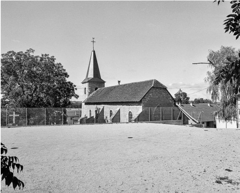
Face droite et chevet.