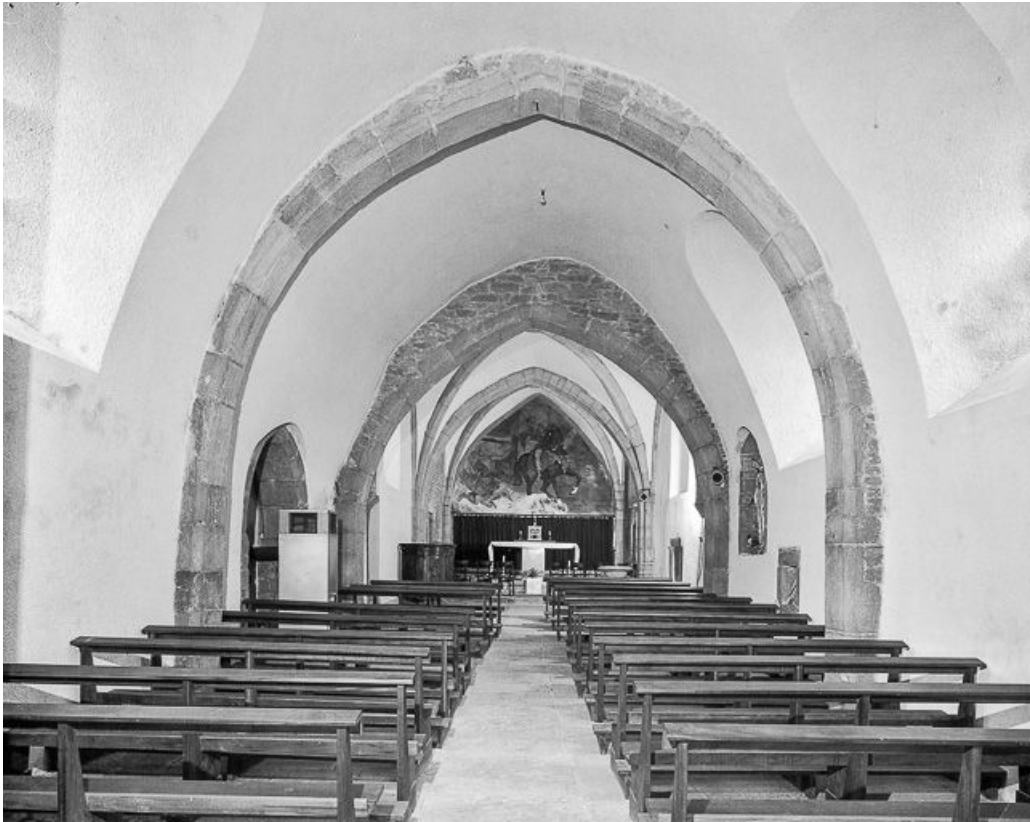
Intérieur : nef et chœur vus depuis l'entrée.