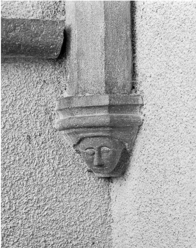
La chapelle : détail d'un culot.