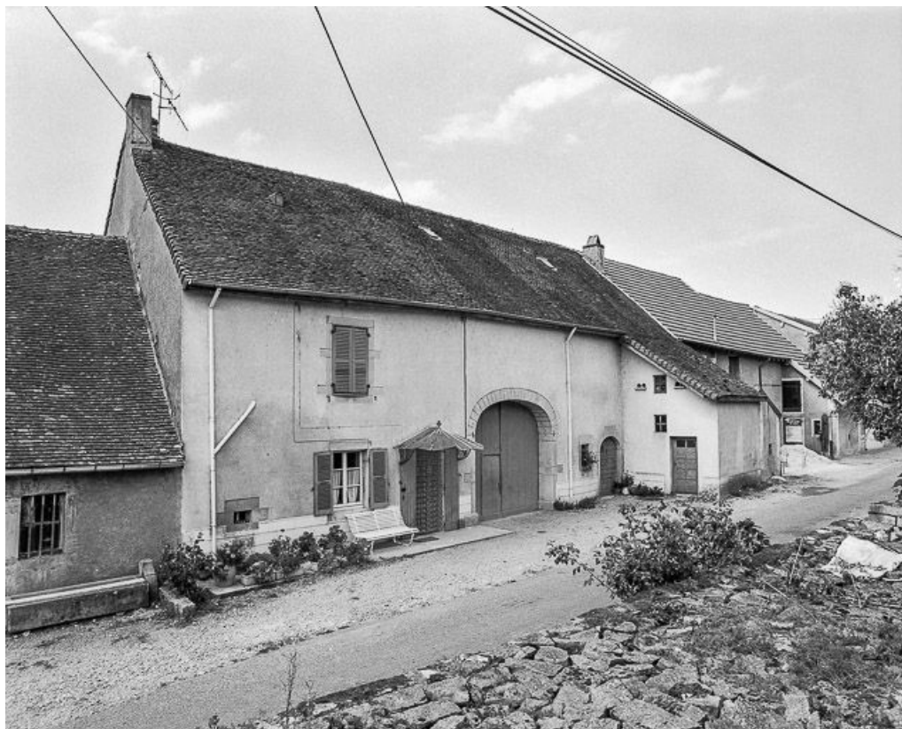
Maisons et fermes situées route Principale.