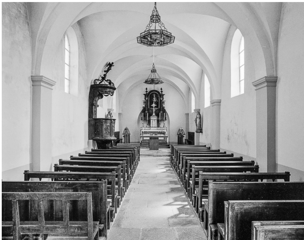
Nef et chœur vus depuis l'entrée.