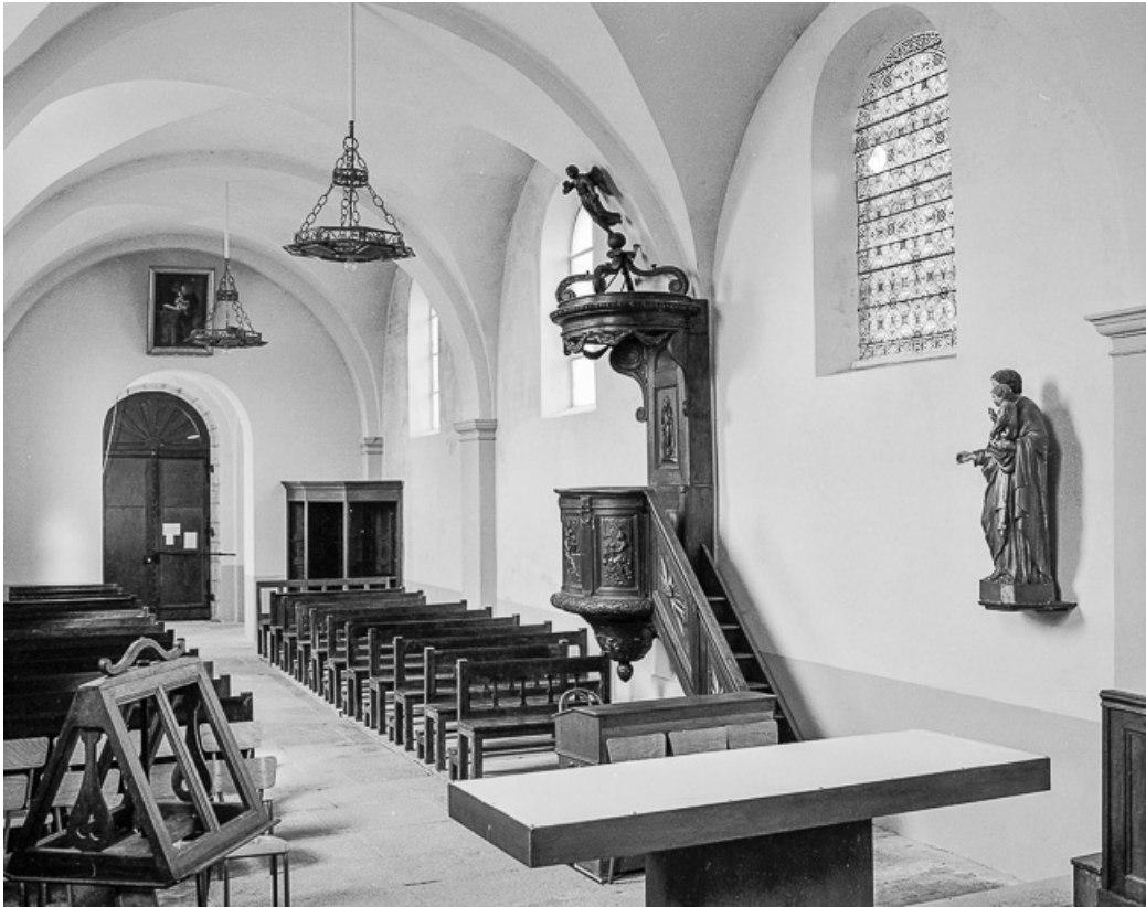
Elévation gauche de la nef vue depuis le chœur.