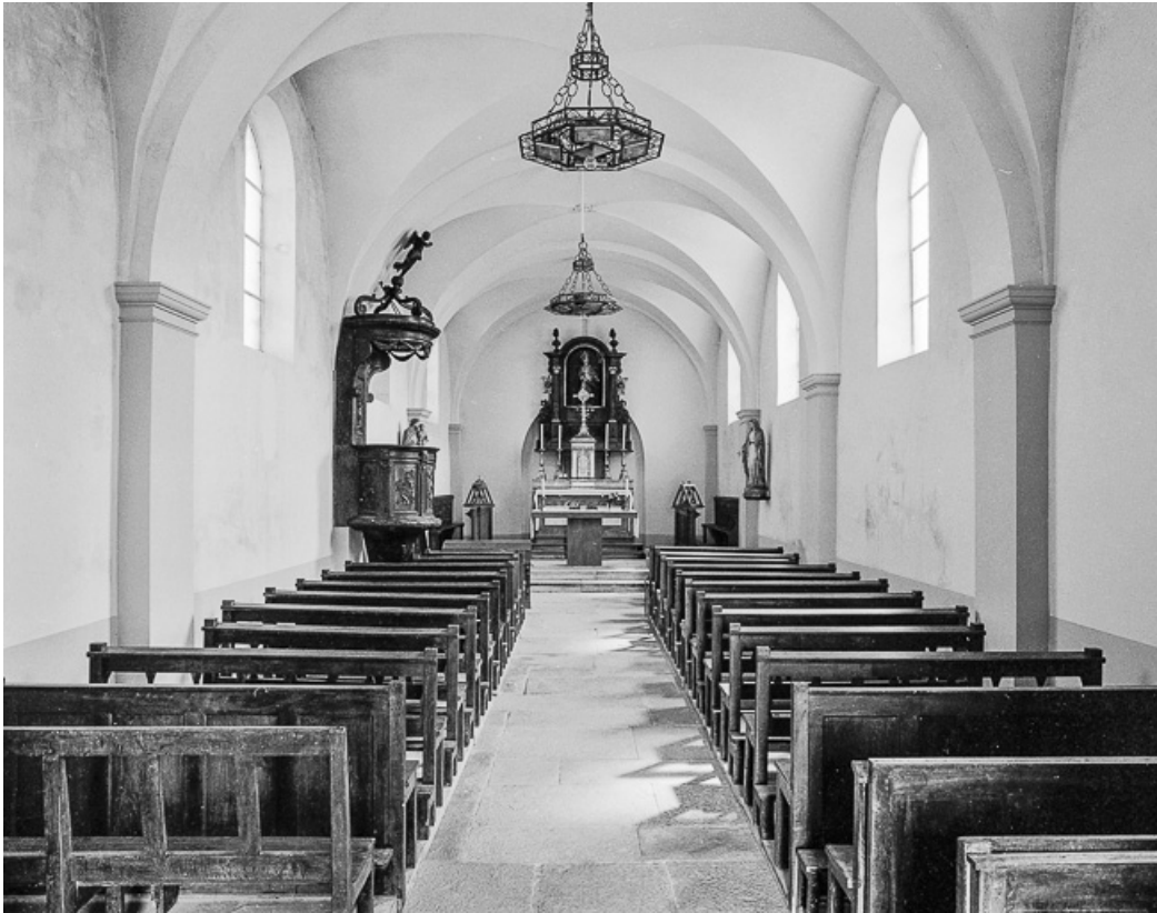
Nef et chœur vus depuis l'entrée.