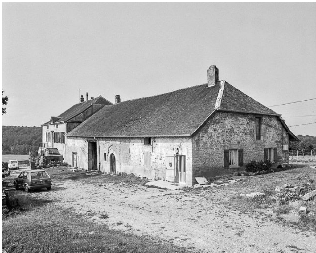
Vue générale de trois quarts droit.