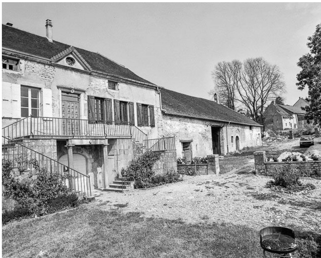
Vue générale de trois quarts gauche.