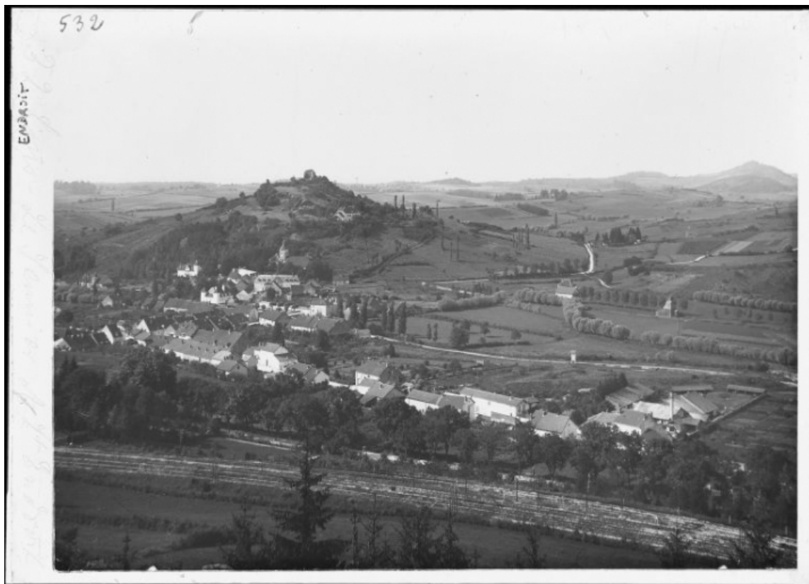
Le village et la colline du château fort vus depuis Montciel.