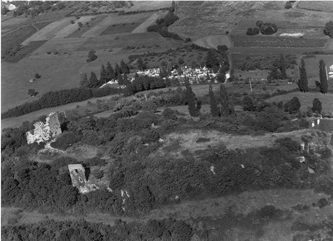
Vue aérienne en 1956