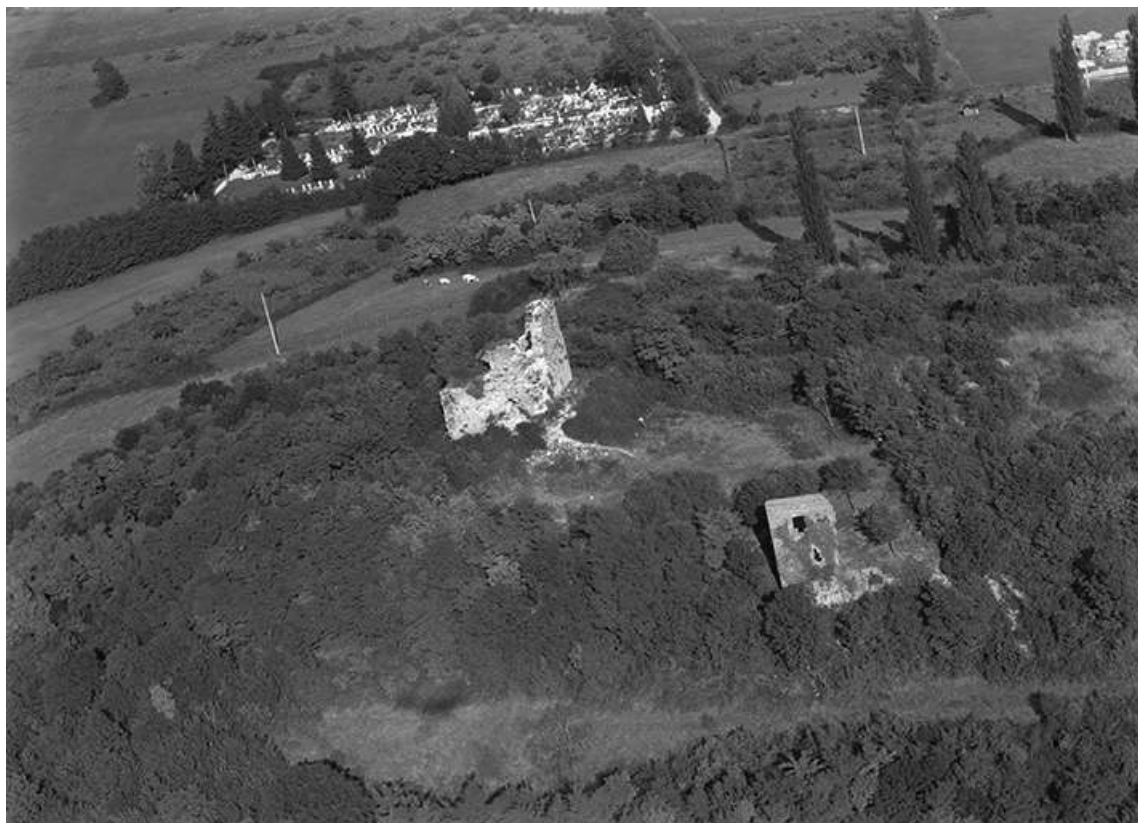
Vue aérienne en 1956.