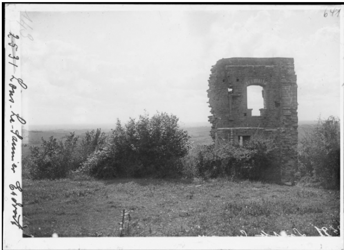
Porte située au sud-ouest du donjon.