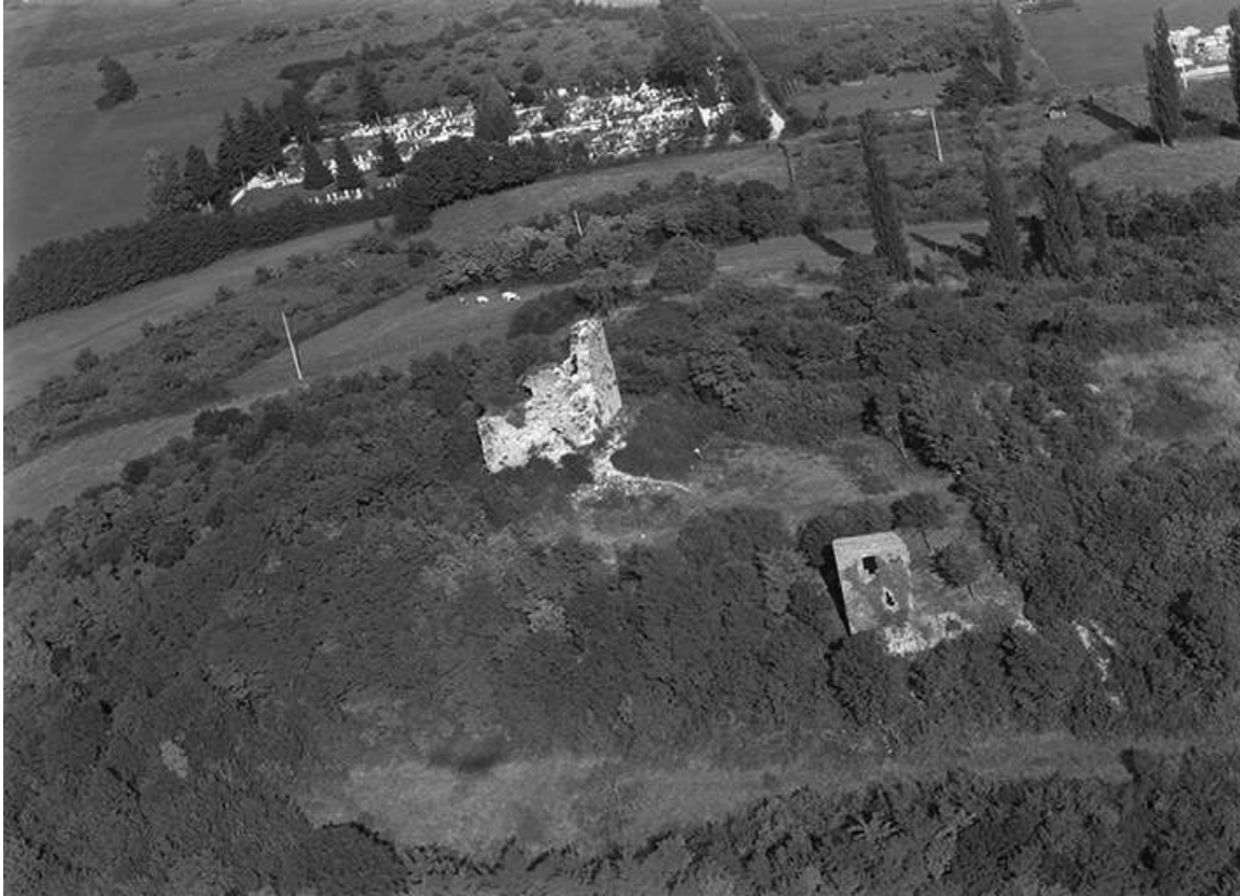
Vue aérienne en 1956.