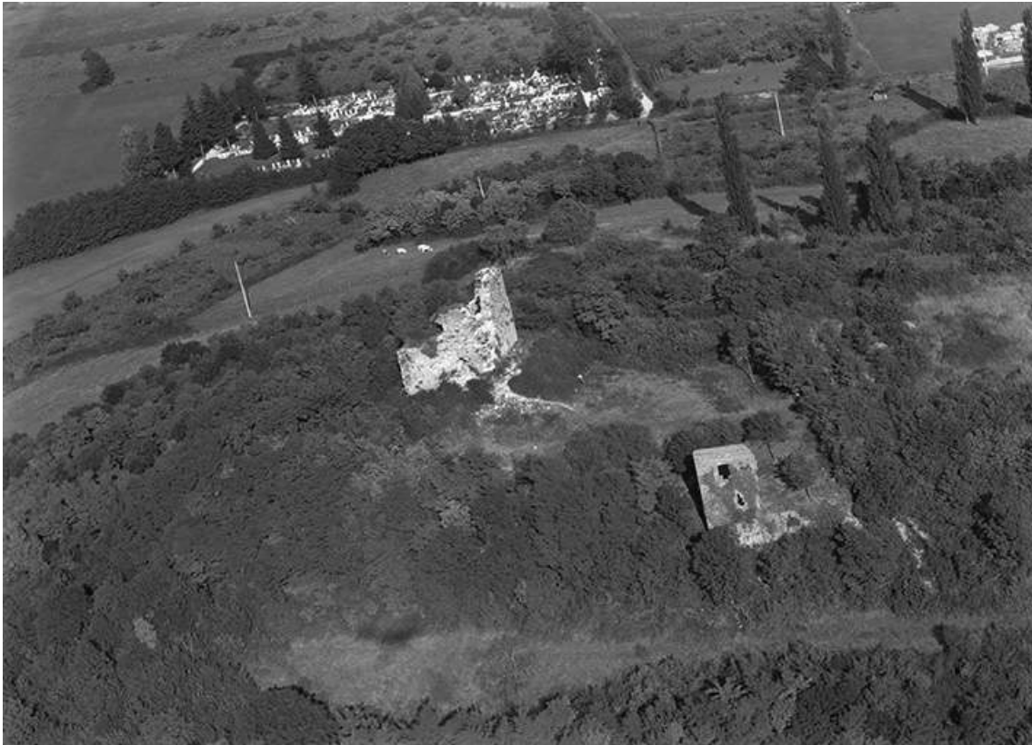
Vue aérienne en 1956.