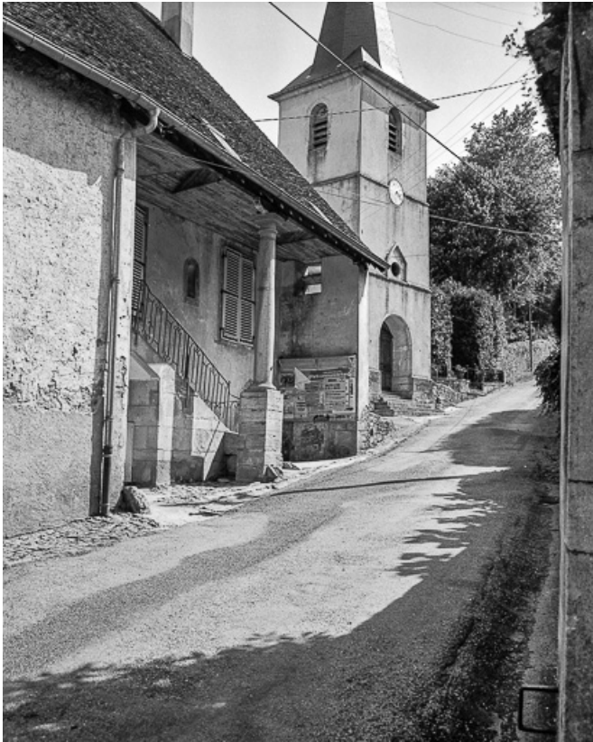
Façade antérieure : partie droite vue de trois quarts gauche.