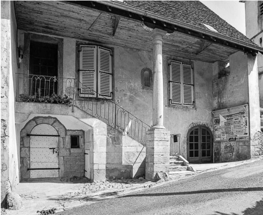
Façade antérieure, partie droite.