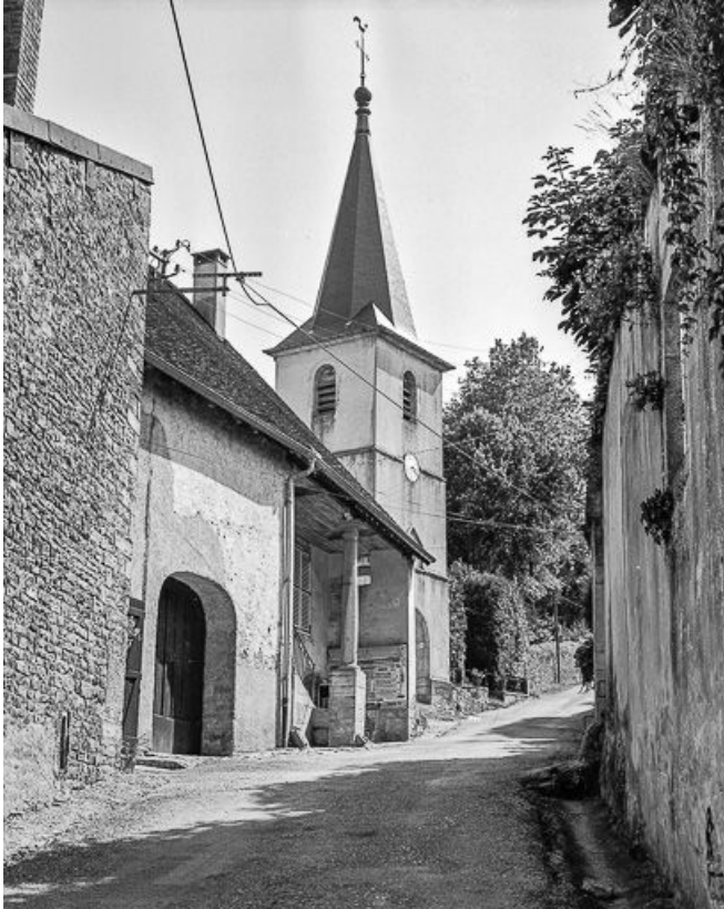
Façade antérieure : vue d'ensemble de trois quarts.