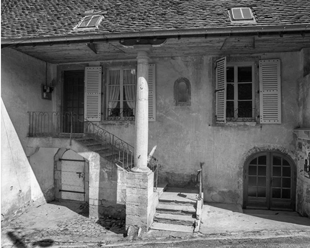
Façade antérieure : partie droite vue de face.