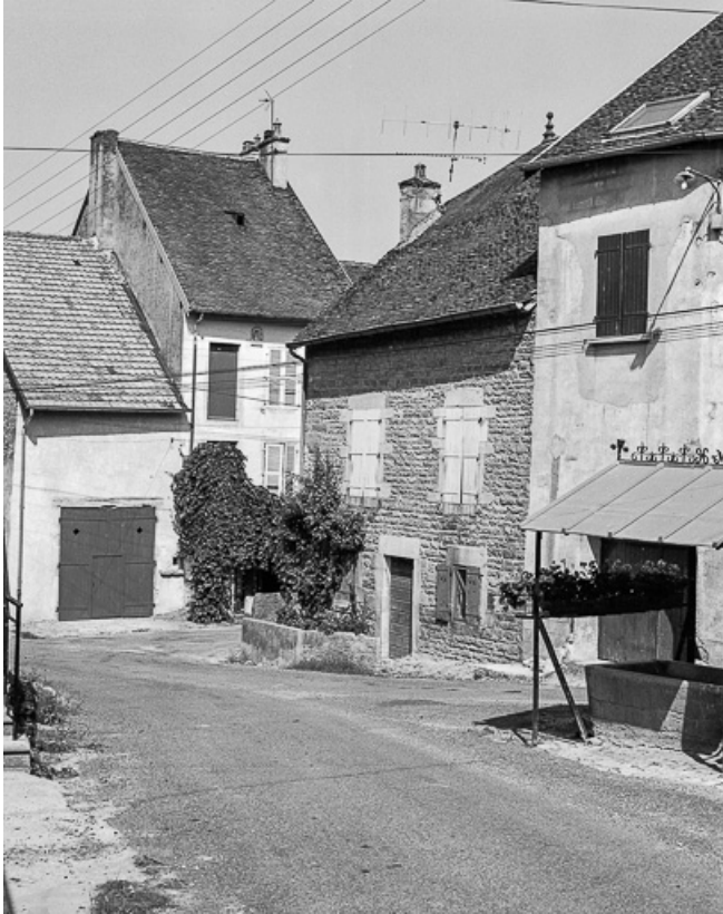
Façade antérieure vue de trois quarts droit.