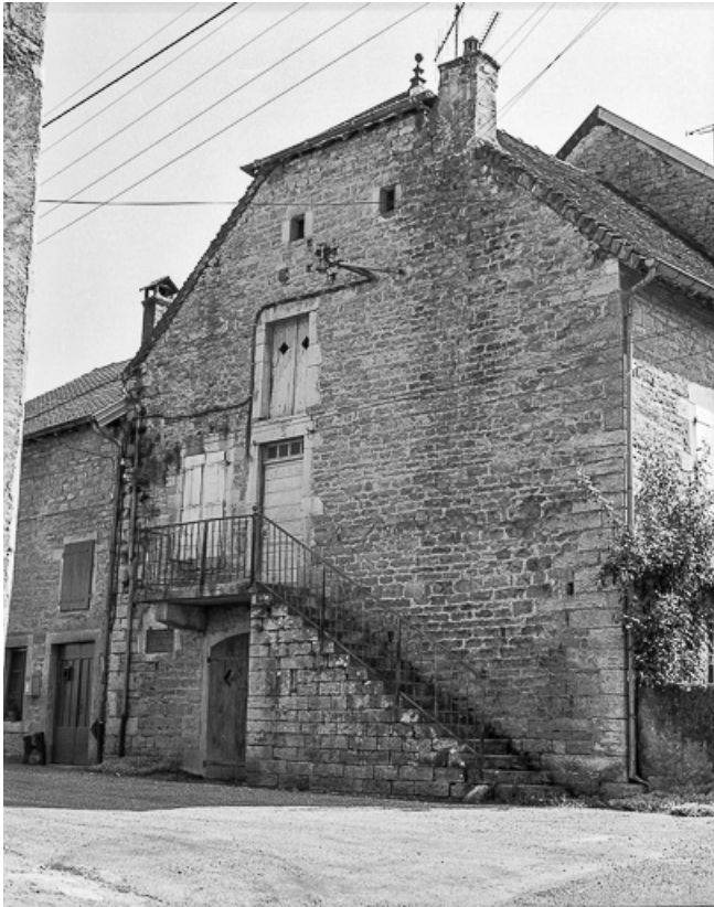
Façade latérale gauche. 39, Moiron rue de l' Eglise