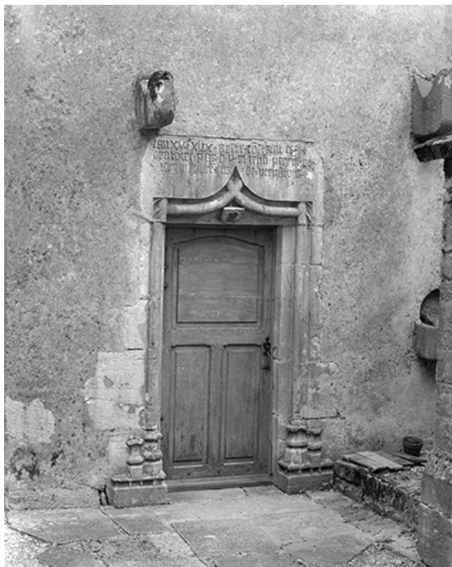
Porte de la chapelle gauche.