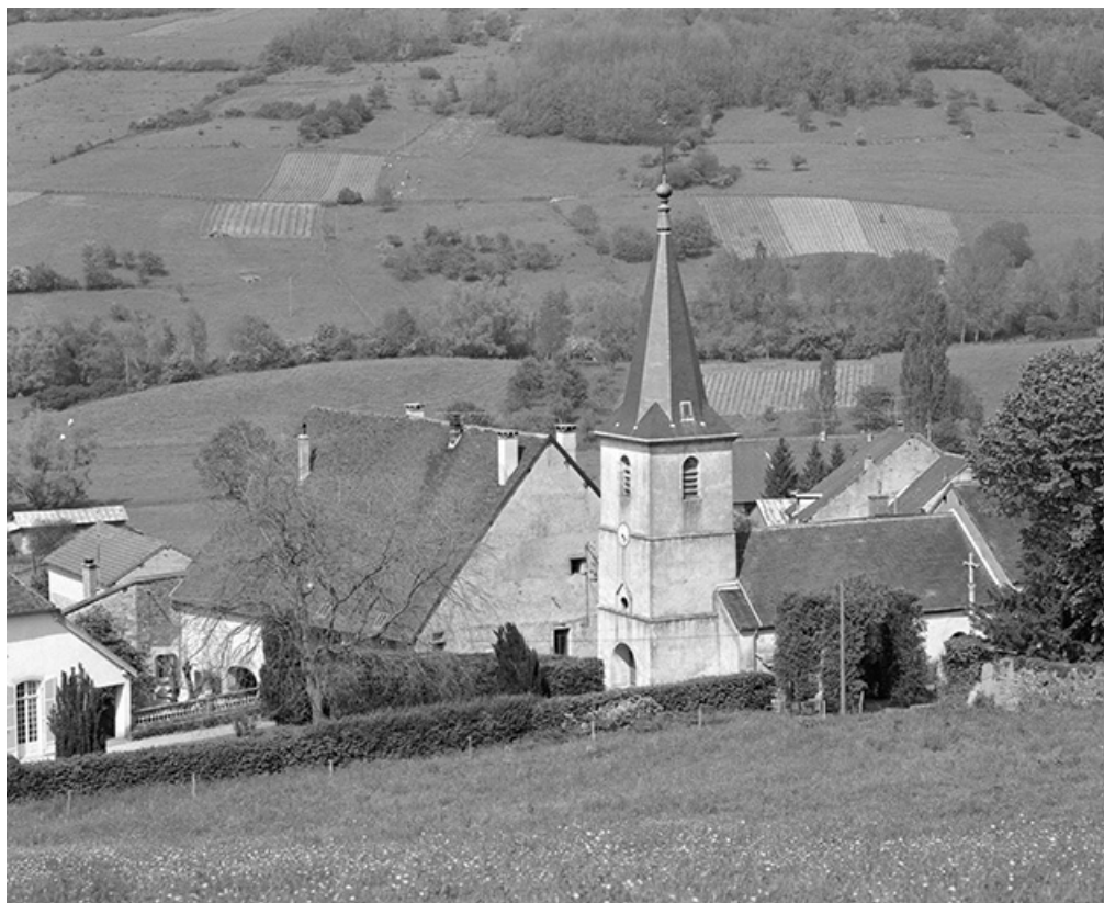
Façade antérieure et face droite.