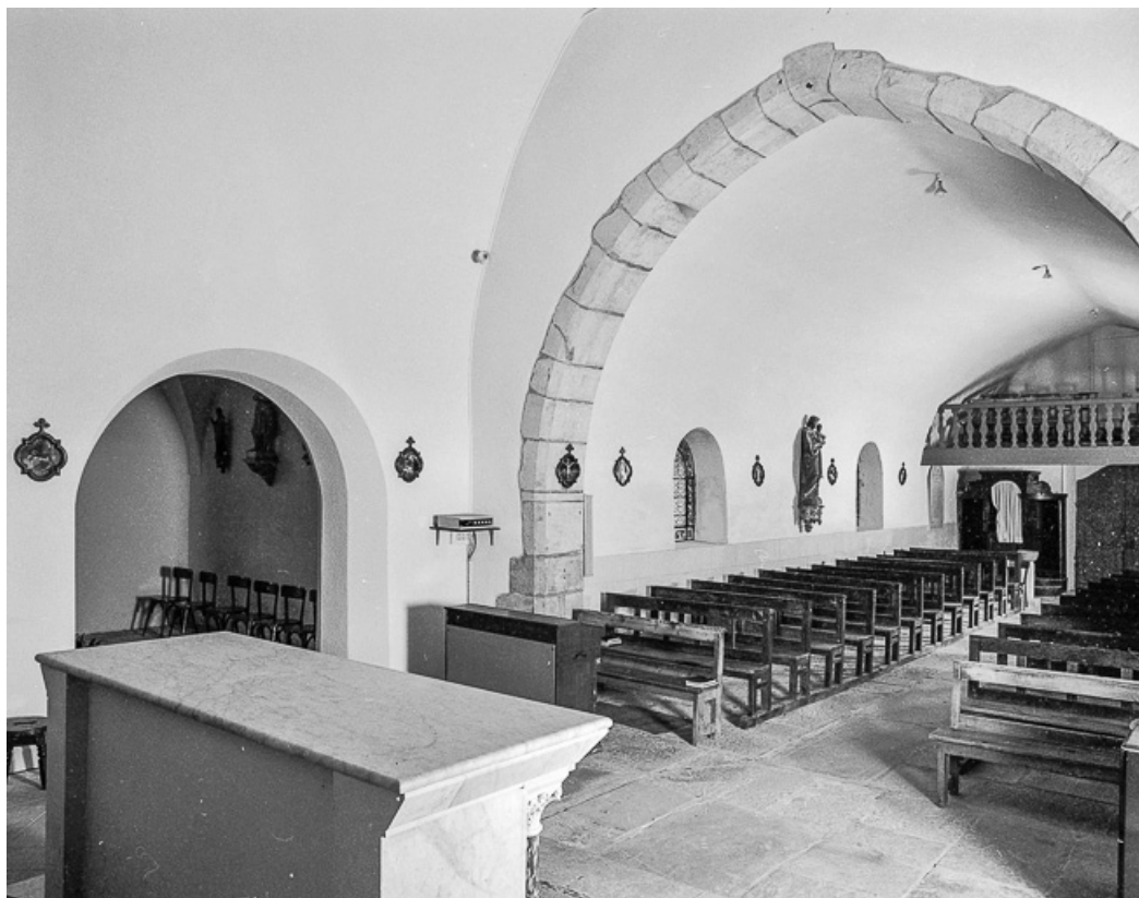
Élévation droite vue depuis le chœur.