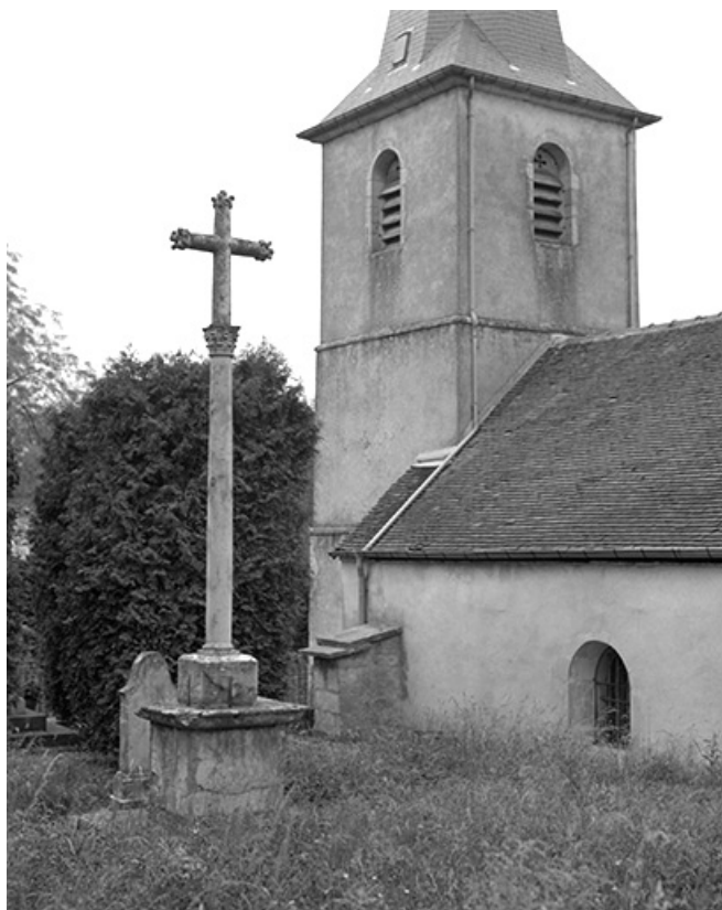
Tour-clocher et croix monumentale.