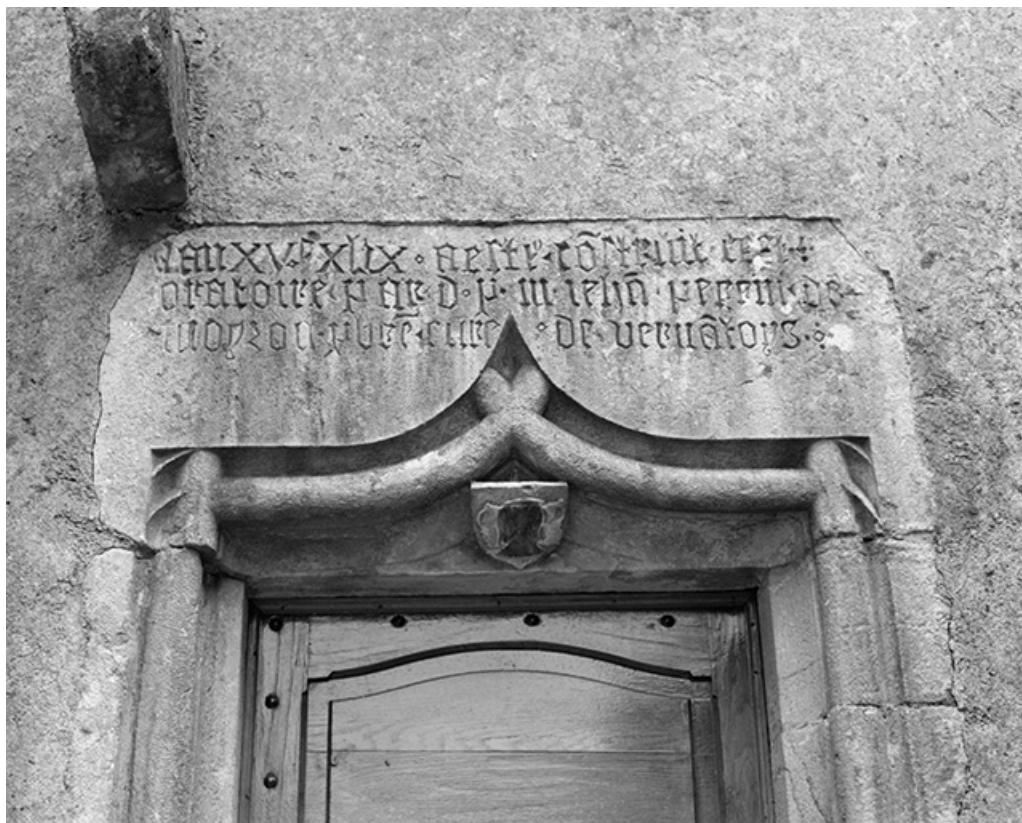
Inscription sur le linteau de la porte d'entrée de la chapelle gauche. 39, Moiron rue de l' Eglise