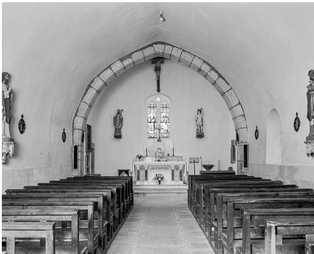
Nef et chœur vus depuis l'entrée.